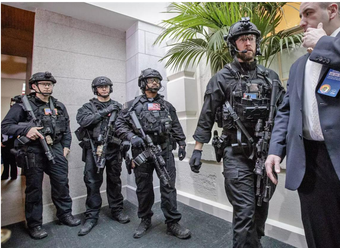
Equipo de Contraataque (CAT) del Servicio Secreto de los Estados Unidos de América