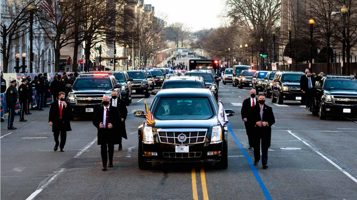
Caravana presidencial recorre las calles, agentes del USSS escoltan a pie el automóvil presidencial