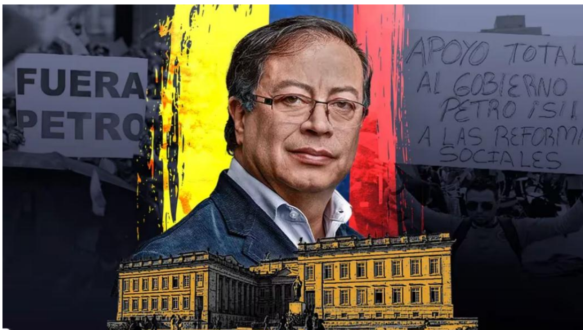
Gustavo Francisco Petro Urrego, presidente constitucional de la República de Colombia.

El Economista Gustavo Francisco Petro Urrego, actual presidente de Colombia, ha sido durante toda su vida un personaje polémico. Si algo es seguro es que no ha pasado desapercibido nunca. Durante la última campaña presidencial, la derecha (y la ultraderecha) colombiana, teniendo en control de los bancos y de todo el sistema financiero, de los medios de comunicación de masas, y del gobierno, tenían todo para ganar, pero para asegurarse, hicieron una campaña masiva de desprestigio al actual mandatario, un proceso muy interesante de desinformación para generar miedo, desconfianza, malestar, e inseguridad en los electores, frente a la toma del poder político por la izquierda. Sobre todo, teniendo en cuenta que Petro fue guerrillero, y es que en Colombia hace mucho tiempo que se instaló la narrativa de que todo guerrillero es malvado,