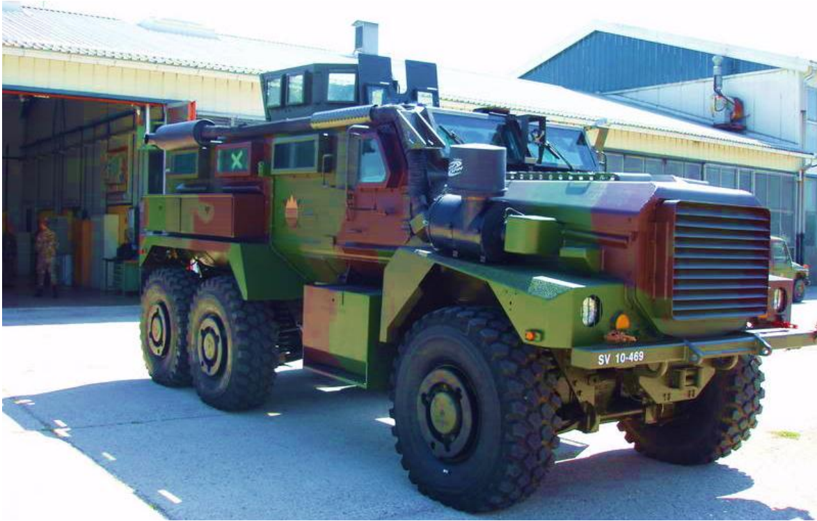
Eslovenia adquiere cada vez más vehículos con protección contra minas y explosivos improvisados.