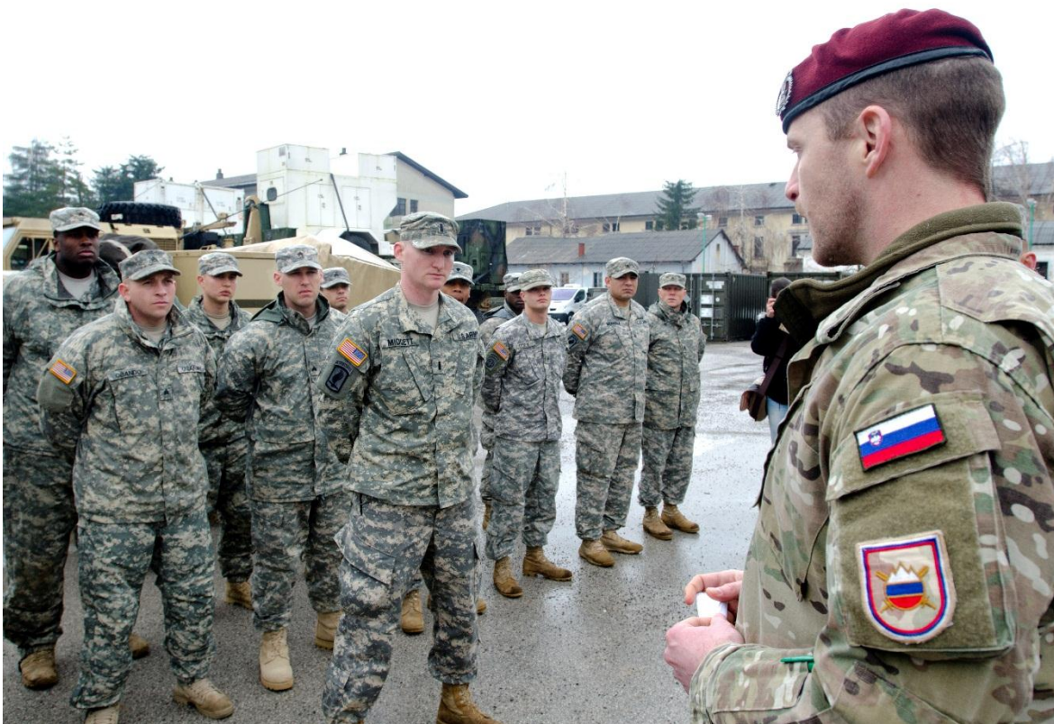
Oficial de Eslovenia con tropas de EE.UU. en un ejercicio conjunto en el marco de la OTAN.

asignadas al batallón de mantenimiento de la paz de la Fuerza Terrestre Multinacional con Italia, Hungría y Croacia. Eslovenia organizó su primer ejercicio de la PfP en 1998: “ Cooperative Adventure Exchange ”, un ejercicio multinacional de puesto de mando de preparación para desastres en el que participaron casi 6.000 soldados de 19 países miembros de la OTAN y de la PfP.