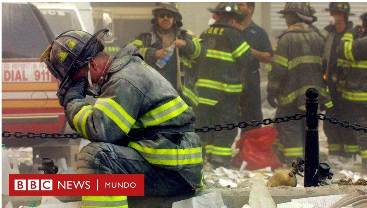
Escena dramática del 11 de septiembre en New York

Brasil rara vez entra en discusiones sobre terrorismo o contraterrorismo. Gran parte de la extensa literatura que hay sobre el tema en el país menciona hechos guerrilleros de izquierda en las décadas de 1960 y 1970.