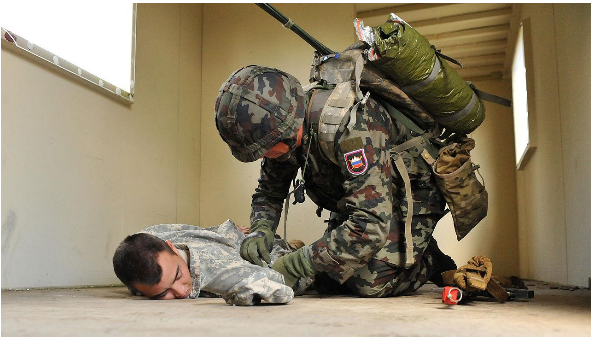
Entrenamiento conjunto con tropas de los Estados Unidos de Norteamérica.

Eslovenia forma parte de las Naciones Unidas, la OTAN y la Unión Europea, y apoya los esfuerzos de estas organizaciones en operaciones de mantenimiento de la paz y actividades humanitarias. Las Fuerzas Armadas de Eslovenia participan en diversas misiones desde 1997, cuando la primera unidad fue enviada a Albania para una operación humanitaria. Eslovenia ha continuado sus esfuerzos en la cooperación internacional participando en varias misiones en Afganistán, Irak, Chipre, Pakistán y otros países. La cantidad total de personal enviado a través de la contribución de Eslovenia a las misiones es de más de 15.000, pero algunas especulaciones superan los 20.000.