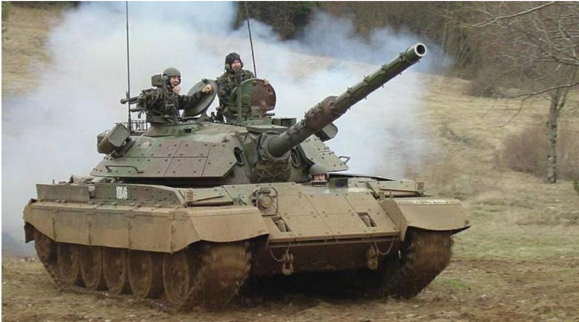
S Ravne M-55 S Main Battle Tank

HMG de 12,7 mm y algunos con Heckler & Koch GMG de 40 mm., siendo una de las compañías una compañía antitanque equipada con misiles Spike (ATGM) LR/MR.