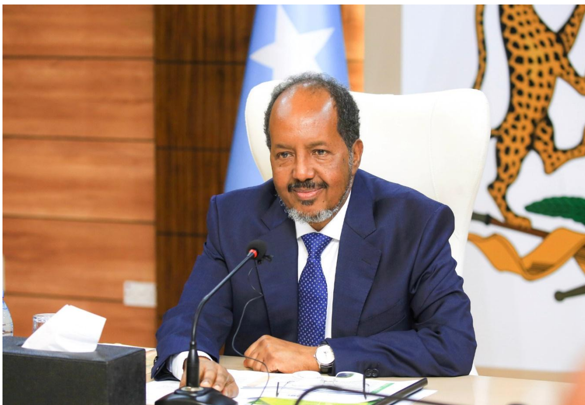
Hassan Sheikh Mohammed

Según lo que había anunciado el presidente de Somalia Hassan Sheikh Mohammed en 2022, el ejército de su país se encontraba preparado para resistir las operaciones del grupo terrorista al-Shabaab , la franquicia de al-Qaeda para el Cuerno de África, una vez que la Misión de Transición de la Unión Africana (ATMI), terminara su repliegue, después de diecisiete años. Pensado que su plan, con el título de: “ Guerra total al terrorismo ”, le daría, en solo cinco meses, la victoria definitiva. Aunque si es cierto que, en 2022, el gobierno federal somalí había logrado más avances en la lucha contra el terrorismo que en los cinco años anteriores.