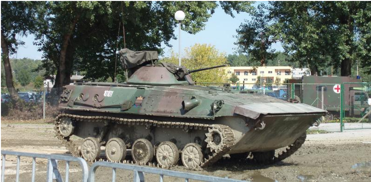
Yugoimport M-80A Infantry Fighting Vehicle

El ministerio de defensa de Eslovenia informó en 2020 que la artillería de ese país estaría equipada con obuses autopropulsados que aumentarían su potencia de fuego, su velocidad y su eficiencia. Se previó que esta compra se realizaría después de la compra de los vehículos blindados Pandur EVO en 2022-2023.