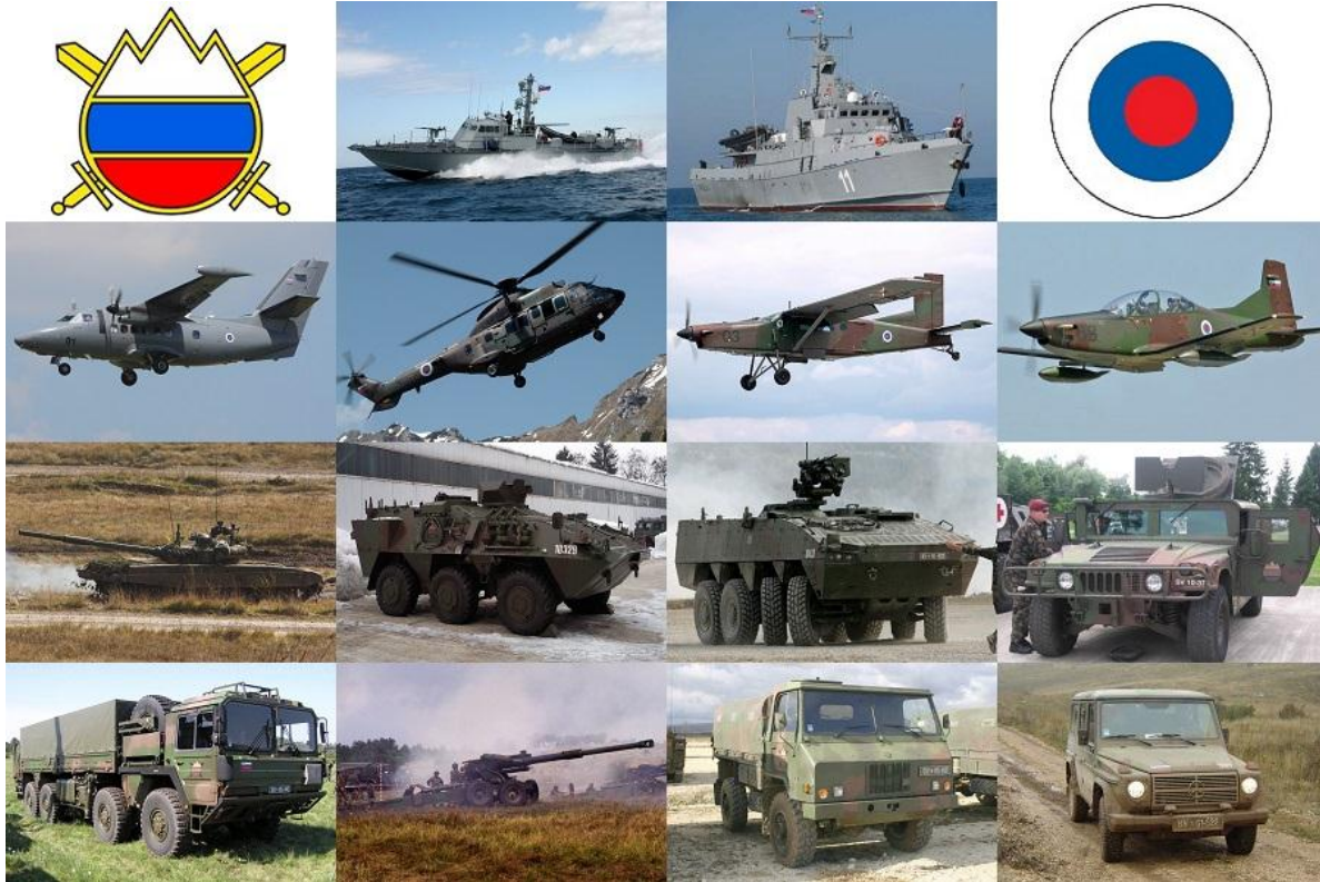
Parte del equipamiento militar de Eslovenia