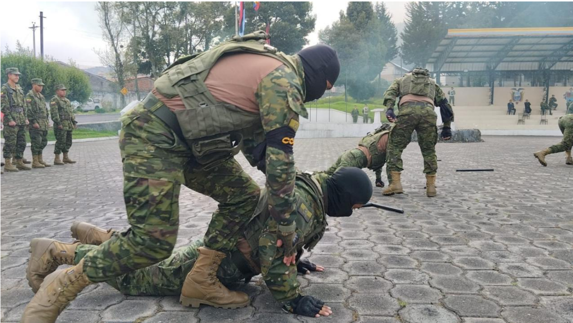
Entrenamiento de Fuerzas Especiales del Ejército del Ecuador.

La Escuela de Fuerzas Especiales de Comando, el GEK-9 es un organismo operativo independiente que transforma a los soldados en futuros comandos.