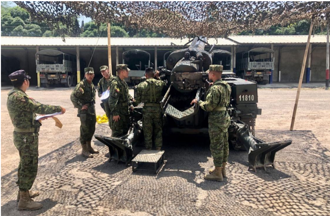
Personal de artillería de campaña en instrucción.

El Comando Conjunto de las Fuerzas Armadas es el máximo órgano de planificación, preparación y estrategia de las operaciones militares. Asesora en defensa nacional y está conformado por el jefe del Mando Conjunto de las Fuerzas Armadas y de los comandantes de las diferentes ramas de las Fuerzas Armadas