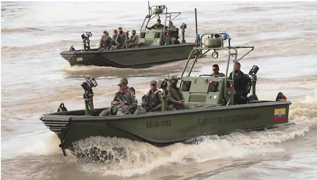
Ratas de río en sus botes especiales de patrullaje fluvial.