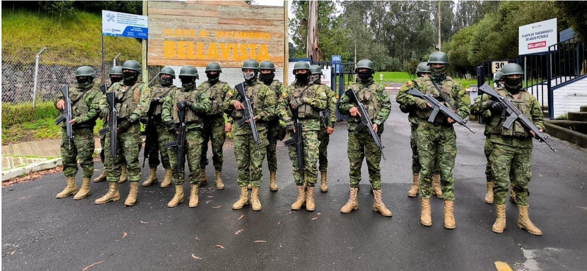
Soldados del Ejército Ecuatoriano