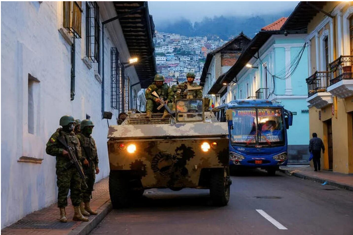
Unidades de caballería en patrullaje urbano. Las bandas criminales han afectado gravemente la seguridad del país, forzando el empleo de las Fuerzas Armadas en la seguridad interna.

Institución del más alto nivel de credibilidad; sistémicamente integrada, con capacidades conjuntas e interoperabilidad, personal profesional, ético y moralmente calificado, para enfrentar los cambios y nuevos escenarios, que garanticen la paz, seguridad y el bienestar de la nación.