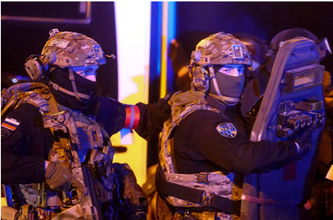
Fuerzas especiales rusas desplegadas tras el atentado en Crocus.

Occidente insiste en dar por cierta e imponer la teoría, a esta altura ya certeza, de que el ataque del pasado viernes veintidós contra el Centro Comercial de Crocus, fue obra de un comando del Daesh Willat Khorasan . La khatiba , terrorista que desde 2015, transportada desde Siria por la CIA, según la inteligencia iraní, al norte de Afganistán, para generar un foco de oposición al talibán , dentro del contexto fundamentalista. Desde entonces hasta a la actualidad, la Willat concentró sus acciones exclusivamente contra las formaciones del talibán , entonces en guerra con el invasor norteamericano, y a partir de agosto del 2021, lo sigue haciendo contra el gobierno de los mullah , instalado en Kabul después de su victoria.