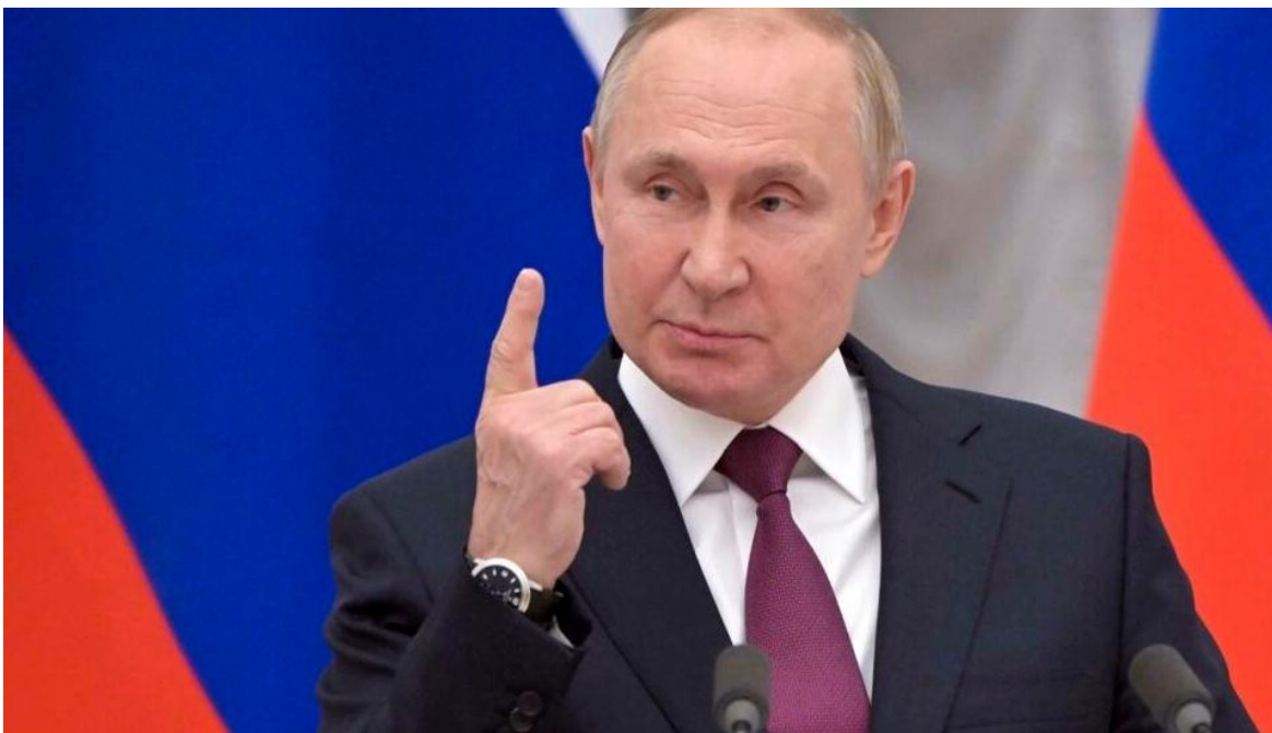
Vladimir Putin, el carismático líder de Rusia, recientemente reelecto por su pueblo.

Desde que el viernes veintidós, comenzó a rebotar en las agencias internacionales la información acerca del ataque al Centro Comercial de Crocus, (Ver: Rusia, el laberinto de Crocus.) y cuando ni siquiera se conocía bien, que estaba sucediendo, Ucrania emitió un comunicado, en el que negaba cualquier responsabilidad en el hecho. El que de inmediato tuvo el respaldo de los Estados Unidos.