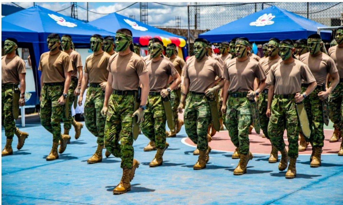
Fuerzas Especiales del Ejército del Ecuador en una demostración de habilidades.

Es la rama más importante de las fuerzas armadas del país tanto por ser la más numerosa y la de mayor capacidad y competencia operativa. A la cabeza del Ejército del Ecuador se encuentra el comandante general del Ejército, quien obedece a la autoridad del jefe del Comando Conjunto de las Fuerzas Armadas, al Ministerio de Defensa Nacional y al Comandante en Jefe de las Fuerzas Armadas, el Presidente Constitucional de la República.