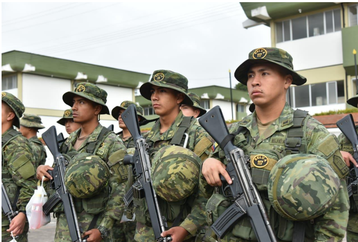
Personal de Infantería de Selva en formación.

En 1989, el Ejército contaba con alrededor de 40.000 soldados, casi cuatro veces la fuerza combinada de la Armada y la Fuerza Aérea. En 2003, se reestructuró en cuatro Divisiones del Ejército independientes que operaban alrededor de 25 Batallones de Infantería. Estos batallones se implementaron en Brigadas que no estaban numeradas consecutivamente, pero llevaban números impares en las series 1 a 27. Todas las Brigadas tenían también Fuerzas Especiales e ingenieros, y al menos una Compañía de Apoyo Logístico y de Comunicaciones. A partir de 2008, junto con la Fuerza Aérea y la Armada, el Ejército experimentó una reforma para maximizar su capacidad conjunta. Este proceso implicó la creación de comandos operativos similares a los de EE.UU. Hay 4 comandos conjuntos operativos que se distribuyen geográficamente.