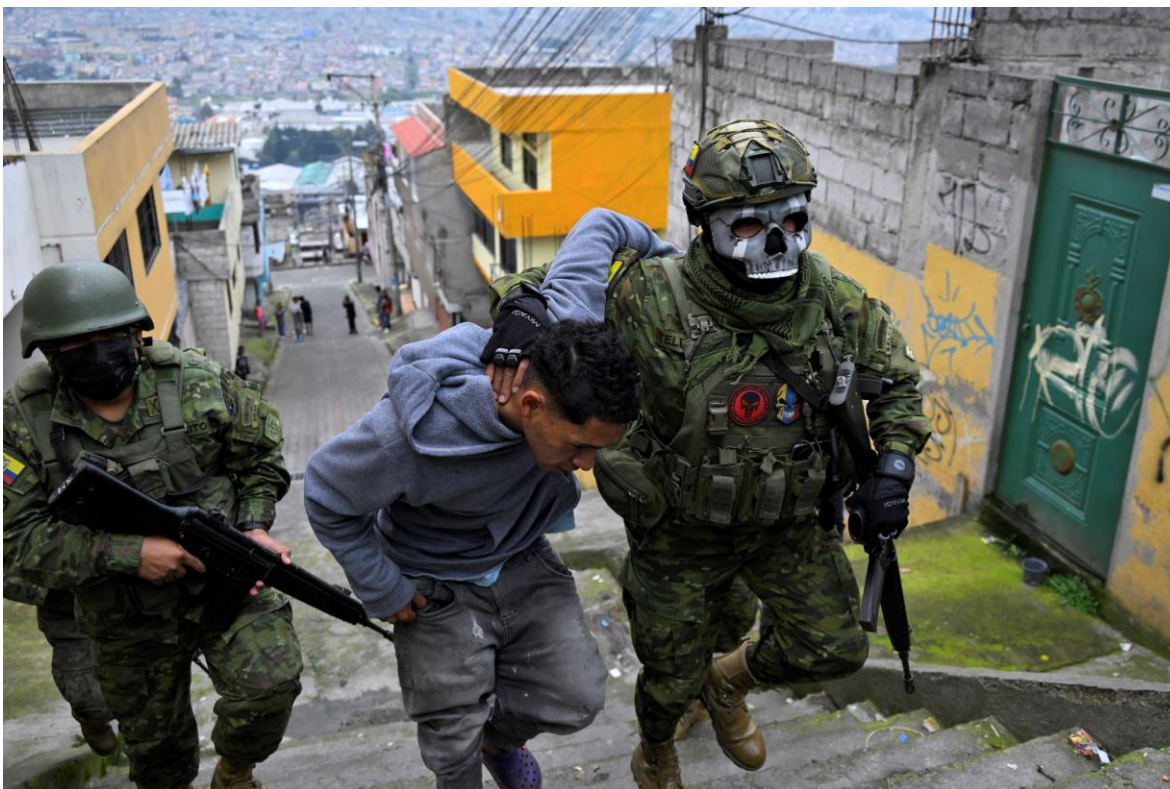
Ejército Ecuatoriano en operaciones de seguridad urbana.

El Orden de Batalla aproximado de las Fuerzas Terrestres del Ecuador es como sigue: