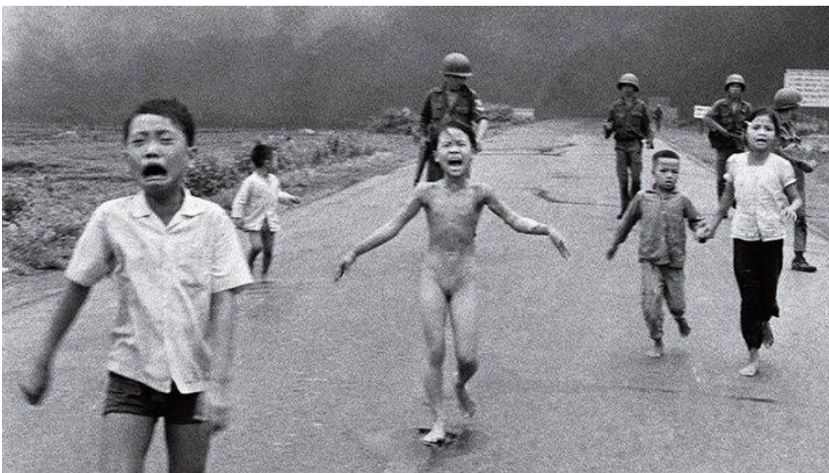
Imagen icónica de la guerra de Vietnam, la llaman "la niña de la foto". Se trata de víctimas de un bombardeo con napalm sobre la aldea Trang Bang el 8 de junio de 1972. La opinión pública estadounidense se conmovió y se indignó al saber que sus soldados estaban haciendo esas cosas en el sudeste asiático.

Entre 1955 y 1975 Estados Unidos libró un conflicto bélico contra Vietnam del Norte, con la intención de que el comunismo no se tomará el sur. Esta acción dio el resultado de más de tres millones de muertos entre los vietnamitas, mientras que, para los Estados Unidos la cifra fue mucho menor. Poco más de cincuenta y ocho mil bajas (58.159).