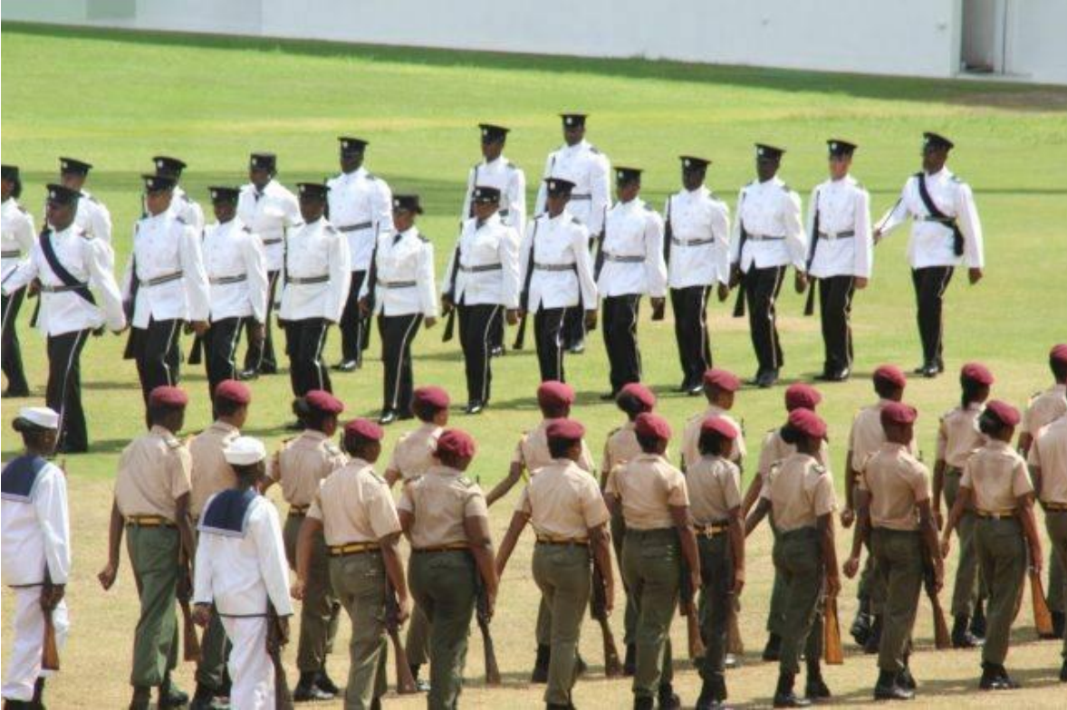
Personal de distintas unidades, en ceremonia especial conjunta. A la izquierda miembros del guardacostas.

En la década de 1960, la policía era la única fuerza de seguridad del país. Como consecuencia, en 1974 se creó una Fuerza de Defensa Voluntaria. En noviembre de 1975, una ley de la Asamblea estableció una Fuerza de Defensa a tiempo completo para sustituir a la Fuerza de Defensa Voluntaria, dirigida por Patrick John como Ministro de Seguridad. En marzo de 1981, Charles anunció el descubrimiento de un intento de golpe de Estado conocido como Operación Perro Rojo , en el que estaba implicado el comandante Frederick Newton, jefe de las Fuerzas de Defensa. Un mes después, el parlamento disolvió la Fuerza de Defensa.