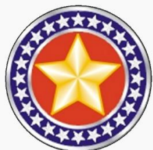
Escudo de armas nacional de la Policía Militar

En Brasil las policías militares estatales son las 27 fuerzas de seguridad pública que tiene por función la policía ostensiva y la preservación del orden público, a través de la actividad de policía ostensiva, función extendida por la Constitución Federal de 1988, superando lo anterior con policía preventivo en el ámbito de los estados y de Distrito Federal. Son administrativamente subordinados a los gobernadores y son fuerzas auxiliares y reserva del Ejército Brasileño, integran el sistema de seguridad pública y defensa social de Brasil, quedando subordinados a las Secretarías de Estado de Seguridad Pública en el nivel operacional. Son costeadas por estados miembros y en el caso de Distrito Federal, por la Unión.