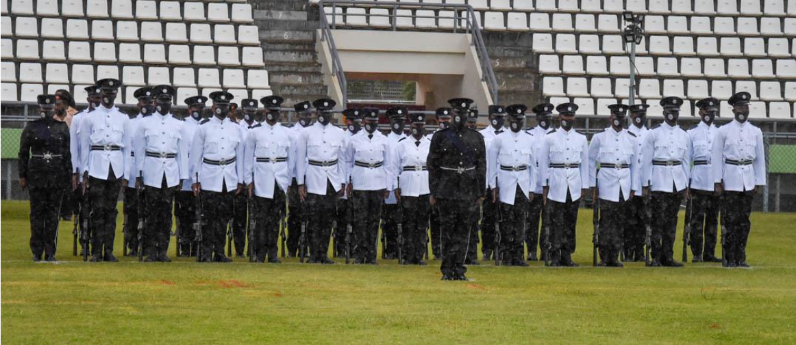
Policías de Dominica en ceremonia especial.