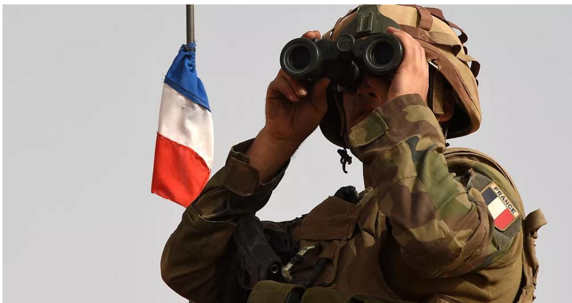
Francia vigila atentamente la situación general en la región, y, en particular en Chad.

La agencia electoral del Chad anunció que se realizarán, por fin, las tantas veces postergadas elecciones presidenciales, que tendrán dos vueltas: la primera el seis de mayo, y la segunda el veintidós de junio. Esperándose los resultados “provisionales”, recién para el siete de julio. Lo que encaminaría al país a un orden democrático que nunca tuvo, desde que Francia, a principio de los años sesenta, comenzó a deshacerse de sus colonias, tras la trágica experiencia argelina.