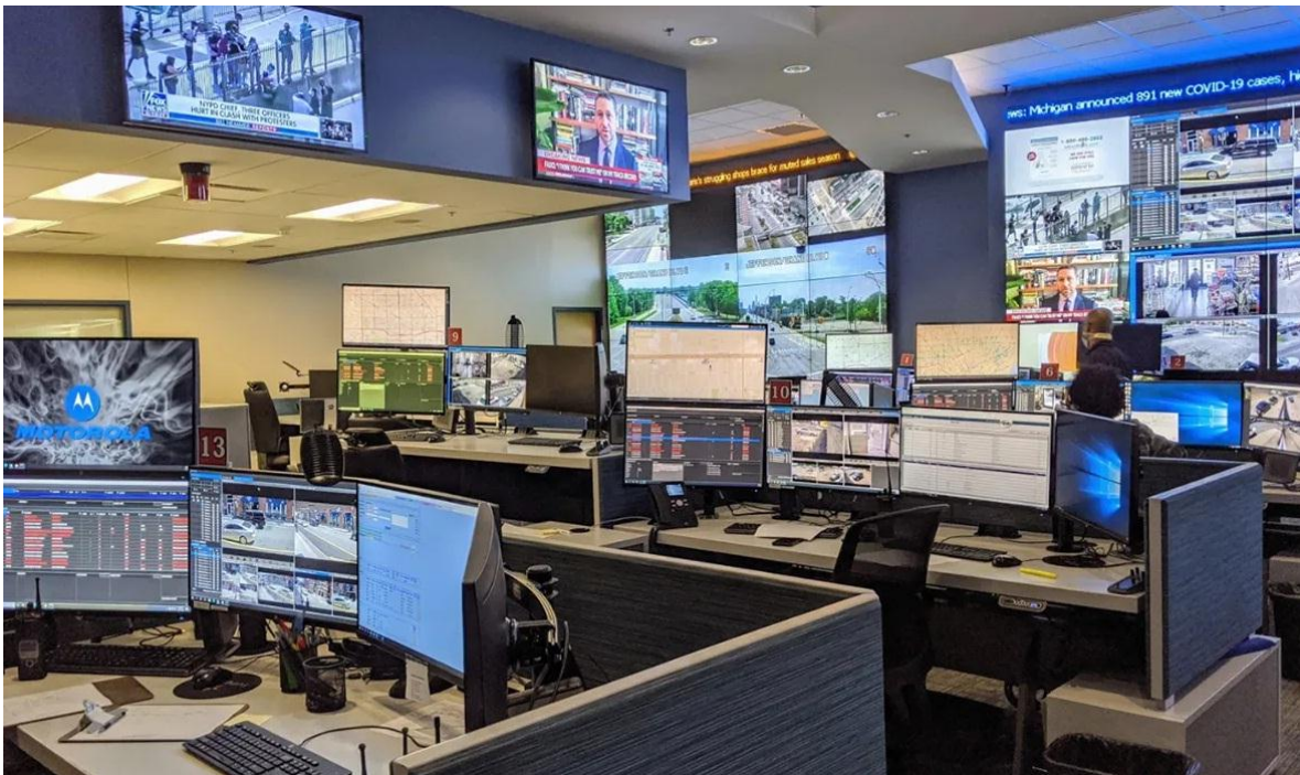
Parte del Real Time Crime Centre (RTCC) de la Policía de Detroit (donde trabajó Robocop).

El propósito principal del análisis del crimen es apoyar (es decir, ayudar) las operaciones de un Cuerpo Policial (sea Provincial o Nacional) en los esfuerzos operativos y de reducción del crimen en curso. Estas funciones incluyen: la investigación; aprehensión; enjuiciamiento criminal; actividades de patrullaje; estrategias de prevención y reducción del delito; resolución de problemas; y la evaluación y rendición de cuentas de los esfuerzos policiales. A través del acceso a datos criminales y no criminales y al software que los acompaña, se realiza un análisis de delitos para abordar situaciones de corto plazo (por ejemplo, de varios días a varias semanas de duración) y problemas que ocurren durante un período de tiempo más largo (por ejemplo, de varios meses a varios años).