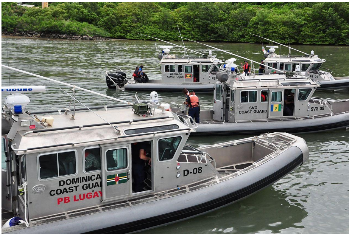
Botes de patrulla del Sistema de Seguridad Regional (RSS), en primer plano una unidad de Dominica.

La emancipación de los esclavos africanos provocó la interrupción de relaciones con el Imperio británico en 1834 y en 1838 se convierte en la primera y única colonia británica del Caribe en tener una legislatura dominada por negros. En 1896, los británicos retoman el control de la isla y es convertida en Colonia de la Corona. Medio siglo después se convierte en provincia de la Federación de las Indias Occidentales de 1958 a 1962.