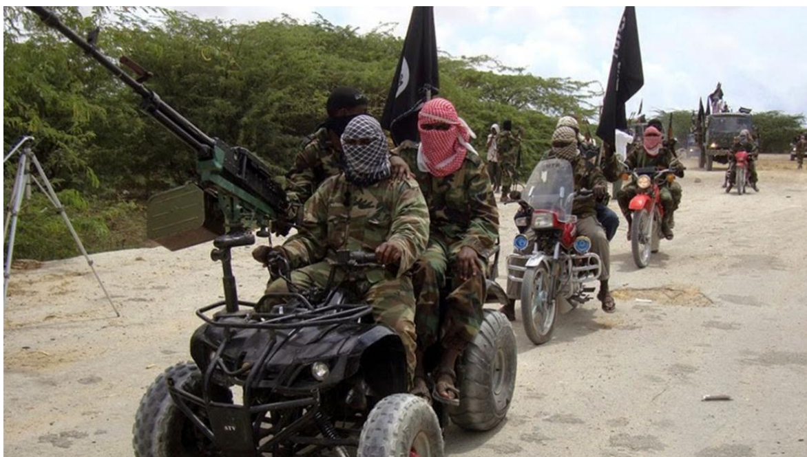
Comando motorizado de terroristas en Nigeria.

Una vez más, la crisis de seguridad que Nigeria vive desde 2009, por la que ya murieron unas cincuenta mil personas y generó, cerca de tres millones de desplazados, vuelve a golpear, en esta oportunidad a niños y jóvenes estudiantes. Con diferencia de días, cerca de trescientos fueron secuestrados de sus propias escuelas, reiterando una práctica que se ha vuelto frecuente.