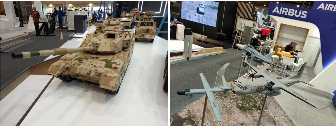
A la izquierda, maquetas de múltiples sistemas de armas de origen chino en el stand de Norinco, ellos tienen de todo lo que aquí pudiésemos necesitar. A la derecha, las aeronaves que Airbus ofrece a Colombia, incluyendo al UAV (ART en Colombia) Sirtap, del que además de adquirir algunas unidades, aspiramos a coproducir. Expodefensa 2023, Bogotá.

voluntarios de la Defensa Civil Colombiana. En la feria, los funcionarios de empresas nacionales y extranjeras, así como delegaciones oficiales, personal diplomático de otros países, y visitantes profesionales, pueden conocer de primera mano lo que los colombianos somos capaces de hacer en distintos campos de acción del sector de la seguridad y la defensa.