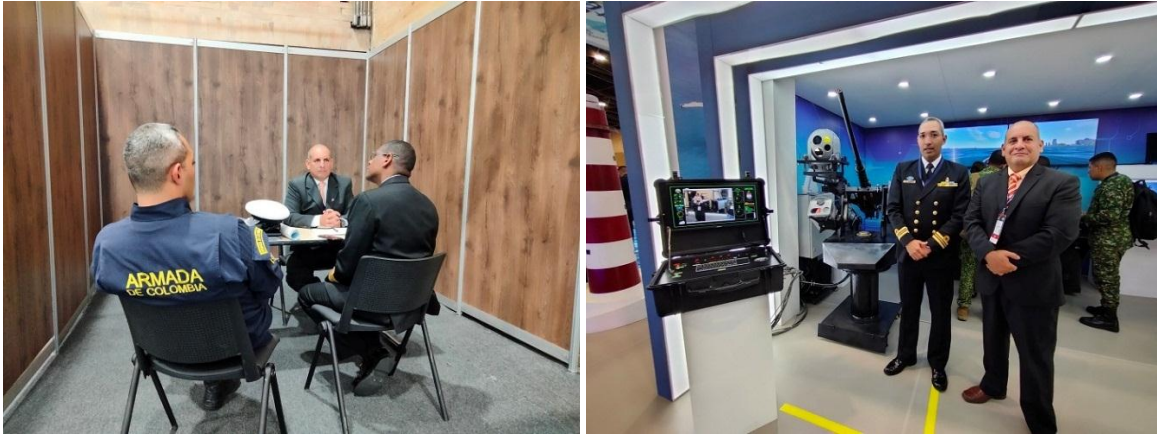
Izquierda, el autor recibiendo a dos distinguidos oficiales navales en el stand de www.fuerzasmilitares.org , a la derecha, el autor visitando uno de los stands de la Armada Nacional de Colombia, con una muestra magnífica de desarrollos tecnológicos nacionales. Expodefensa 2023, Bogotá.

de planes rigurosos y prospectivos del gobierno colombiano. ¿Quién es realmente responsable por la Expodefensa, el ministro, la viceministra del GSED, el presidente de Codaltec, el gerente de Corferias, todos o ninguno?, en tantos años, yo aun no lo tengo claro. ¿A quién se debe felicitar por el éxito del evento, o a quién se debe culpar por su fracaso, a quién se pueden enviar las sugerencias que uno pudiese tener? Todo es muy difuso, "líquido" como diría Bauman. De manera similar, sería de mucho interés conocer quién se queda con el dinero que se recauda por boletería y alquiler de espacios en la Feria Aeronáutica Internacional de Rionegro, la popular F-Air. De la que albergó un trauma que no he podido superar: nunca ponen suficientes baños, para la cantidad de gente que asiste. ¿Habrá que ser un genio de la logística para darse cuenta de esa falencia?