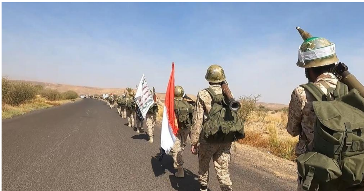
Tropas Hutíes en Yemen.

Cada vez más lejos de apaciguarse el conflicto en Gaza, abierto tras la incursión armada de Hamas , el pasado siete de octubre, la que, torpemente, dio excusas para la desbordada respuesta sionista .