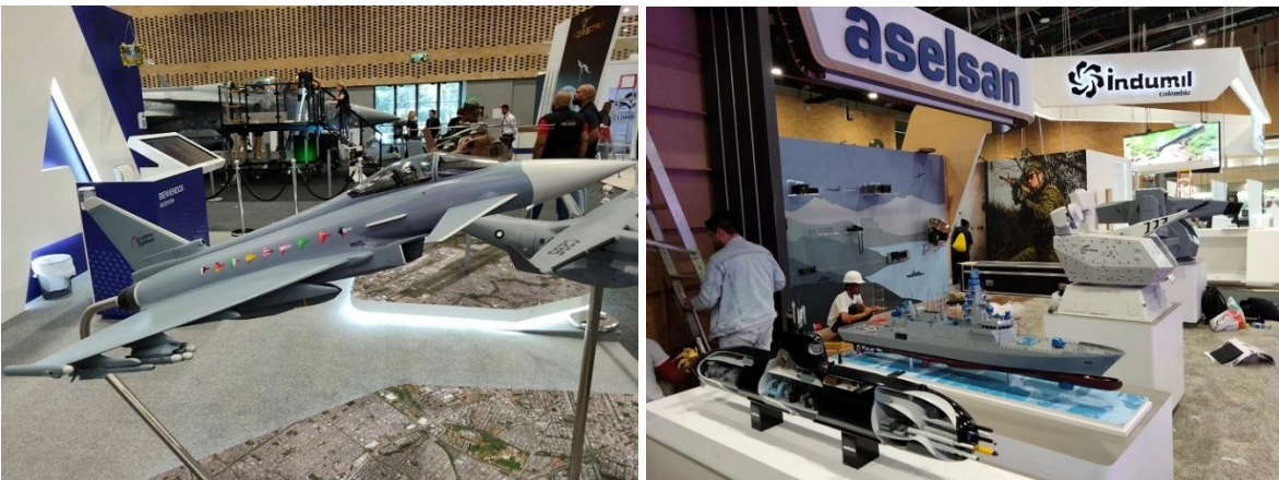
A la izquierda, dos de los aviones que compiten por reemplazar a los Kfir de la Fuerza Aeroespacial Colombiana, en primer plano maqueta del Eurofighter Typhon, al fondo maqueta a escala real del Saab Gripen; a la derecha, stands de la empresa turca Aselsan, junto al stand de la Industria Militar Colombiana, Indumil. Expodefensa 2023, Bogotá.

Lógicamente, las empresas que participan en la feria, tanto las colombianas como las extranjeras, aspiran a vender sus productos a las Fuerzas Militares o a la Policía Nacional de Colombia. Durante tres días, se concentran en Bogotá cientos de empresas que vienen a mostrar lo mejor de su portafolio, lo cual es una oportunidad magnífica para que nuestros oficiales y suboficiales, así como el personal civil de las industrias del sector defensa, conozca de primera mano el estado del arte de los distintos tipos de armas y sistemas. Uno pensaría que existe un plan para aprovechar al máximo esta oportunidad, pero no es así. Todo es realmente confuso e ineficiente.