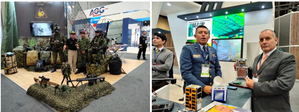
A la izquierda el stand del Comando Conjunto de Operaciones Especiales (CCOES), y a la derecha, el stand de la Fuerza Aeroespacial Colombiana (FAC), con una exposición de sus proyectos espaciales. Expodefensa 2023, Bogotá.

De Molano para acá, el Ministerio se volvió una mamadera de gallo. Comunicaciones estratégicas no se ha recuperado de la salida de aquellos excelentes profesionales a los que tanto extrañamos. Nada volvió a ser igual, ni siquiera Expodefensa.