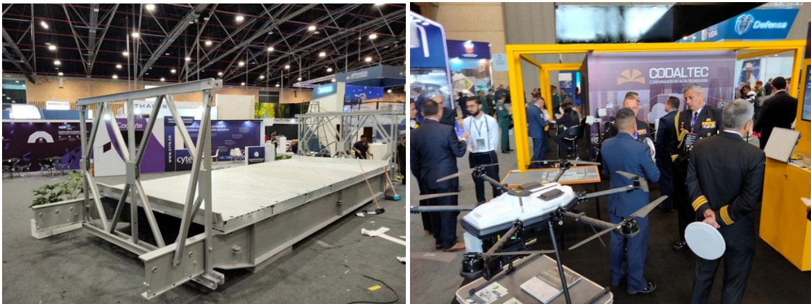
A la izquierda, una sección de puente tipo Bailey, equipo que va a ser fabricado por Indumil para las unidades de Ingenieros Militares del Ejército Nacional, que trabajan en la prevención y atención de desastres. Muchos puentes de este tipo han sido instalados en Colombia, cuando los puentes tradicionales son dañados por olas invernales. A la derecha, stand de la Corporación de Alta Tecnología, CODALTEC, coorganizador de Expodefensa. Expodefensa 2023, Bogotá.