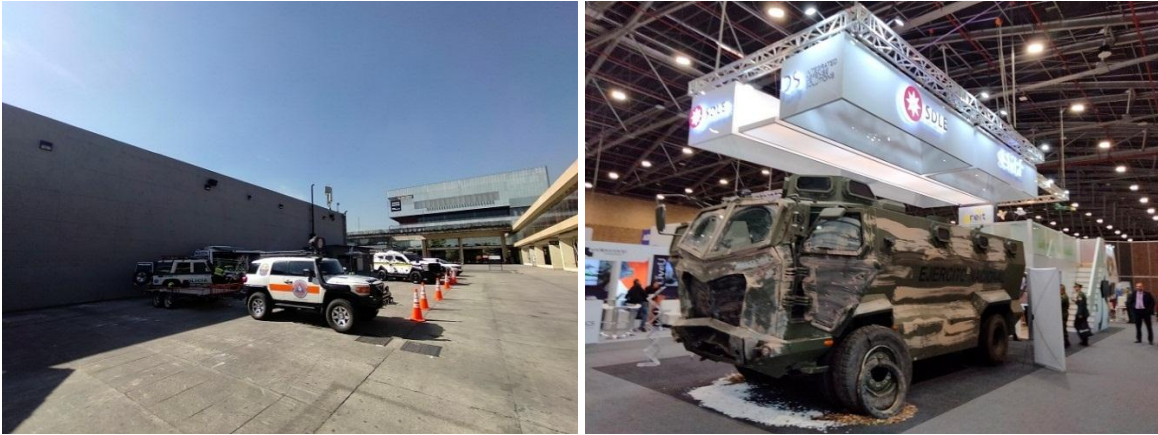
A la izquierda, el patio del pabellón donde se realizó Expodefensa 2023, puede observarse que, a diferencia de ediciones anteriores, hubo muy pocos vehículos, y los que estaban eran de la Defensa Civil o las Fuerzas Armadas Colombianas, ningún vehículo o blindado de la empresa privada. A la derecha, un blindado Titán del Ejército Nacional. Coproducido por el Ejército y la empresa privada. El que se expuso sufrió un atentado explosivo y superó el suceso, salvando a todo el personal en su interior. Expodefensa 2023, Bogotá.