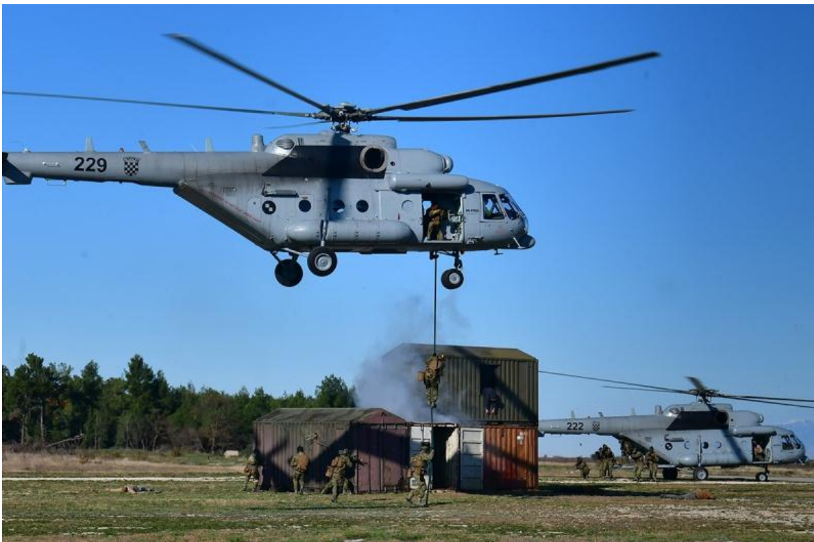
El centro de formación MSAP ayudará en el desarrollo de unidades de tareas aéreas de operaciones especiales en Bulgaria, Croacia, Hungría y Eslovenia.

que apoyó a CROSOFCOM con sus helicópteros Mil Mi-171Sh hasta la llegada de los nuevos helicópteros UH-60M Blackhawk en 2022.