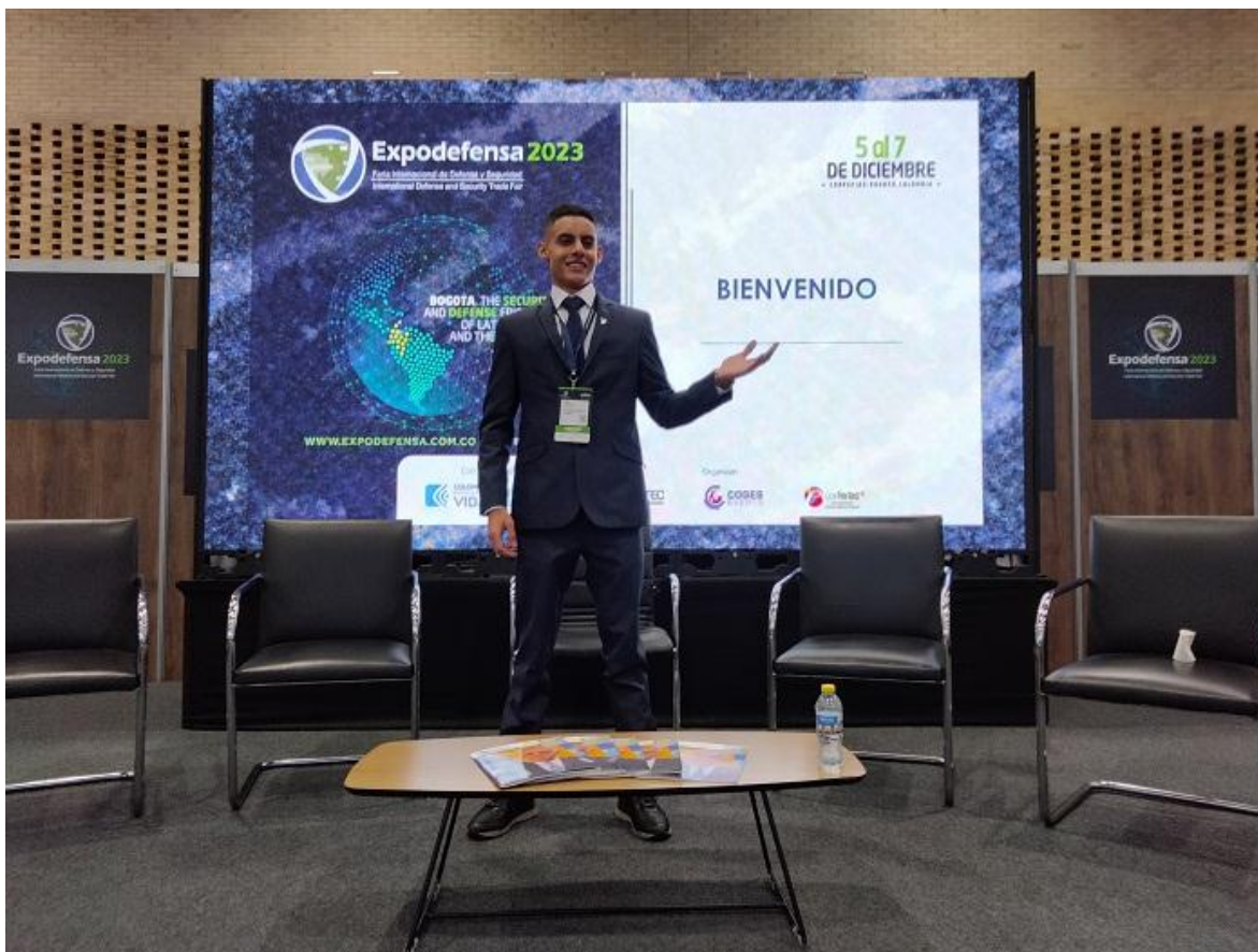
Representante de www.fuerzasmilitares.org y TRIARIUS en Expodefensa 2023.

Siendo www.fuerzasmilitares.org el medio de comunicación colombiano especializado en seguridad y defensa más antiguo del país, y el que goza de mayor reconocimiento, hemos tenido la oportunidad de participar en todas las ediciones de Expodefensa, y, por supuesto, la del 2023 no sería la excepción.