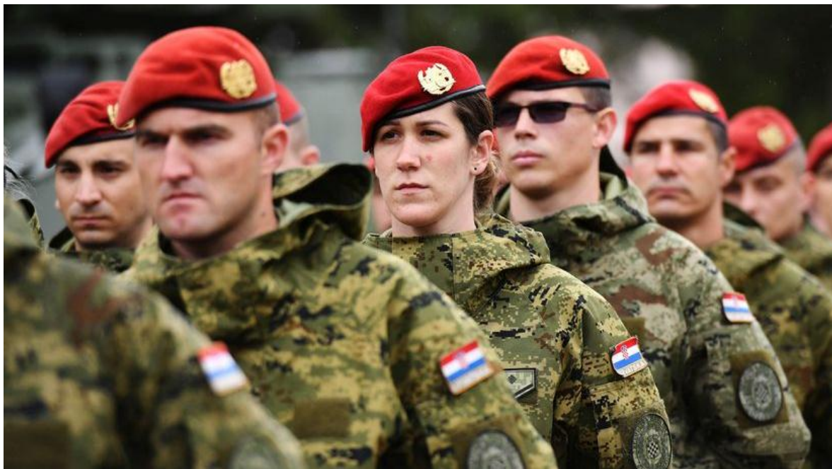
Soldados del Ejército Croata