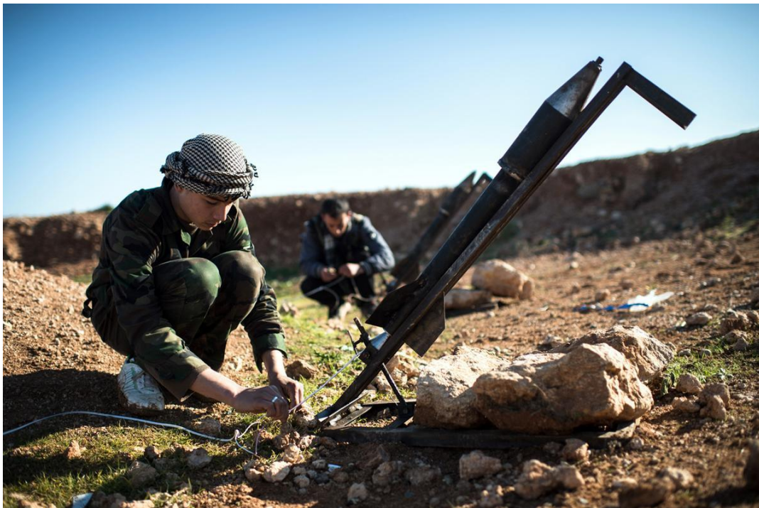
Varios sistemas de armas improvisadas en Siria