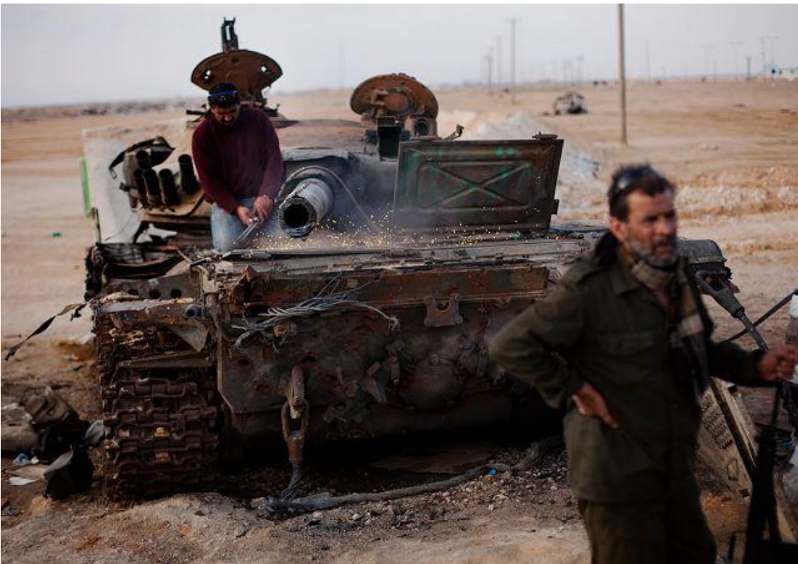
Despiece de un carro de combate destruido para el aprovechamiento de piezas en Siria