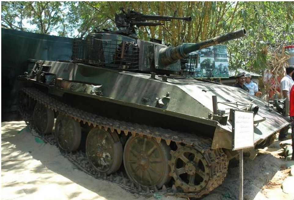
LTTE light tank.TAMIL

El PG-9 demostró ser capaz de alcanzar un objetivo de 2 metros de altura a un rango de 765 metros, mientras que su rango máximo de fuego directo es de 1.300 metros, reducido a 400 metros por la noche, debido a las limitaciones del sistema de visión nocturna. En condiciones de campo de batalla, tiene un alcance efectivo máximo de 500 metros.