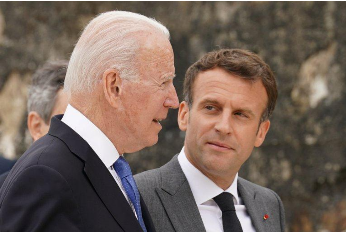
Joe Biden y Emmanuel Macron

Estos últimos días occidente se ha encargado de demostrar que la crisis de Ucrania hasta ahora sólo está beneficiando a Moscú y no deja de producir efectos no deseados por los agentes del Departamento de Estado .