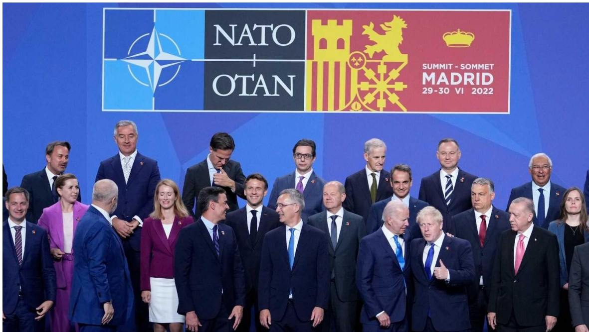
Líderes de la OTAN en la cumbre de Madrid, realizada recientemente.

Las conclusiones tras la cumbre de la Organización del Tratado del Atlántico Norte (OTAN) que acaba de concluir el pasado día treinta de junio en Madrid, entiéndase como las nuevas órdenes impartidas por Washington a sus socios europeos englobadas en “el Nuevo Concepto Estratégico”, se centran, principalmente, en mayores aportes para continuar la guerra contra Rusia en Ucrania, para lo que Biden anunció un nuevo aporte de ochocientos millones de dólares. Además de reafirmar que: “Vamos a apoyar a Ucrania durante el tiempo que sea necesario”, aunque no especificó en qué consistían esos apoyos.