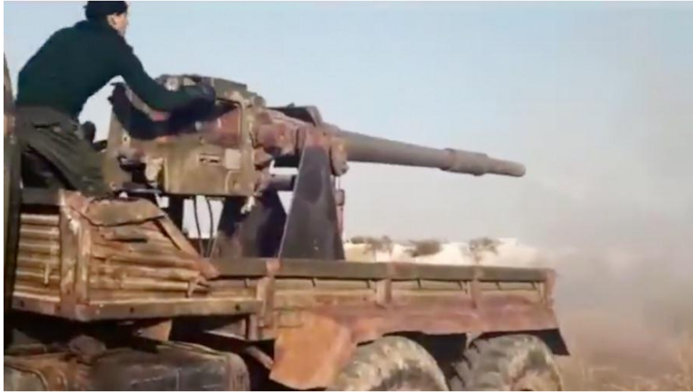
Cañón autopropulsado construido por los rebeldes sirios con base en el cañón de un T-62 ruso, con el tiempo se le habilitó un sistema para evitar que el chasis del cajón absorbiera el retroceso