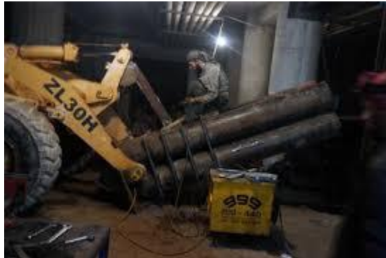
Habilitación de un Bulldozer como lanzador múltiple de mortero casero en Siria

¿Nos hemos preguntado qué ocurriría si todas estas personas se hartaran?, ¿Qué ocurriría si un día decidieran cruzar “la delgada línea roja”? Aunque fueran tan solo unos pocos de muchos. Son auténticos ejércitos, ¿Estamos preparados para entablar combate en zonas urbanas que no conocemos ni de lejos?