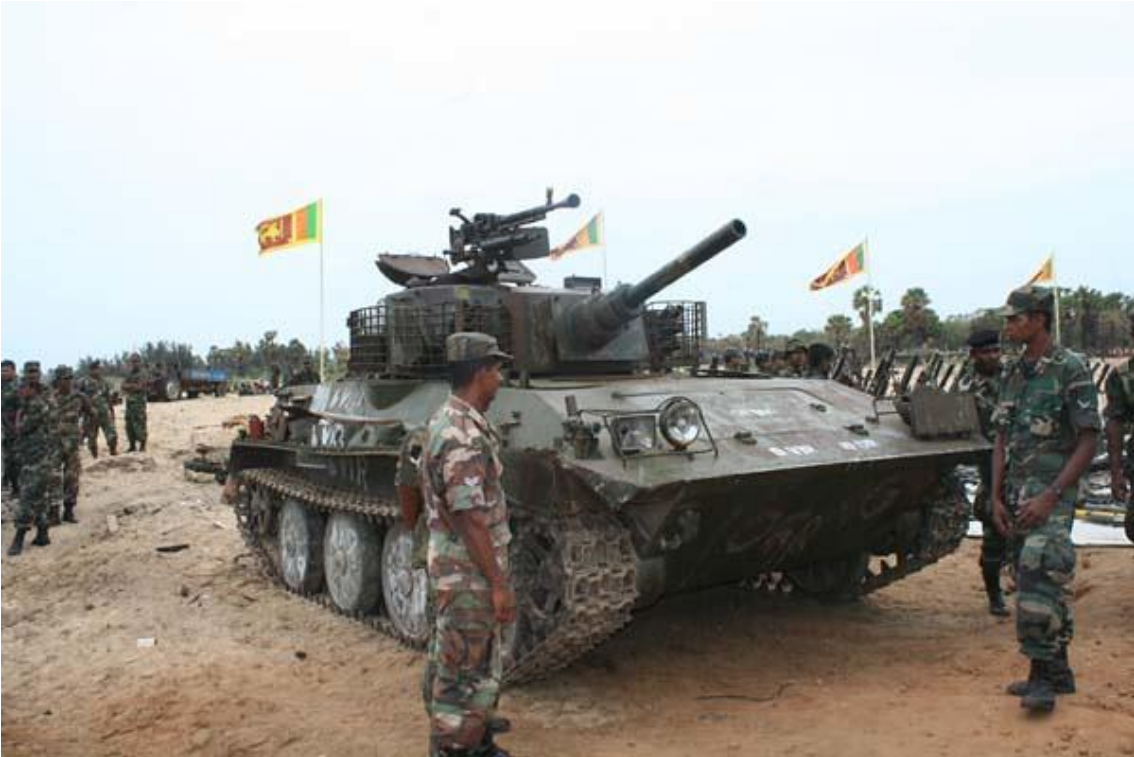
Carro de combate "casero" construido a partir de una torre de un FV601 Saladin por los tamiles