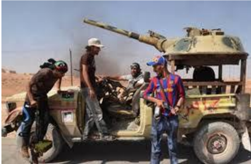
Cañón de ánima lisa 2A28 "Grom" de 73 mm perteneciente a un BMP-1 ruso habilitado en un vehículo en Libia

El vehículo referido en la fotografía, fue observado también en Siria, pero en este caso dispuesto en un remolque. Pudiendo utilizar munición antitanque de alto explosivo (HEAT; proyectil PG-15V HEAT fijo asistido por cohete estabilizado con aletas). Después de 1974, se introdujeron los proyectiles de fragmentación HE OG-15V. La ojiva HEAT puede penetrar 280-350 milímetros de blindaje de acero, más que suficiente para penetrar el blindaje frontal de los principales tanques, como el M60A1 de EE.UU., el Chieftain británico o el Leopard alemán 1. El proyectil PG-9 modernizado es capaz de penetrar hasta 400 milímetros de blindaje de acero.