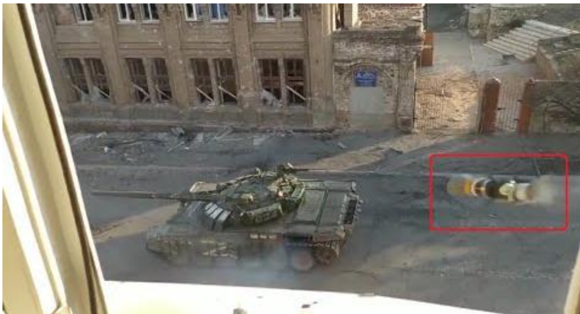
Emboscada a un carro de combate ruso en la invasión de Ucrania

Terminaba mi artículo anterior con esta pregunta, ¿Cuándo terminarán dándose cuenta de que el teatro de operaciones ha cambiado y eso conlleva de forma ineludible un replanteamiento absoluto del arma acorazada en todos los términos?