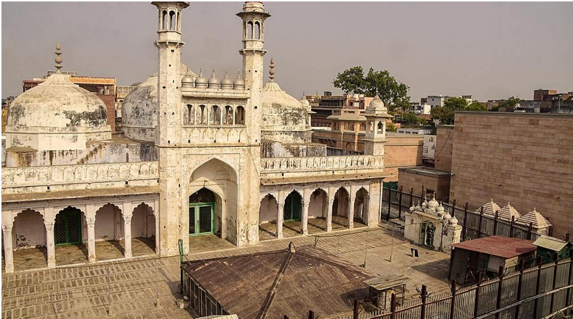
Mezquita Gyanvapi Masjid-Shringar Gauri

El activismo anti musulmán del Primer Ministro indio Narendra Modi, y el de su partido el Bharatiya Janata Party o BJP (Partido Popular Indio) parece haber dispuesto que los trescientos millones de dioses, que se dice tiene el hinduismo, se han puesto en marcha contra Allah.