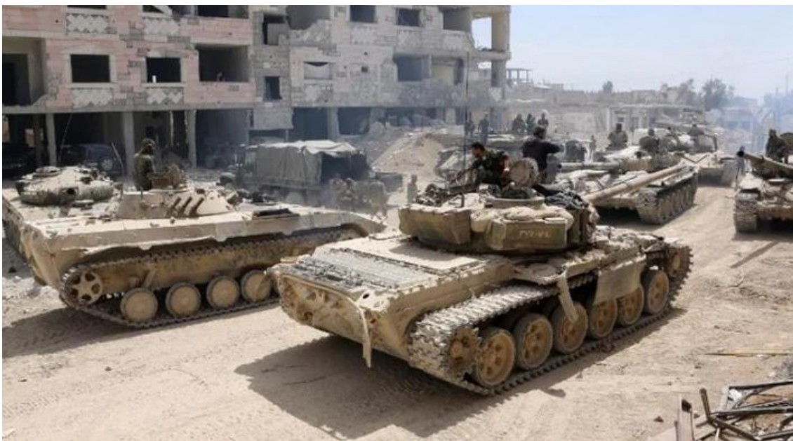
Carros de combate sirios T-72 y transportes blindados en un suburbio

Los rusos lo vivieron en Chechenia en 1996, donde estos hablaron de unos 6.000 muertos entre sus filas, aunque otras fuentes los aproximan a los 15.000, y un amplio etcétera de casos. Pero, ¿qué importa verdad? Mientras no te toque a ti directamente, no es más que una tumba más en un gran camposanto.