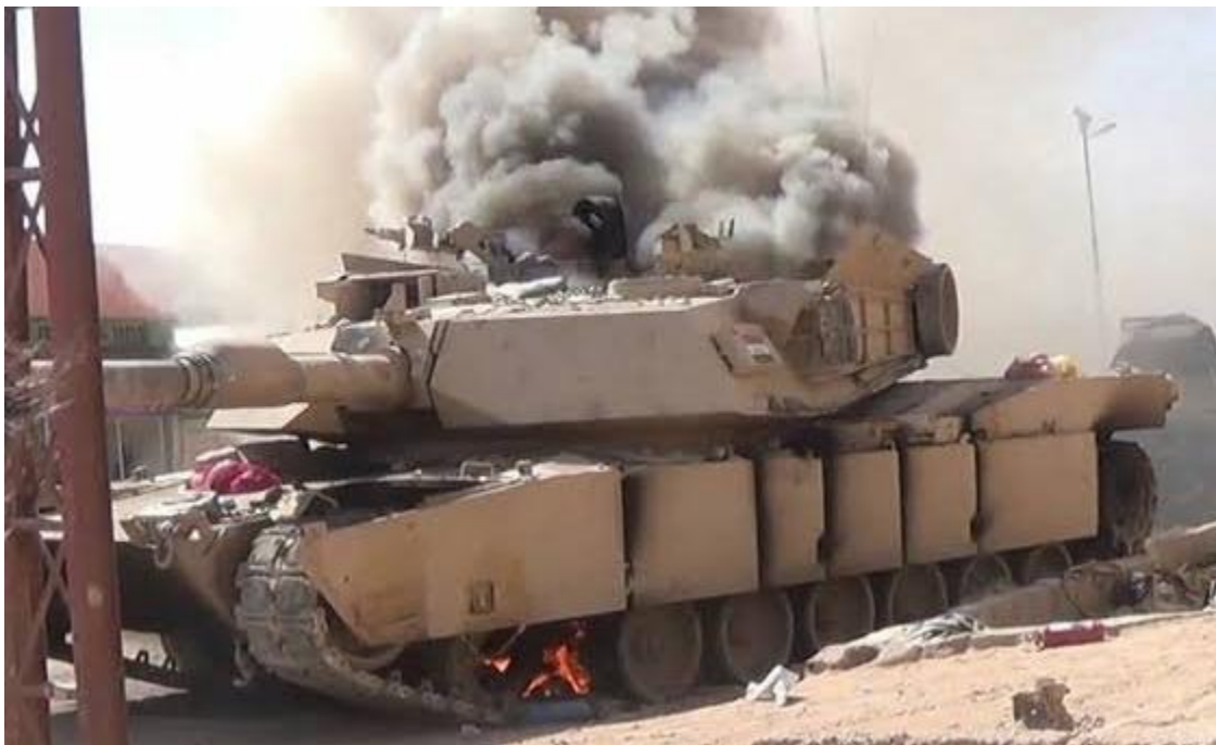
Abrahams M-1 destruido en Irak