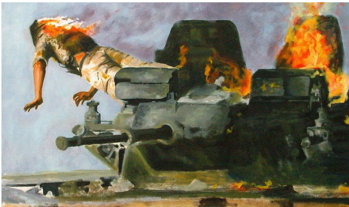
Muerte terrible de la tripulación de carros de combate y blindados

No puedo dejar de pensar en que profesionales castrenses de países amigos puedan verse en situaciones similares a las que vi en Siria y con las que nos obsequia la red habitualmente.