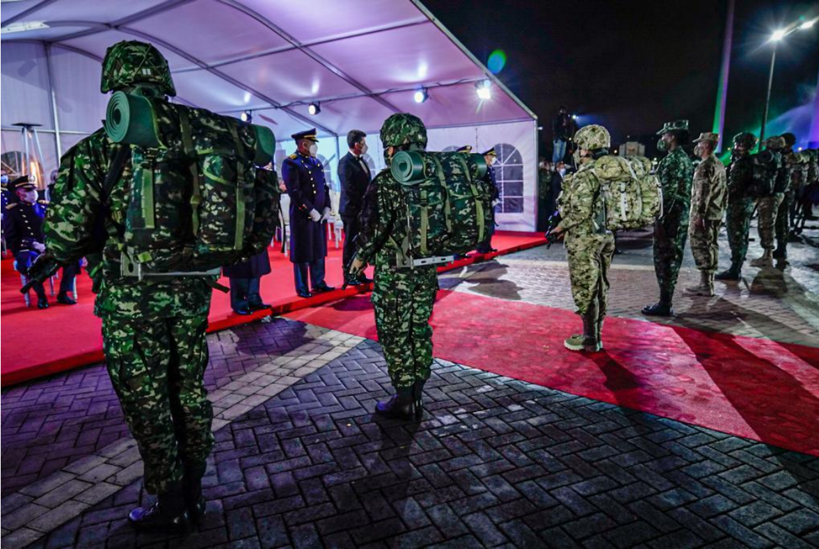
Presentación oficial de los prototipos del proyecto Camaleón Bicentenario.

que usan las tropas y que también deben estar mimetizados, deben ser fabricados desde cero, para que no haya una mezcla de patrones. Me refiero a los equipos (morrales) de campaña, los chalecos de asalto, el forro de los cascos, las cobijas térmicas, las sintelitas, entre otros elementos.