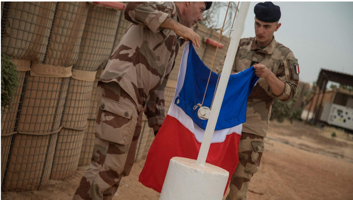
La retirada francesa de Mali, es tan vergonzosa como sospechosa.

Francia a lo largo de los diez años en los que se instaló en el norte de Mali, supuestamente para combatir las bandas wahabitas que habían comenzado a llegar en la región tras la caída del Coronel Muhammad Gaddafi, la inestabilidad en el país por el golpe contra el presidente Amadou Touré, y la rebelión tuareg, que una vez más intentaba recuperar la región de Azawad, su ancestral territorio, ha demostrado solo una cosa: Qué si su verdadero fin era controlar el terrorismo integrista, fracasó en toda la línea.