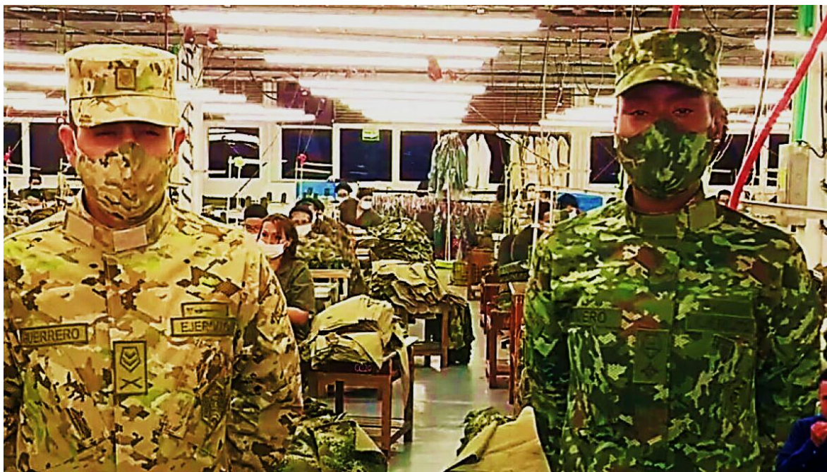
Dos de los prototipos del Proyecto Camaleón Bicentenario. A la izquierda desértico, a la derecha selvático.

El cambio de uniformes de la Policía Nacional desató una oleada de críticas, al considerársele un gasto innecesario, sobre todo porque se produjo en medio de la pandemia, y porque en esos momentos el Gobierno Nacional anunciaba que no había dinero para asuntos de orden social, vitales para la población.