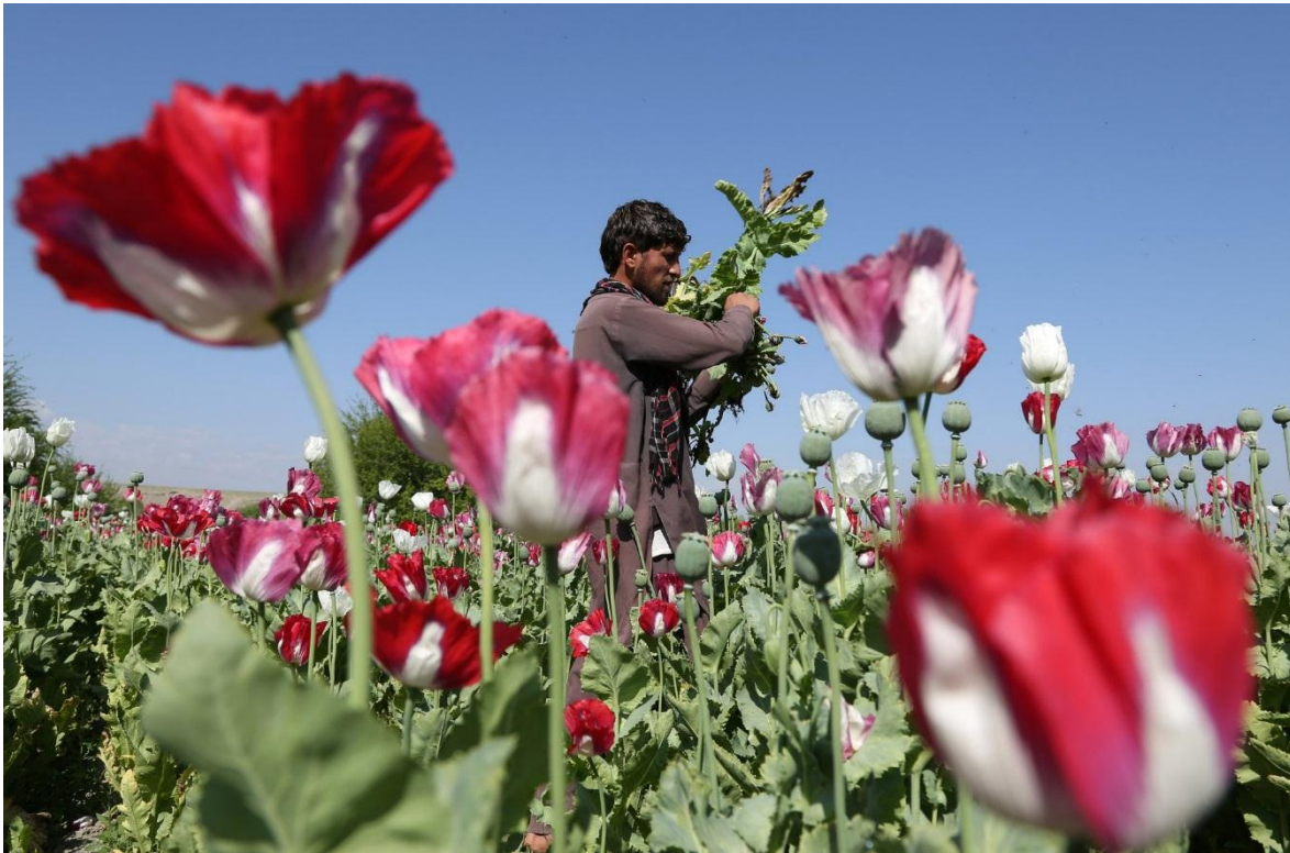
El opio es fuente de ingresos para muchos de los señores de la guerra de Afganistán.

Con la llegada de la primavera en Afganistán, casi una docena de grupos desarticulados, de cuño occidental se han comenzado a estructurar para combatir al gobierno del Talibán, tras su victoria de agosto de 2021 (Ver: La tórrida primavera afgana). Si bien su accionar, ha sido modesto, limitándose solo a muy esporádicas emboscadas de poca efectividad y muchas declaraciones y amenazas, su peligrosidad podría encontrarse en un futuro, según las necesidades de los Estados Unidos en obstaculizar los avances de China y Rusia en las conversaciones y posibles acuerdos económicos con el gobierno de los Mullahs, cuyas bases parecen no tener ninguna voluntad de acercamientos a Washington, ya que la gran mayoría de los actuales muyahidines se formaron bajo el fuego de los