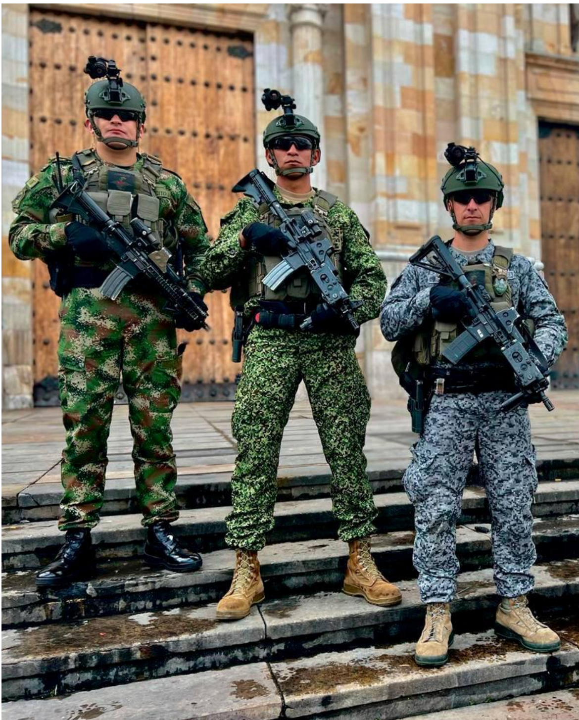
Hombres de FF.EE. De izquierda a derecha, del Ejército, de la Infantería de marina y de la Fuerza Aérea.

La uniformología es una de las disciplinas auxiliares de la historia, que estudia los uniformes, en particular los uniformes militares, a través del tiempo y las civilizaciones. En el caso colombiano hay mucha tela para