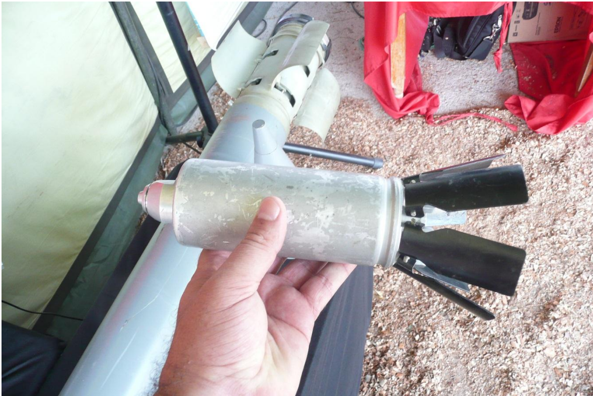
Submunición que se incorpora a los cohetes del sistema Smerch de origen ruso.

mejorar la movilidad en terrenos difíciles, como la arena, el barro y la nieve.