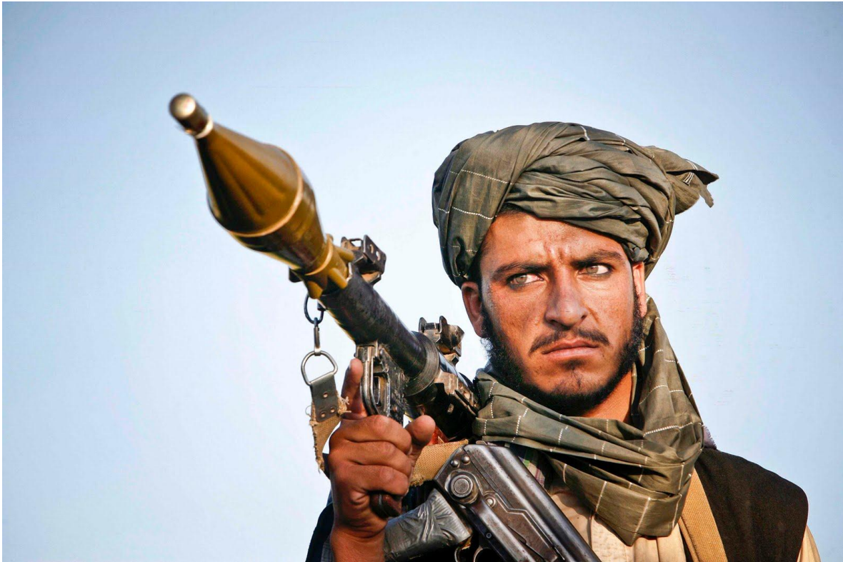
Guerrero talibán, armado con un fusil Ak y un lanzagranadas RPG, ambos de origen ruso.

Los veinte años de la ocupación norteamericana de Afganistán, solo han servido para confirmar la leyenda de que los guerreros afganos son invencibles a la hora de defender su escabroso territorio. Lo que pueden atestiguar desde el imperio británico, la Unión Soviética y los Estados Unidos. Por mencionar los últimos que se han atrevido a semejante osadía.