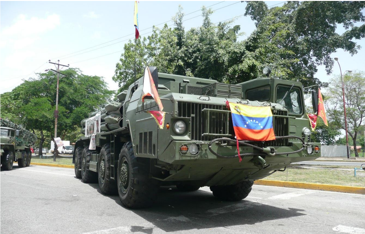
Vehículo lanzador del sistema Smerch en servicio en el Ejército Bolivariano de Venezuela.

La compra se llevó a cabo en septiembre del año 2009, y los equipos llegaron a Venezuela en enero del 2013. Siendo presentados al público el 24 de junio de ese año, en el desfile conmemorativo de la Batalla de Carabobo y día del Ejército Bolivariano de Venezuela, donde participó una batería del flamante MLRS.