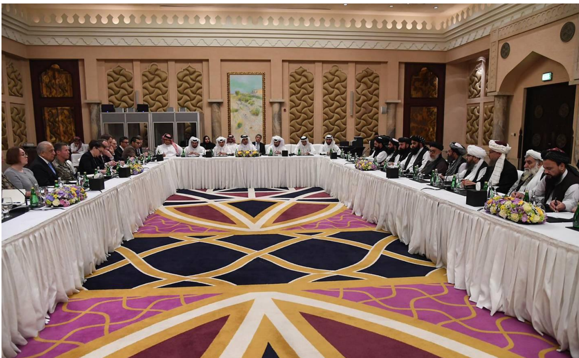
Representantes de Estados Unidos y de los talibanes afganos reunidos el 26 de febrero del 2019 en Doha en una ronda de las negociaciones de paz. Hoy la situación es distinta y los talibanes tienen "la sartén por el mango".

Los talibanes, tras la retirada norteamericana, han decidido desbloquear la mesa de negociaciones de Doha (Qatar), que, si bien nunca se interrumpieron formalmente, si se mantuvieron estancadas durante meses. Sin duda el reinicio de las negociaciones está vinculada a la exitosa ofensiva militar iniciada el pasado primero de mayo, que les ha permitido demostrar su superioridad militar, con la que han puesto al gobierno del presidente afgano Ashraf Ghani, al borde del colapso y obligado al Ejército Nacional Afgano (ENA) a abandonar innumerables posiciones, previa la entrega armamento y vehículos, lo que permitió a los integristas sitiar la mayoría de las capitales provinciales, más allá de que han anunciado que no pretenden tener combates en el