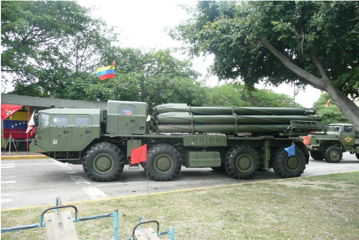
Vehículo lanzador del sistema Smerch en servicio en el Ejército Bolivariano de Venezuela.

En 1976, el gobierno soviético emitió un requerimiento para el desarrollo de un nuevo sistema de artillería, del tipo lanzacohetes múltiple (MLRS), que sería muy superior a todo lo existente en ese momento. El nuevo sistema, denominado Smerch (Tornado), completó sus pruebas en 1982, con éxito, siendo adoptado por el ejército soviético en 1987. Valga decir, que para el momento de su entrada en servicio, era el sistema de artillería de lanzacohetes múltiple más poderoso del mundo. Hoy en día, más de 30 años después de su debut, sigue siendo uno de los MLRS más potentes y mortíferos del mundo.