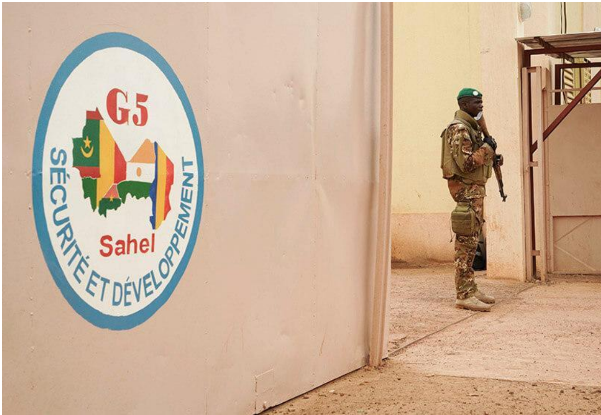
Uno de los cuarteles de la fuerza multinacional Sahel 5 (G5) que opera en Mali.

El pasado 24 de mayo, a menos de diez meses del anterior, se produjo un nuevo golpe militar contra el presidente Bah Ndaw, lo que confirma que en Mali, desde 2012, el único poder constante es la inestabilidad.