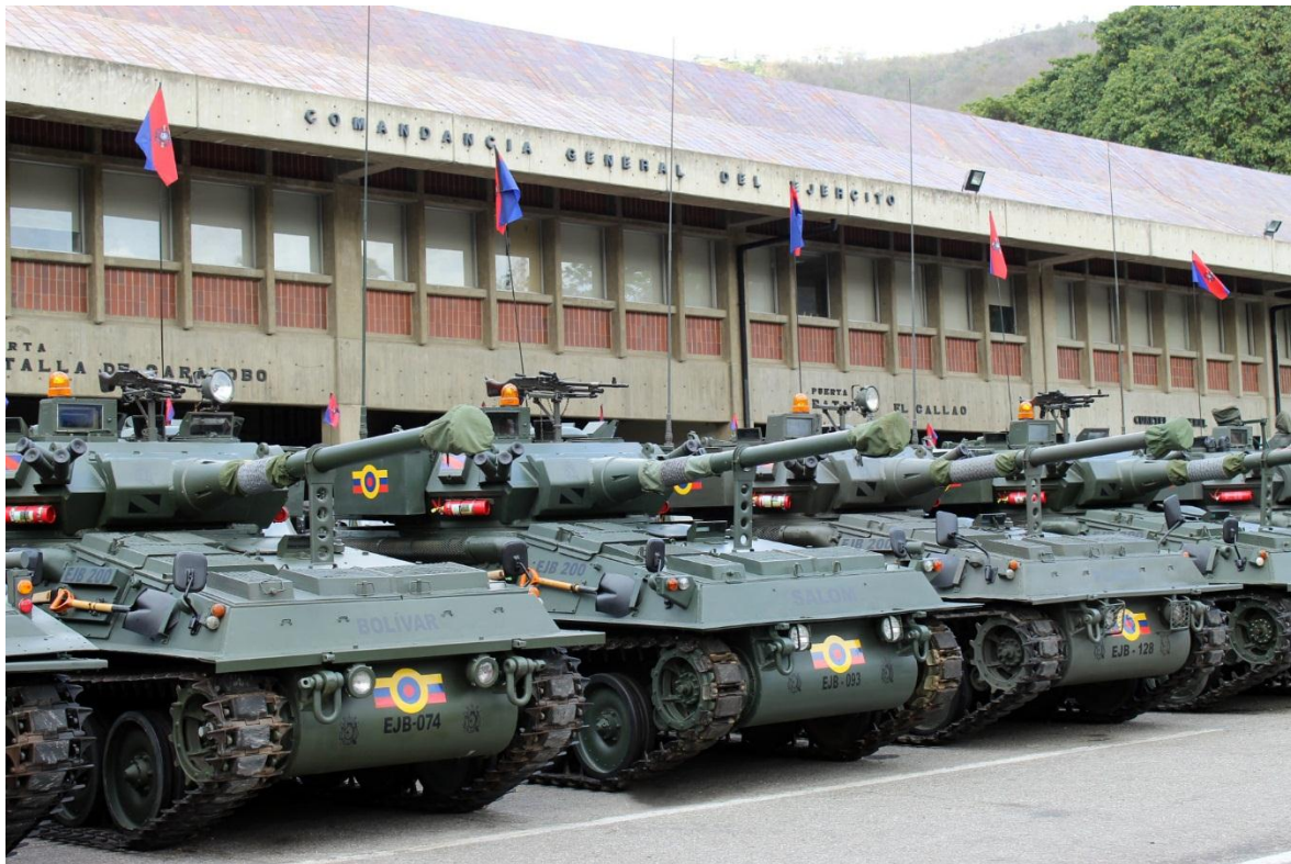
Tanques Scorpion C90, parte del material recuperado.

Este año, el Ejército Bolivariano de Venezuela implementó un programa llamado “Yo también tengo mi tanque”, por medio del que se estimuló al personal uniformado, a las empresas públicas y privadas, y a personas de la sociedad civil, a participar en la recuperación de distintos tipos de blindados que se encontraban totalmente inoperantes, la mayoría en estado de abandono en los patios de las unidades, y otros incluso como “gateguard” o en museos, sin motor, y sin ningún sistema en su interior.