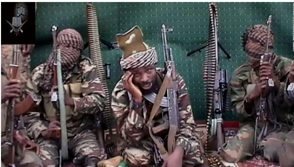
Al centro, Abubakar Shekau, líder de Boko Haram, presumiblemente muerto recientemente,

Como sucede cada tanto, estallan rumores sobre la muerte del emir de la banda terrorista Boko Haram, Abubakar Shekau, que dirige la organización desde 2009, convirtiéndola en una de las más letales y activas del mundo, llegando desde el bosque de Sambisa en el estado de Borno, en el norte de Nigeria, a operar con frecuencia en varios países de África Occidental como Chad, Camerún y particularmente Níger, donde una importante khatiba (brigada) protagoniza constantes ataques contra la población civil y puestos militares.