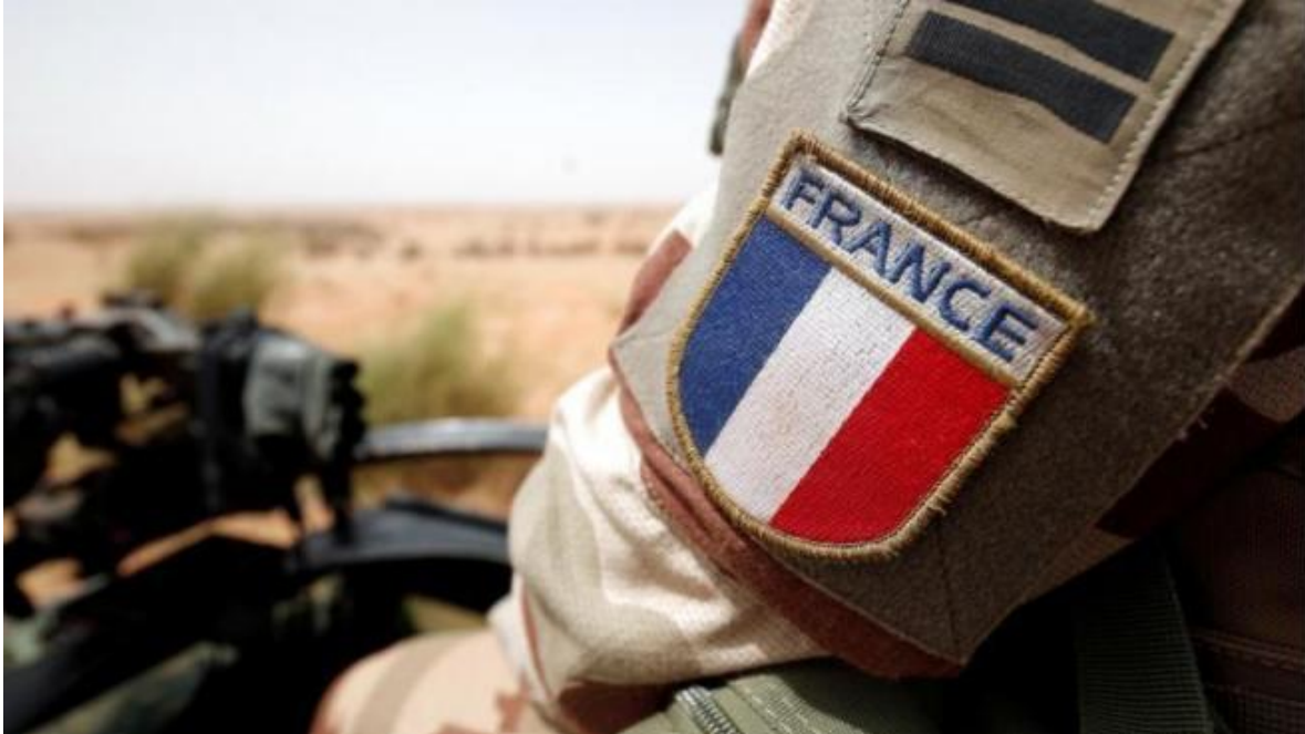
Tropas francesas en operación antiterrorista en África.