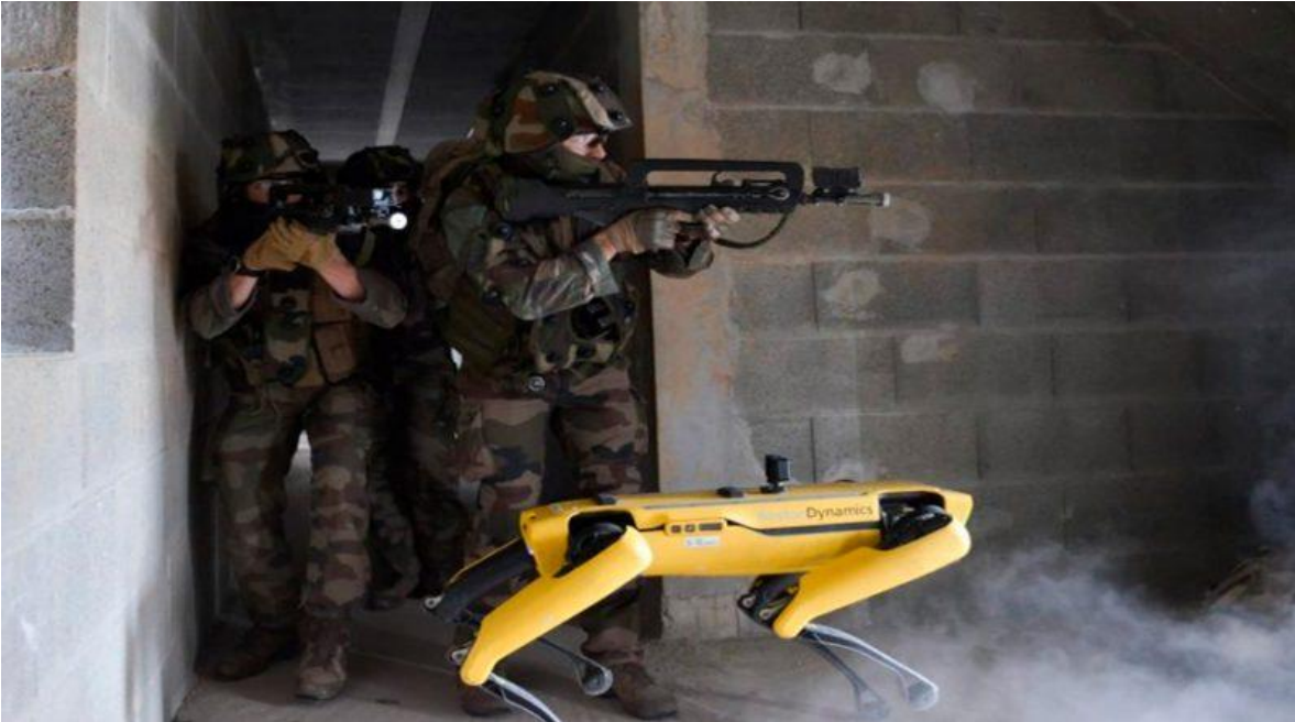
Elemento robótico de reconocimiento, dotación de una unidad antiterrorista francesa.