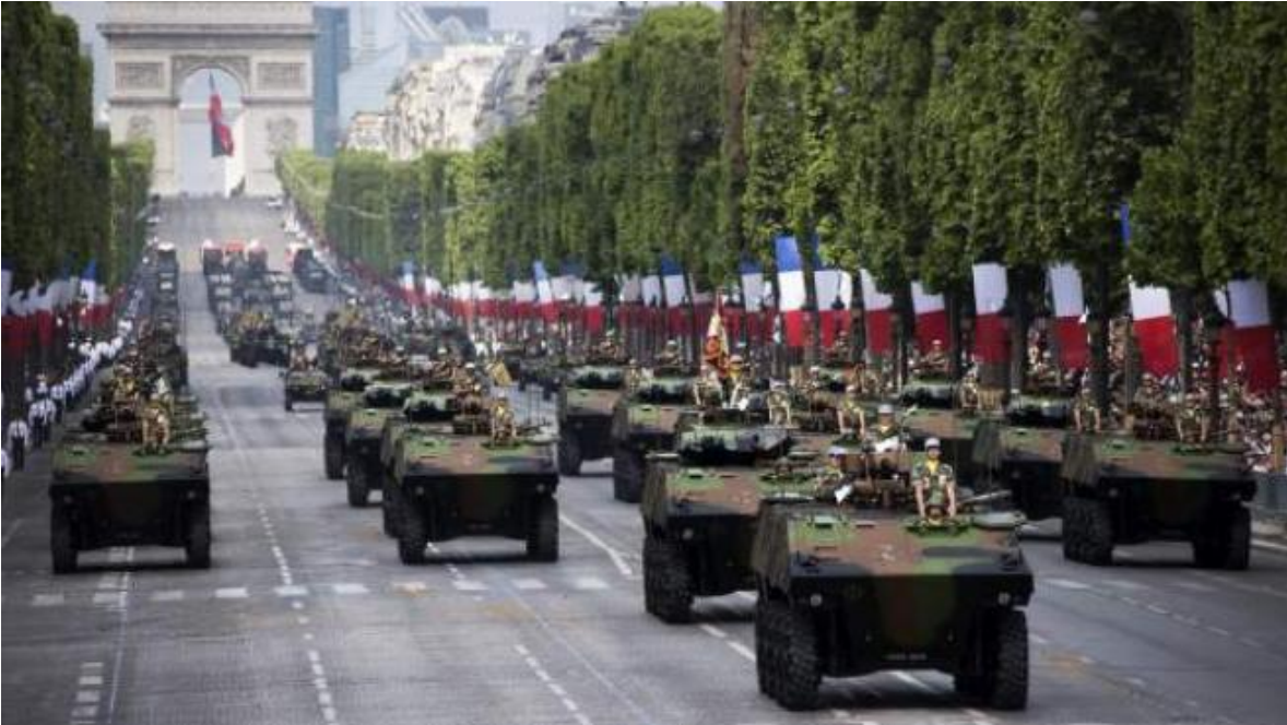
Desfile militar en París. Francia produce casi la totalidad del equipamiento militar que necesita.