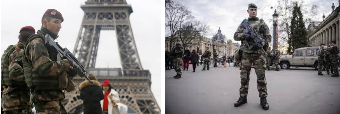
Unidades del Ejército Francés en patrullaje urbano, en el arco de un despliegue antiterrorista.