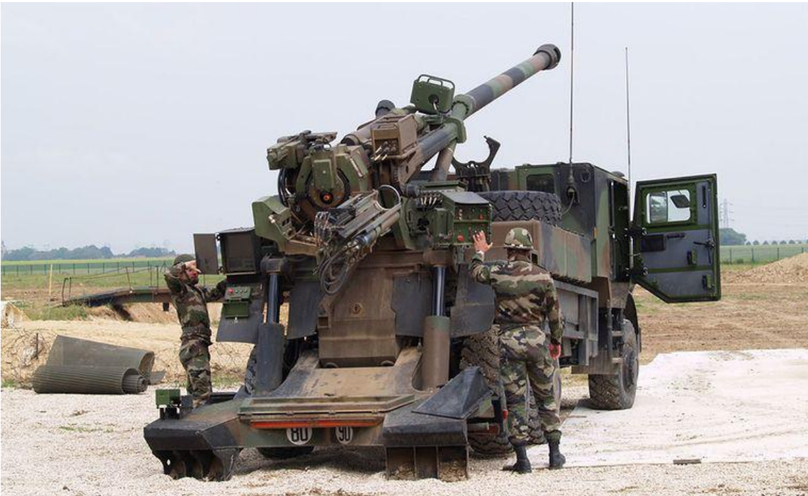
Obús autopulsado Caesar del Ejército Francés.