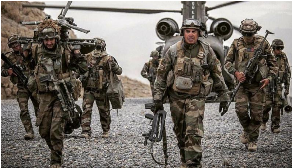
Unidad aerotransportada del Ejército Francés, equipada con el característico fusil de asalto tipo bullpup.