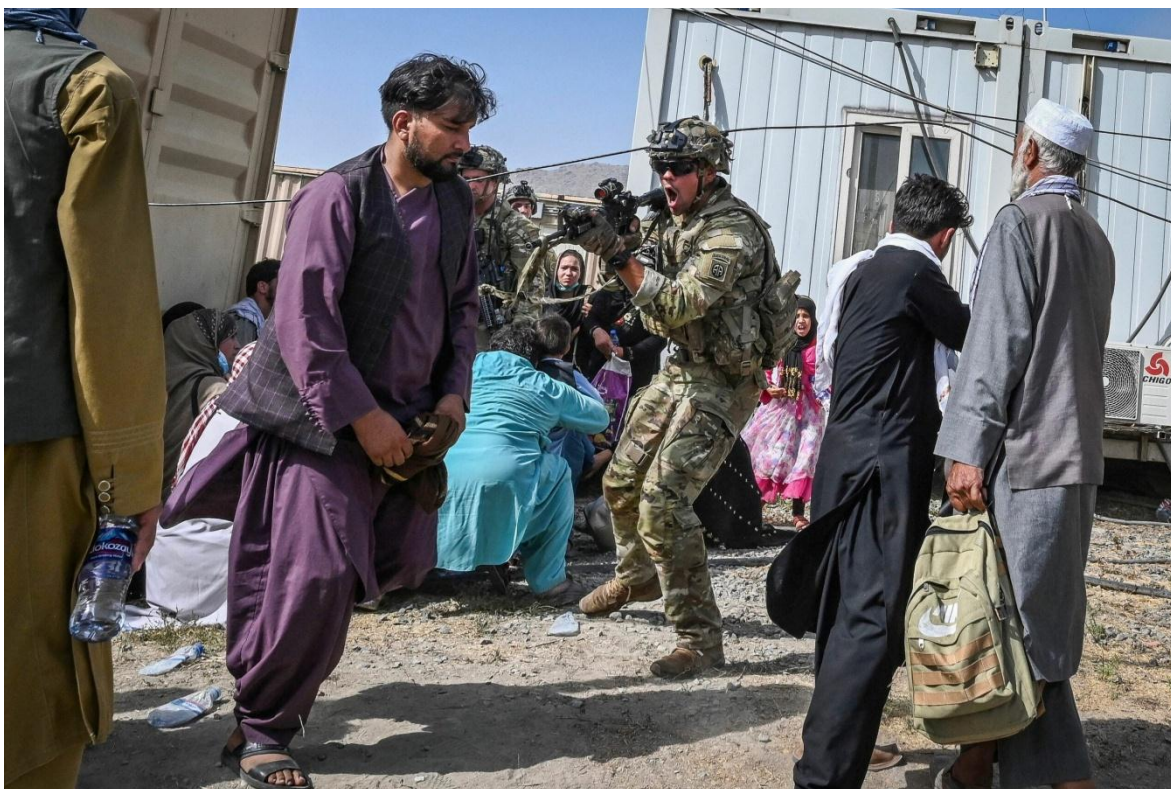
Soldados del US Army en Kabul.

Estados Unidos, que con el ejército más poderoso que pueda recordar la historia, en octubre de 2001, a plena luz del día y utilizando toda su parafernalia mediática invadió Afganistán, un país postrado en el medioevo, para legitimar su Guerra Global contra el Terror o GWOT. Veinte años después, abandona el país centroasiático como lo hacen los ladrones de gallinas, entre sombras y en silencio, derrotados por una banda de “zaparrastrosos y mal olientes” barbudos, pero eso sí, los más fantásticos guerreros que la épica pueda imaginar. No solo deja ese país sin haber modificado estructuralmente nada, sino que bajo el efecto talibán, ha logrado darle ínfulas al terrorismo integrista, para instalarse en la mayoría de las naciones musulmanas e incluso establecer cabeceras de playa desde San Petersburgo a Barcelona y producir