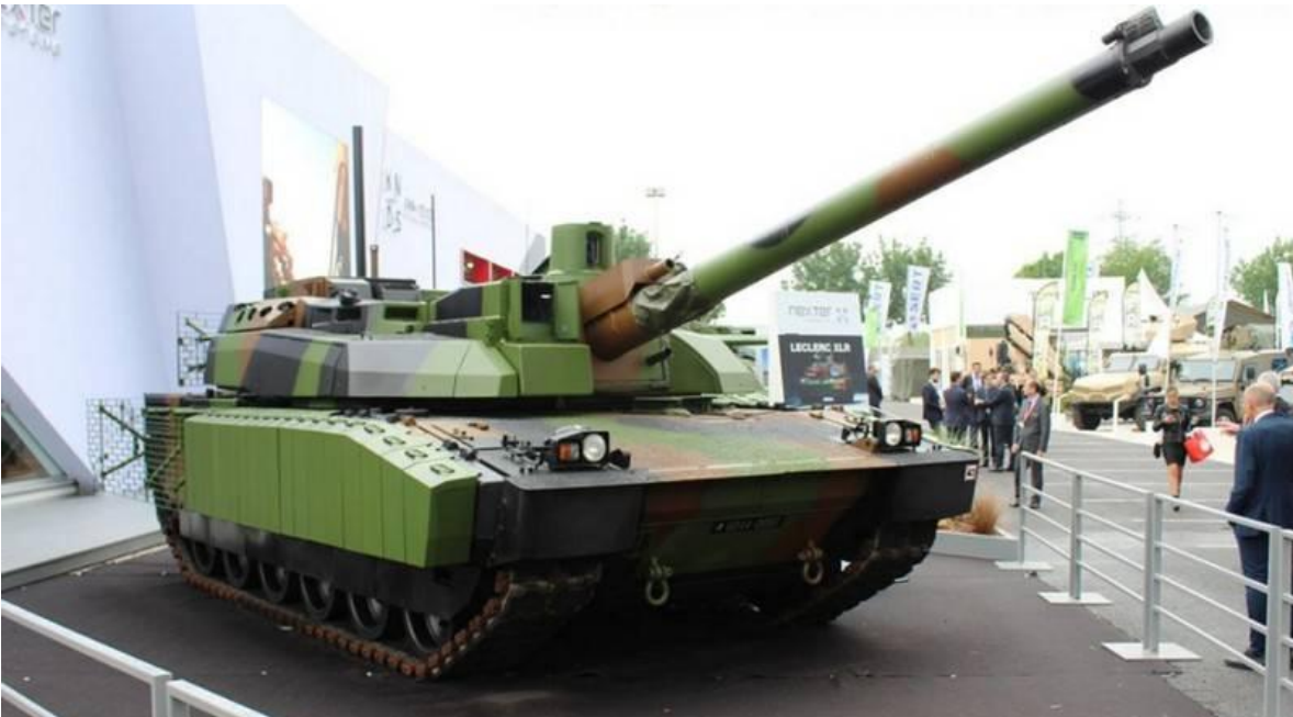
Tanque principal de batalla del Ejército Francés.