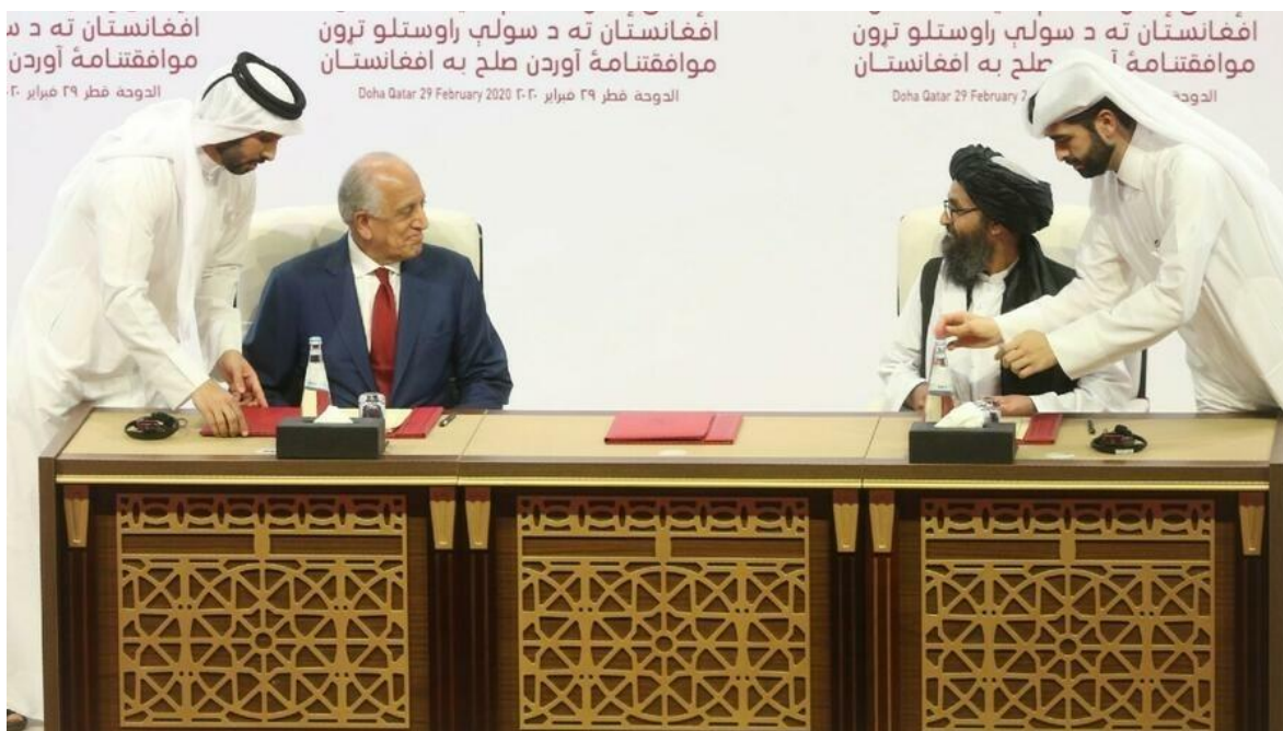
El enviado de paz de Estados Unidos, Zalmay Khalilzad, a la izquierda, y el mulá Abdul Ghani Baradar, el principal líder político del grupo talibán, firman un acuerdo de paz entre talibanes y funcionarios estadounidenses en Doha, Qatar. 29 de febrero de 2020.

El primero de mayo, los 2500 efectivos norteamericanos juntos a los 7 mil de sus socios de la coalición occidental, que invadieron Afganistán en 2001, iniciaron la retirada total del país, tal como lo había anunciado el presidente Joe Biden, el pasado catorce de abril, faltando a los acuerdos de Doha (Qatar) de febrero del 2020, entre la administración Trump y los Talibanes.