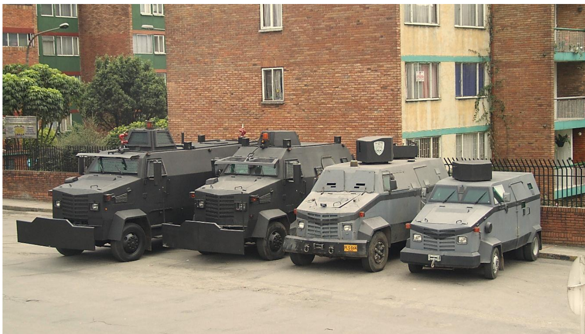
Familia de blindados producidos por una blindadora colombiana con sede en Bogotá.

Las Fuerzas Armadas Colombianas poseen un conjunto bastante heterogéneo de vehículos blindados de fabricación nacional. Se han ido adquiriendo en pequeños lotes, para cubrir necesidades puntuales, sin obedecer a planes estratégicos de desarrollo de la fuerza, ni para impulsar a la industria nacional del sector defensa. La mayoría de ellos tienen un diseño bastante pobre, aunque son funcionales al objetivo por el cual se les compró. La experiencia previa de los fabricantes, se limitaba a blindar vehículos de lujo.