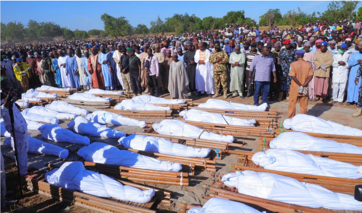
Funeral por los asesinados por presuntos militantes de Boko Haram en Zaabarmar, Nigeria, el domingo 29 de noviembre de 2020.

Desde mediados de marzo los grupos fundamentalistas Boko Haram y el Estado Islámico de la Provincia de África Occidental o ISWAP, por sus siglas inglés, ambos tributarios del Daesh, incrementaron sus acciones, contra diferentes objetivos en los estados nordestinos de Borno y Yobe en Nigeria, los que se han intensificaron entre los días diez y catorce de abril, obligando a la evacuación del personal humanitario y el desplazamiento de casi 40 mil residentes, de las diferentes ciudades, aldeas y miles de campesinos que viven en el área.