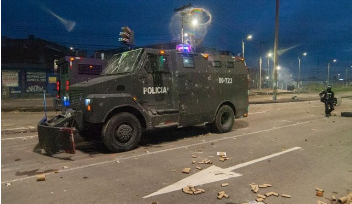
Blindado antidisturbios de la Policía Nacional de Colombia, dotado con el sistema NL/TLMS Venom sobre la cabina.

Podemos observar que, aunque no sean visualmente muy atractivos en comparación con otros vehículos disponibles en el mercado, cumplen muy bien las funciones para las que fueron adquiridos. Los cinco modelos presentados aquí (el de la segunda foto es distinto a los anteriores), son solo una parte de la diversidad de vehículos blindados producidos nacionalmente, que incluye camiones tipo Gun Truck, un vehículo similar al Urutú, y también remolques trampa, de los que brotan torretas armadas y desembarca tropa, sorprendiendo al enemigo.