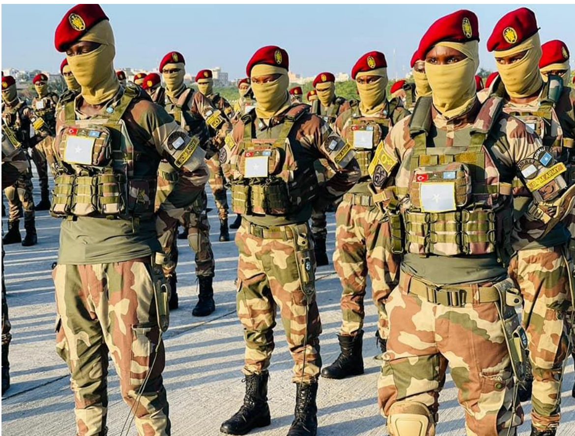
Comandos somalíes "Gorgor" (Aguila) entrenados por Turquía.

La dirigencia de Somalia, el epitome del Estado Fallido , parece tener como única condición el poder de profundizar las crisis más allá de lo explicable, y a quien haga un recorrido por la historia del país de estos últimos cuarenta años, no le quedará ninguna duda.