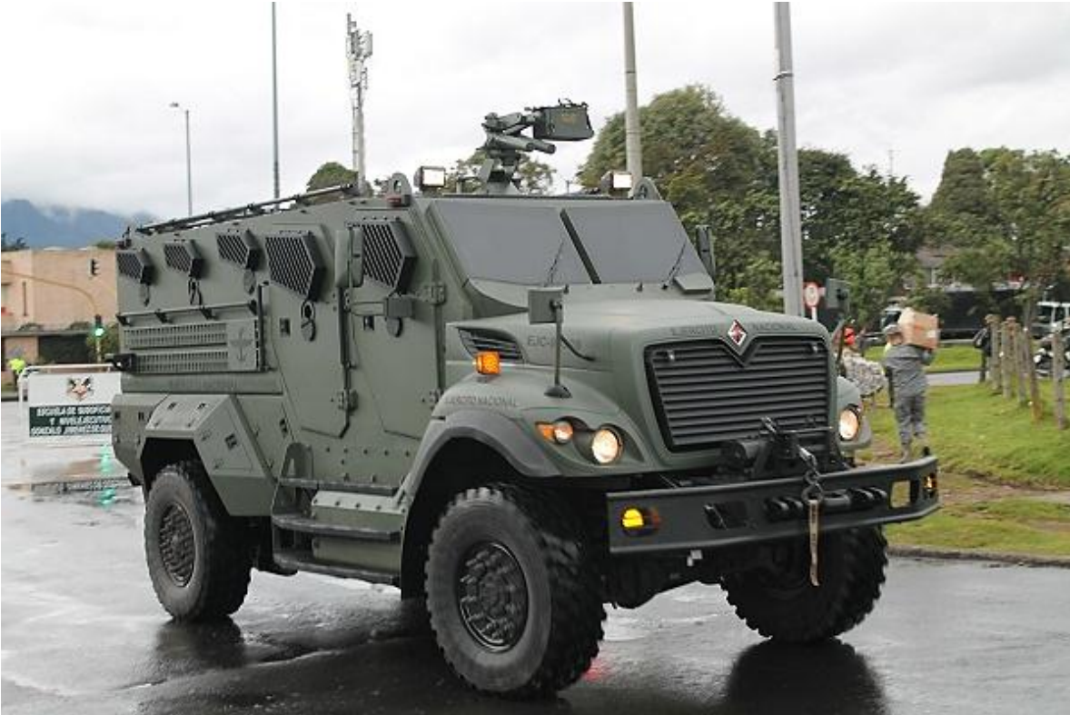
Este es el blindado nacional de más reciente adquisición por el Ejército de Colombia. Se observan las mejoras estéticas.

vehículos blindados requeridos por las Fuerzas Armadas, con un creciente nivel de complejidad y eficiencia, que eventualmente les permitiría competir en los mercados internacionales.