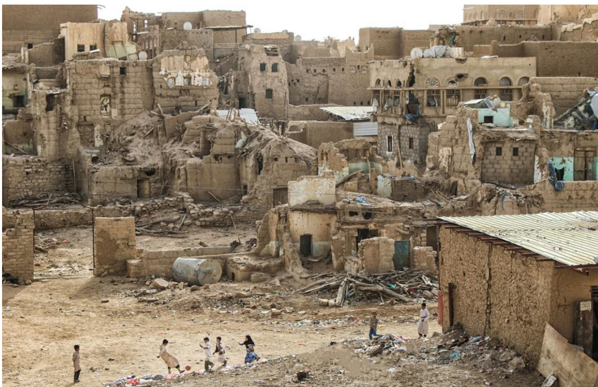
La guerra ha devastado a Yemen, llevando sufrimiento y muerte a la población civil.

En la tarde del pasado miércoles treinta de diciembre, en el aeropuerto de la ciudad de Adén, en el sur de Yemen, en el momento que abandonaban el avión, proveniente de Riad, los miembros del nuevo gabinete de "unidad", se escucharon dos fuertes explosiones, de las que se cree fueron producto de un ataque con drones, o de tres proyectiles de mortero, que dejaron hasta ahora 26 muertos y más de un centenar de heridos.