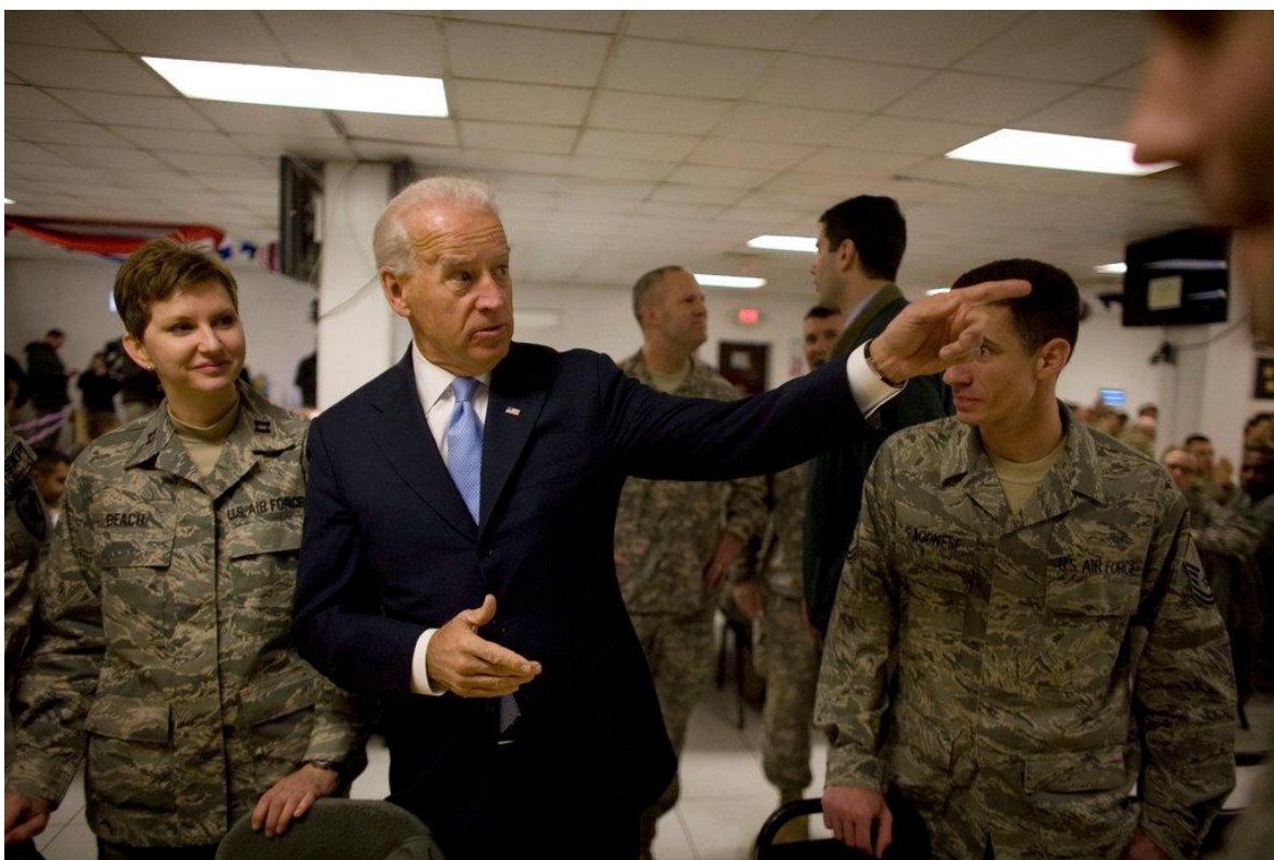
Joe Biden con tropas de los Estados Unidos en Afganistán. Imagen de archivo.

No son pocas las problemáticas que el nuevo presidente norteamericano Joe Biden debe atender con urgencia en el plano internacional, las múltiples demandas, no solo son responsabilidad de la inoperancia de su inmediato predecesor Donald Trump, sino, y principalmente, se deben a los frentes que abrieron y profundizaron George W. Bush y Barack Obama, de quien Biden fue vicepresidente en sus dos periodos.