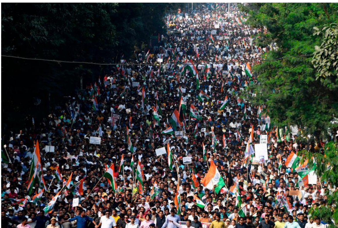
Multitudinarias protestas en la India en defensa del sector agrícola. Imagen ilustrativa.

Desde el pasado ocho de junio se inició en la India, una lucha, que por varios meses se mantuvo sorda, entre los medianos y pequeños productores agrícolas o kisans y el gobierno neo fascista de Narendra Modi, tras conocerse la intención del Primer Ministro, de impulsar una serie de reformas a la legislación agrícola, que desde la Revolución Verde de la década de 1960, en la que se incrementó la producción gracias al uso intensivo de fertilizantes y pesticidas, salvó al país de abismo de la hambruna, a las que se le agregaron una serie de normas en la comercialización de esas cosechas, por lo que la actividad se incrementó de manera exponencial, hasta los años noventa. Aunque hoy, solo representa alrededor del 15 por ciento de la economía del país, en su tiempo alcanzó a significar un tercio del producto bruto interno.