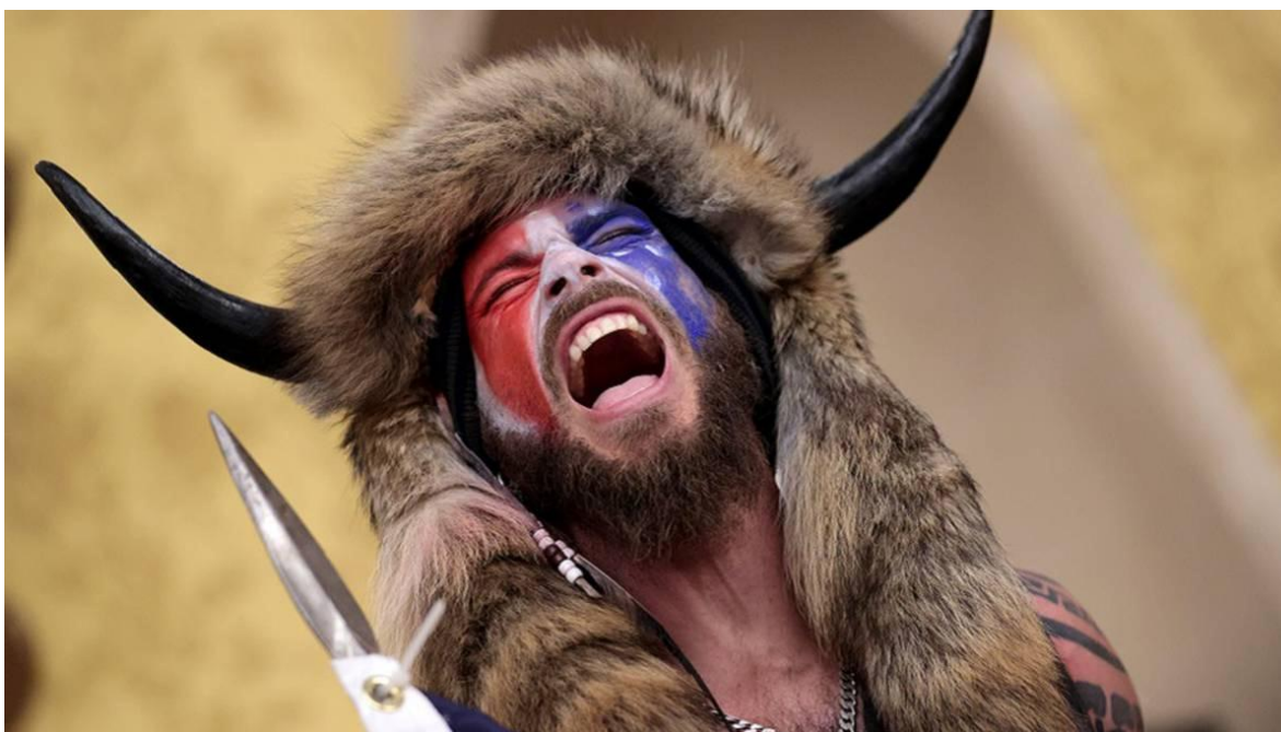
Jake Angeli, "El Lobo de Yellowstone", uno de los protagonistas del asalto al Capitolio en EE.UU.. Hoy detenido.

Si alguien cree que lo sucedido en el Congreso norteamericano, el pasado miércoles seis, cuando una horda de imbéciles, creyendo que la revolución blanca se había iniciado, intentaron tomarlo, es algo grave, se equivoca, como mucho es pintoresco. Ya que en ese edificio se ha dado marco legal a las peores atrocidades cometidas por los seres humanos, por lo menos desde el fin de la segunda guerra mundial hasta hoy. Sino, con solo analizar lo sucedido en esa "magna" casa, el 10 de octubre de 1990, cuando una atribulada joven, de solo quince años, se presentó ante el Comité de Derechos Humanos, para dar testimonio de las atrocidades que habían cometido los hombres de Saddam Hussein en una clínica maternal de Kuwait, que no conformes con invadir el país, se entretenían arrancado a los recién nacidos de las incubadoras para lanzarlos por las ventanas, hechos jamás corroborados por ningún paper oficial o investigación periodística. Los dichos de Nayirah, que se presentó así, a secas, sin dar otro dato de su