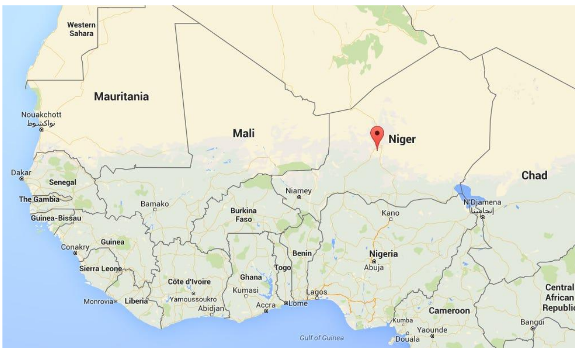
Ubicación geográfica de Níger, en el continente africano.

El sábado 2 de enero, en Níger, se conocían los resultados de las elecciones presidenciales realizadas el pasado 22 de diciembre, que dejaron en la carrera electoral al oficialista Mohamed Bazoum, ex ministro del Interior, del gobernante Partido para la Democracia y el Socialismo que consiguió un 39% y con el 17% a Mahamane Ousmane, quien, en 1993, se convirtiera en el primer presidente elegido democráticamente del país, para ser desplazado tres años después por un golpe de estado. La segunda vuelta se celebrará el 21 febrero próximo, donde sin duda el problema de la seguridad será el tema gravitante. Aunque se teme al igual que sucedió en la primera vuelta, los reproches, denuncias y acusaciones entre los candidatos, se vuelvan a convertir en el epicentro de las discusiones, antes de la solución a la violencia