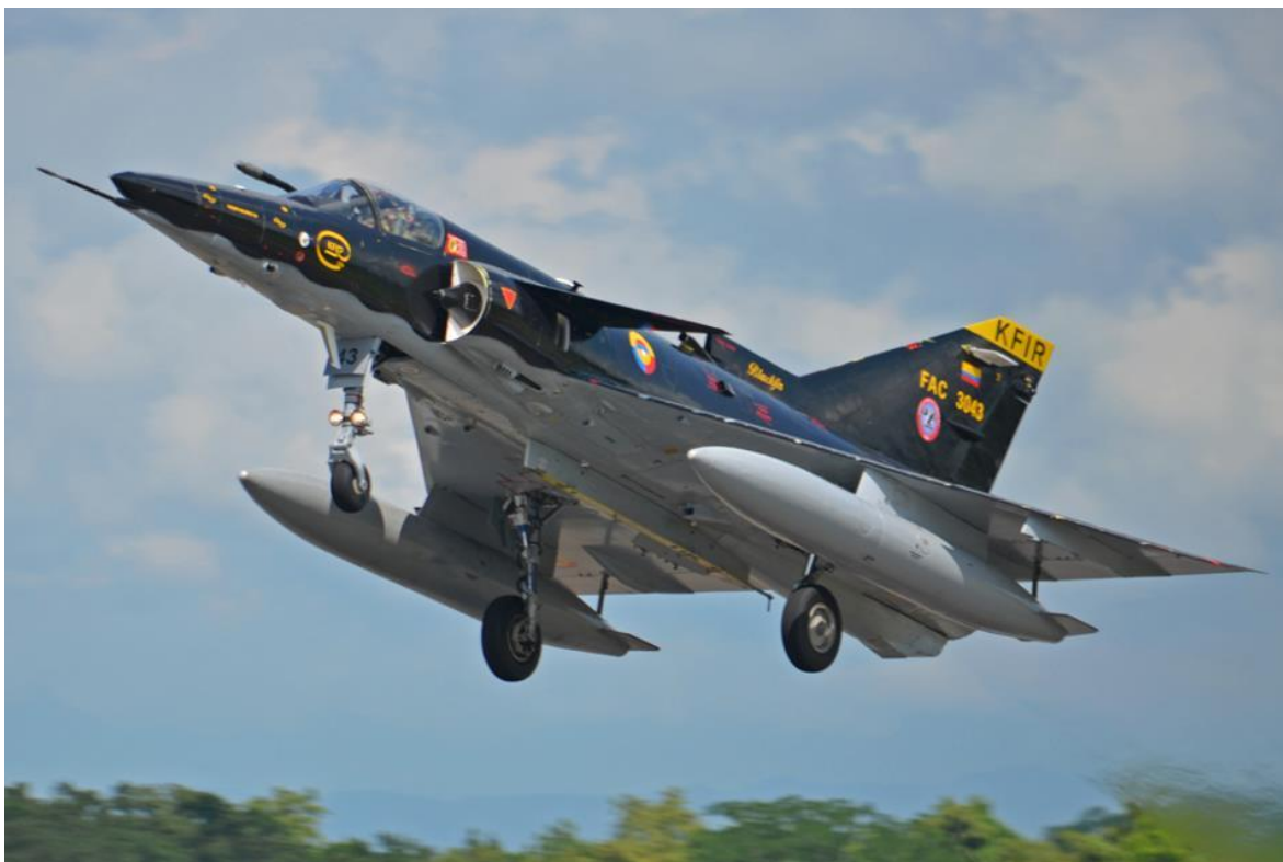
Cazabombardero Kfir de la FAC, que por su mimetismo generó muchas especulaciones en su momento.

He publicado en esta revista una serie de artículos referidos al armamento empleado por la Fuerza Aérea Colombiana. En esta oportunidad, revisaremos el inventario de cañones y ametralladoras.