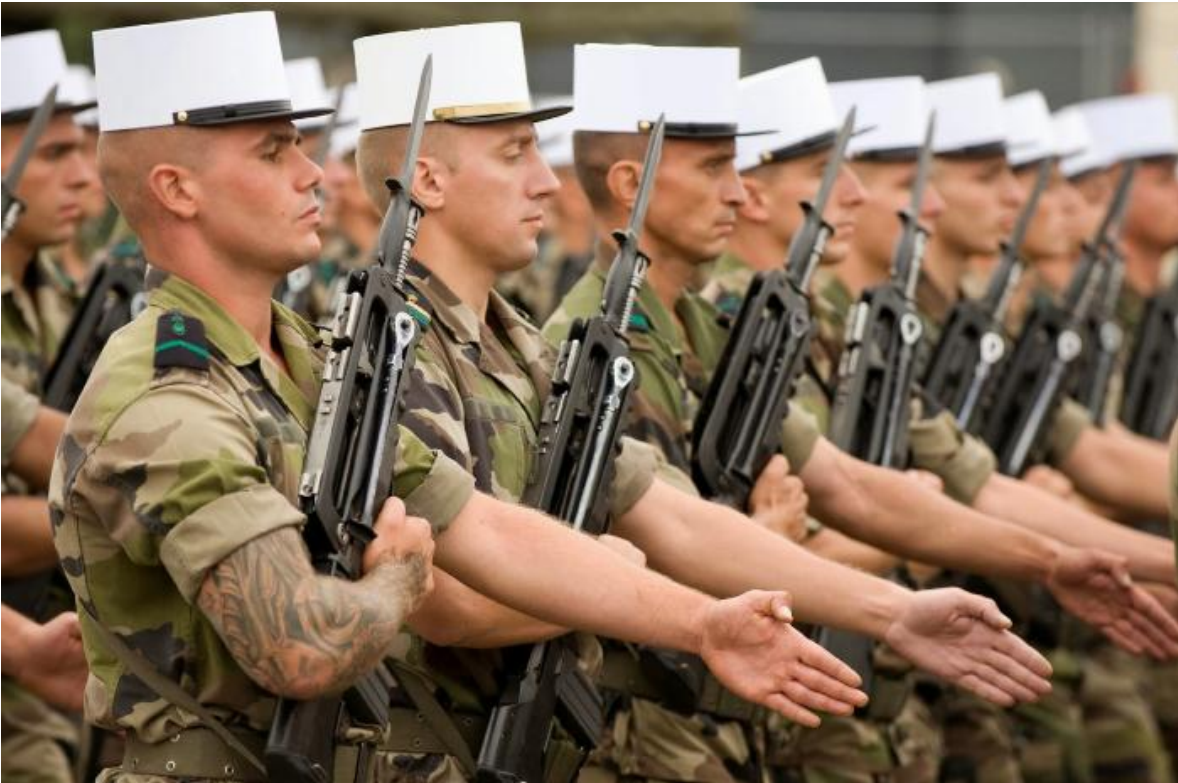
Legión extranjera. Histórico instrumento colonial francés.