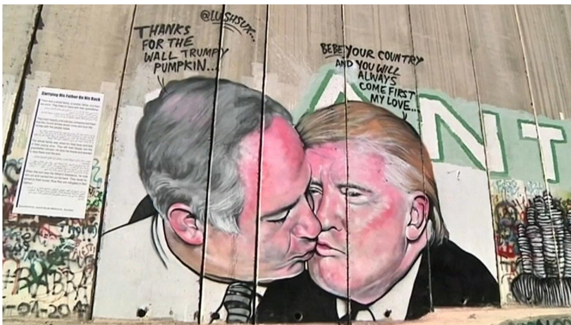
Grafiti en israel que caricaturiza la relación de los líderes de Estados Unidos e Israel.

Quienes tienen a cargo llevar las estadísticas de muertos por Covid-19, enfrentarán una seria encrucijada al momento de anotar en las planillas al presidente Donald Trump, porque si bien, todavía vive y aspira a resistir en la Casablanca, cuál Hitler degradado en el decadente Führerbunker, de la Gertrud-Kolmar-Straße 14, de Berlín. No caben dudas que a Trump lo ha matado la pandemia, junto a otros casi 250 mil norteamericanos, por el desprecio con que el 45° presidente de los Estados Unidos, enfrentó la crisis sanitaria.