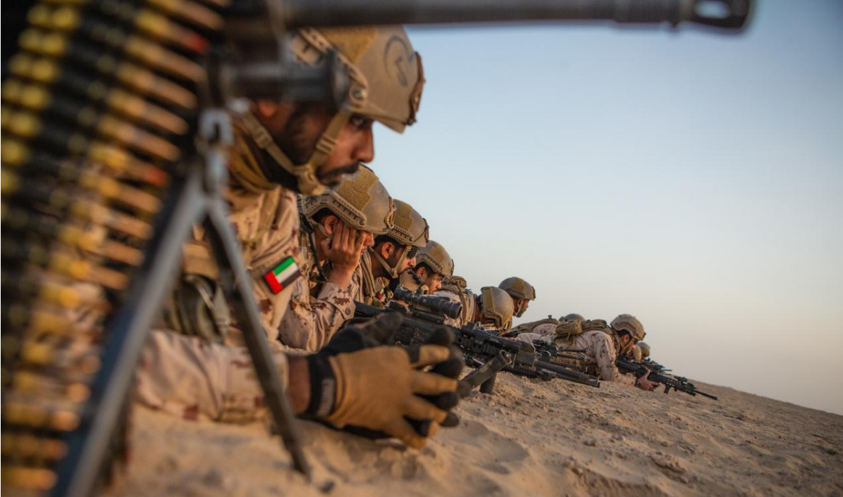
Soldados de los Emiratos en un entrenamiento en el desierto.