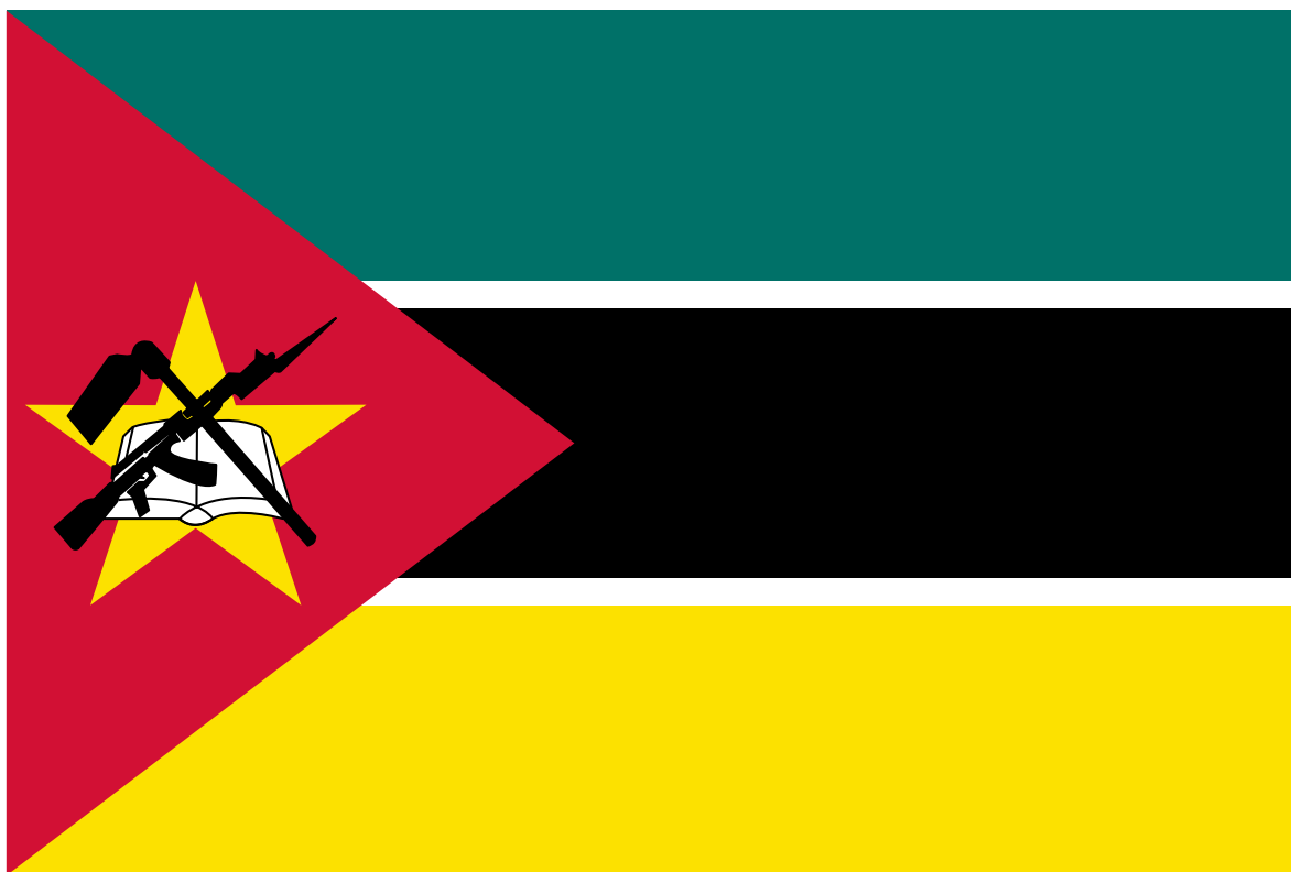
Bandera nacional de Mozambique. Observese la presencia de un fusil Ak-47.

Lo que tímidamente comenzó en octubre de 2017 con las primeras acciones del grupo insurgente, afiliado al Daesh global, conocido vulgarmente como al-Shabbab, por el grupo fundamentalista somalí, aunque su verdadero y cada vez más resonante nombre es: Ansar al-Sunna (Seguidores del Camino Tradicional o Defensores de la Tradición), que opera primordialmente en la provincia de Cabo Delgado al norte de Mozambique, en estos momentos se ha convertido en una pesadilla, no solo, para los pobladores de la región y las autoridades tanto locales como nacionales, sino también para las fuertes inversiones que distintas empresas emergentes, particularmente la francesa Total , están realizando