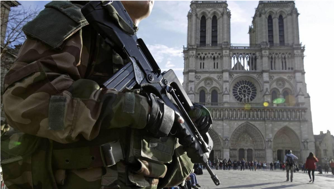
Tropas francesas patrullan las calles en previsión de nuevos atentados.