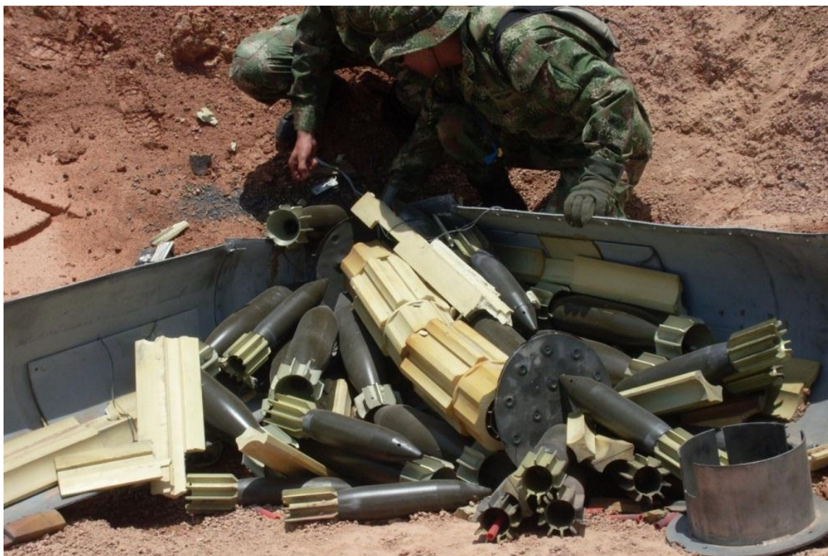
Proceso de destrucción de una bomba de racimo (cluster) tipo ARC-32, en la base de Marandúa, Vichada.

Durante la década de los 90 la Fuerza Aérea Colombiana adquirió de Chile un lote de bombas modelo CB-250K (cada una lleva 240 submuniciones), y de Israel un lote de bombas ARC-32 (cada una con 32 submuniciones). En el año 2006 se utilizaron por primera vez para destruir pistas del narcotráfico en lugares recónditos de la geografía colombiana. Para el año 2008 Colombia adhiere a los Acuerdos de Oslo para la prohibición de las bombas de racimo, y en cumplimiento de dichos acuerdos internacionales, procede a destruir su inventario de estas armas, que para el momento constaba de 42 CB-250K y 31 ARC-32.