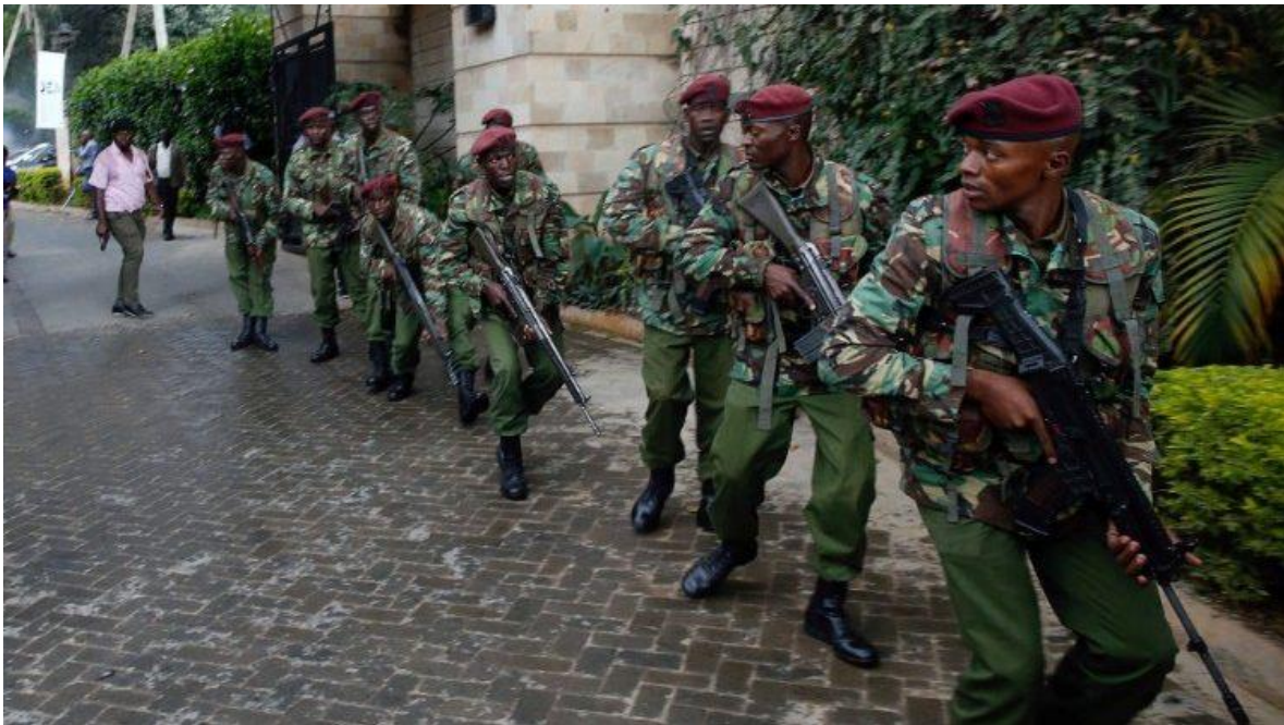
Patrullaje urbano en operación antiterrorista en la capital de Kenia.

Casi al mismo tiempo, se estableció otra unidad de élite, las Fuerzas Especiales (SF), que formaron la primera Fuerza de Operaciones Especiales de Kenia. El equipo, conocido como Regimiento de Operaciones Especiales (SOR), está formado por la Fuerza de Ataque de los Rangers - identificada como 40RSF - y las Fuerzas Especiales (SF) - conocidas como 30S. Tanto RSF como SF eran relativamente desconocidas hasta que se lanzó la Operación Linda Nchi y fueron desplegados para operaciones especiales en Somalia.