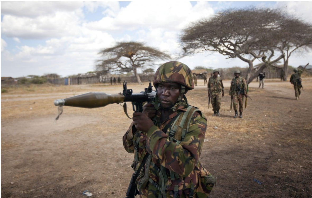
Soldados de Kenia desplegados en las áreas de operaciones antiterroristas.

La guerra no convencional es un amplio espectro de operaciones militares y paramilitares que se llevan a cabo en zonas política y socialmente frágiles, y sus actividades incluyen la guerra de guerrillas, la evasión y fuga, la subversión, el sabotaje y las operaciones encubiertas o clandestinas de baja visibilidad.