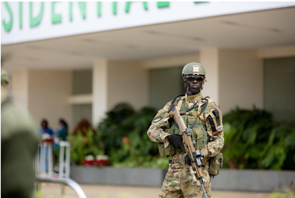
Operativo de las Fuerzas Especiales de Kenia

Si bien la mayoría de sus operaciones permanecen clasificadas, los operadores SOR se han utilizado de manera más agresiva en los últimos.