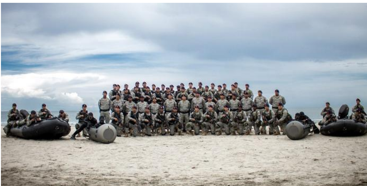
Unidad de Fuerzas Especiales, con botes neumáticos tipo Zodiac y "lanchas submarinas".

La información oficial que proporciona la institución sobre su futuro inmediato, es la siguiente: "La Infantería de Marina de la Armada Nacional es un cuerpo altamente entrenado y en permanente evolución, capaz de adaptarse a los actuales y futuros escenarios colombianos, buscando la simplicidad en sus estructuras, la flexibilidad en sus procedimientos, el perfeccionamiento de su formación y capacitación, pero manteniendo siempre la lealtad, el espíritu de sacrificio y la disciplina como los pilares fundamentales para el cumplimiento de su misión constitucional que proyecta las capacidades de la Armada Nacional en un escenario para en el año 2030 "ser una marina mediana de proyección regional", desarrollando de manera puntual: