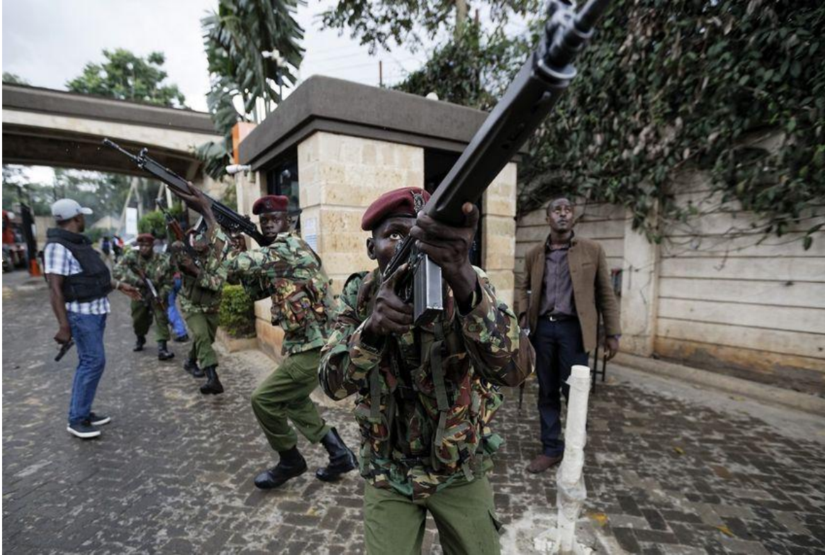
Soldados kenianos enfrentando un ataque terrorista en la zona hotelera de Nairobi.