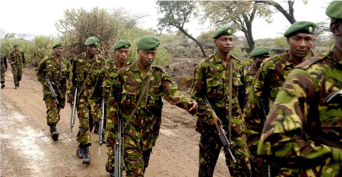
Soldados kenianos en entrenamiento.

La presencia cada vez más sólida de las fuerzas especiales, incluso dentro de las fronteras de Kenia, ha sido impulsada por un fuerte aumento en la demanda de experiencia única en la guerra no convencional y el contraterrorismo. Hoy en día, la mayoría de las fuerzas especiales pueden llegar a la mayoría de los pueblos, ciudades e incluso pueblos de Kenia.