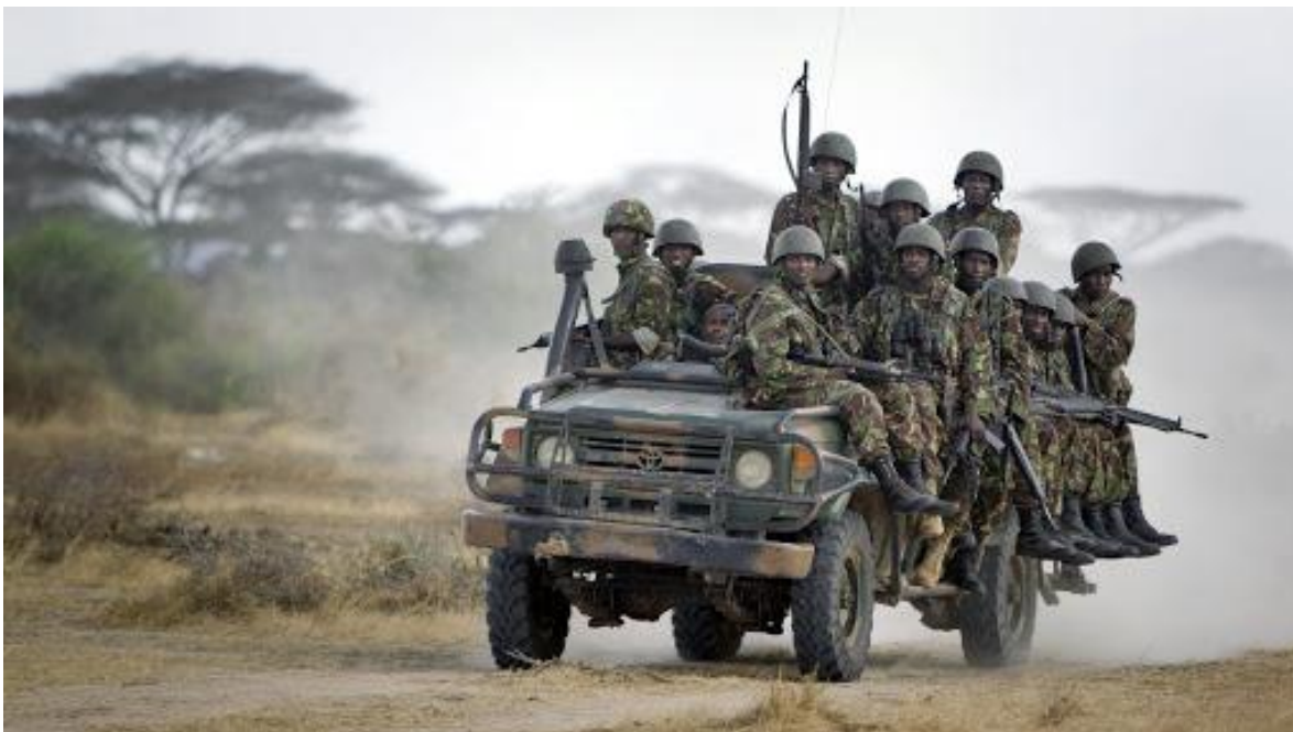
Soldados kenianos en una patrulla motorizada.

Las misiones LRS suelen agotarse física y psicológicamente y solo se despliegan los mejores. Las unidades informan al cuartel general utilizando radios, teléfonos satelitales, fotografías, transmisores GPS y punteros láser para que los drones o helicópteros de combate los localicen. Las unidades proporcionan información precisa para los ranger del KDF, las fuerzas especiales y las unidades de artillería de largo alcance. Estas unidades cumplen la función de ubicar los campamentos de Al Shabaab dentro del extenso bosque boni. Las tácticas de LRS han servido bien a ejércitos de todo el mundo, incluidas las fuerzas especiales israelíes, estadounidenses, rusas y del Reino Unido.