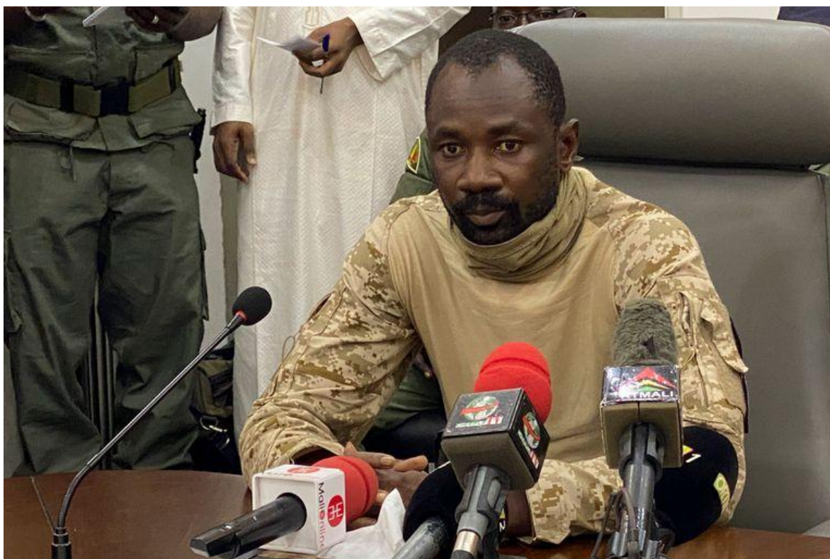
Coronel Assimi Goita, líder visible del reciente golpe de Estado en Mali.

En la mañana del pasado martes 18, tras la irrupción de varias camionetas con hombres armados dirigidos por el coronel Assimi Goita en la base militar de Soundiata en cercanías de la ciudad de Kati, en el distrito de Kulikoró, a unos doce kilómetros al norte de la ciudad de Bamako, capital de Mali, se inició un breve intercambio de disparos, entre la guardia y los incursores que se reconocían como miembros del Comité Nacional para la Salvación del Pueblo (CNSP), también hombres del ejército. Rápidamente la confusión se aclaró, se abrieron los arsenales, se armó a la tropa, y la columna invasora volvió a salir rumbo a la capital, con diez camionetas más, cargadas de efectivos fuertemente armados.