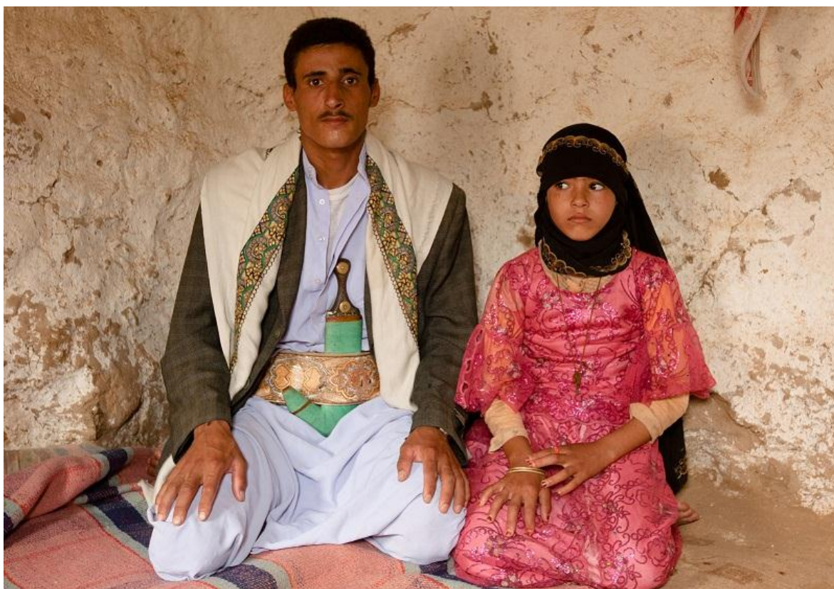
El matrimonio infantil, es una tradición muy cuestionada por los occidentales.

Una ola de indignación parece sacudir las buenas conciencias del mundo, según se puede leer en los grandes medios de comunicación, al conocerse la noticia que en el parlamento somalí se debate una ley que legitimaría los casamientos entre adultos y menores. Si bien la ley, podría hacer fracasar los esfuerzos de muchas agencias internacionales y ONGs, por impedir este tipo de práctica, se necesitará mucha energía y tiempo, fundamentalmente, para que estas clases de uniones, una costumbre ancestral por otra parte, puedan extinguirse, ya que casi un cincuenta por ciento de las jóvenes son entregadas en estas clases de matrimonio antes de cumplir 18 años, previo pago a la familia de la novia, una dote, que consiste en