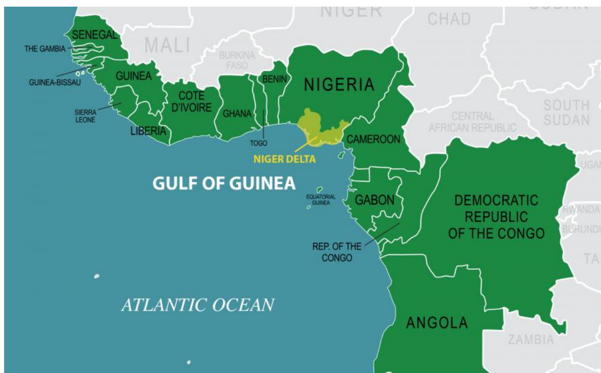
Golfo de Guinea en el África Occidental, se destaca en amarillo el delta del río Níger.

Nigeria, con casi 200 millones de habitantes, y una dimensión poco mayor a Venezuela parece ser un país destinado a amplificar hacia su interior, cuanta crisis azote al mundo. En pleno impulso conseguido tras los ataques a las torres de Nueva York, el terrorismo wahabita comienza a extenderse por la amplia geografía del islam y para 2009 se funda en el norte de Nigeria el grupo Boko Haram, que a más de una década sigue golpeando de manera constante y brutal, habiendo provocado ya más de 50 mil muertos y dos millones de desplazados, y alcanzando a irradiar su terror a los países vecinos. Sin duda, esa expansión se debe y en mucho a la corrupción endémica, que ha perdurado gobierno tras gobierno devastando las instituciones y provocando niveles de desigual-