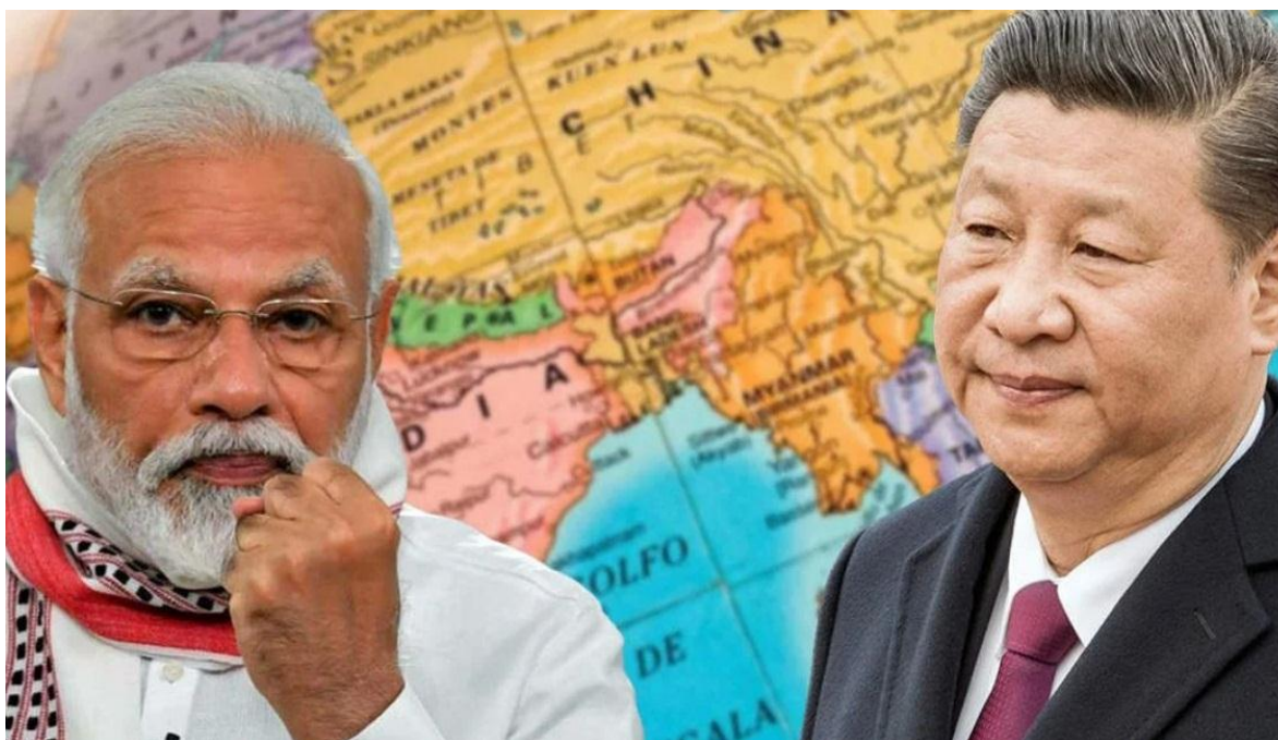
Narendra Modi y Xi Jinping líderes de las dos potencias enfrentadas.

El lacerante estigma del colonia-lismo, parece perseguir, más allá del tiempo transcurrido, a todos los pueblos que lo han sufrido y como un trazo indeleble emerge con vocación sangrienta con cada remezón, que se produce en esas geografías, acosando culturas, naciones, etnias y tribus, a las que de una u otra manera siguen arruinando, los ejemplos se cuentan por cientos de miles tanto que quizás nunca podremos llegar a quitarnos totalmente esa losa funeraria que el Imperio Británico, particularmente, ha echado sobre el mundo.