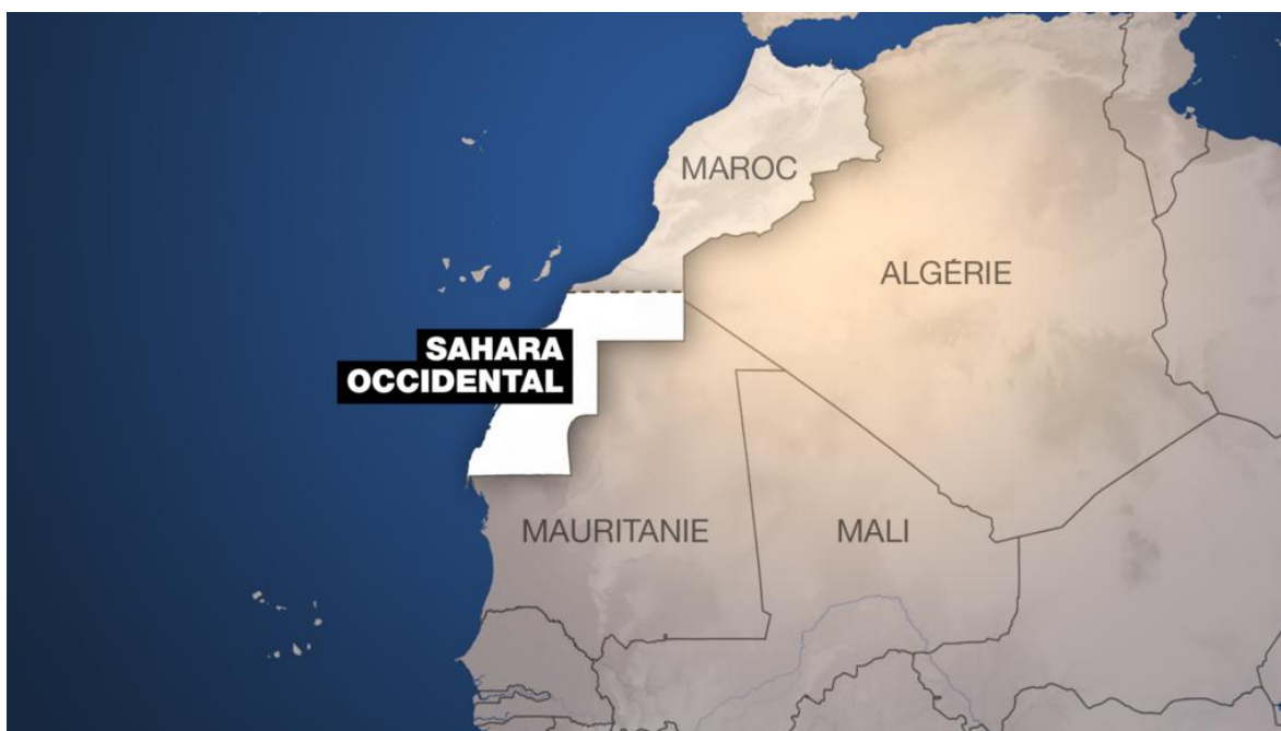
Ubicación geográfica del Sahara Occidental, al oeste de África y a orillas de océano Atlántico.

Un leve roce diplomático entre Argelia y la monarquía alauita marroquí, trajo a la memoria de algunos la tragedia del pueblo saharauí, que en 1975 fue despojado de gran parte de su territorio. El recién instalado rey Juan Carlos, quien prácticamente estrenó su reinado con una traición a su mentor, el genocida Francisco Franco, quien había acordado la independencia de la colonia de África Occidental; intentado evitar una encerrona que los Estados Unidos, preparaba con Marruecos, para apoderarse de esos 266 mil kilómetros cuadrados, de piedra y arena, pero con un subsuelo de importantes yacimientos de fosfatos, hierro, petróleo y gas. Con más de mil kilómetros de costa sobre el océano Atlántico, frente a uno de los bancos de pesca más ricos del mundo, hoy explotados fundamentalmente por empresas marroquíes y españolas. Aquel