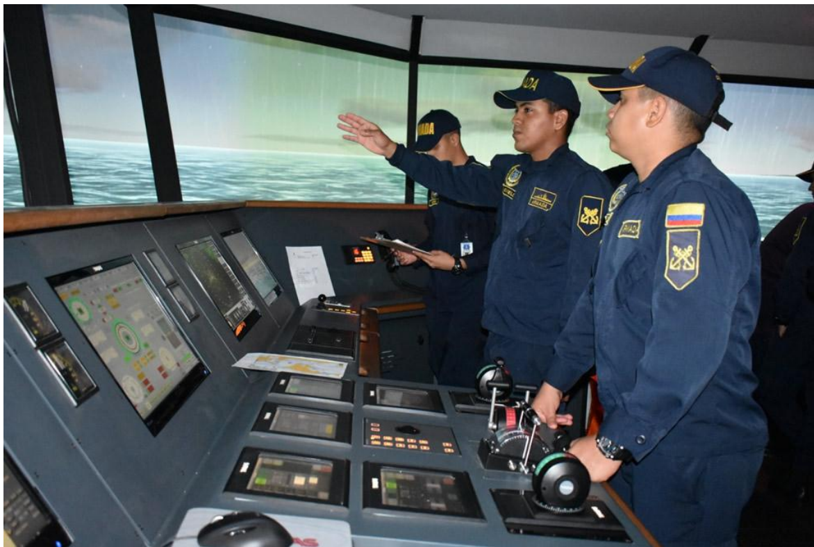
Entrenamiento a bordo del Simulador de Puente Full Mission de la ENAP

En la Escuela Naval de Cadetes “Almirante Padilla” - ENAP, ubicada en la ciudad de Cartagena de Indias, es donde se forman los futuros oficiales de la Armada Nacional de Colombia. Además, es un centro de excelencia donde tienen sede importantes dependencias de la Armada Nacional. Tal es el caso del Centro de Investigación, Desarrollo e Innovación para Actividades Marítimas - CIDIAM, que opera un centro de simulación al interior de la ENAP.