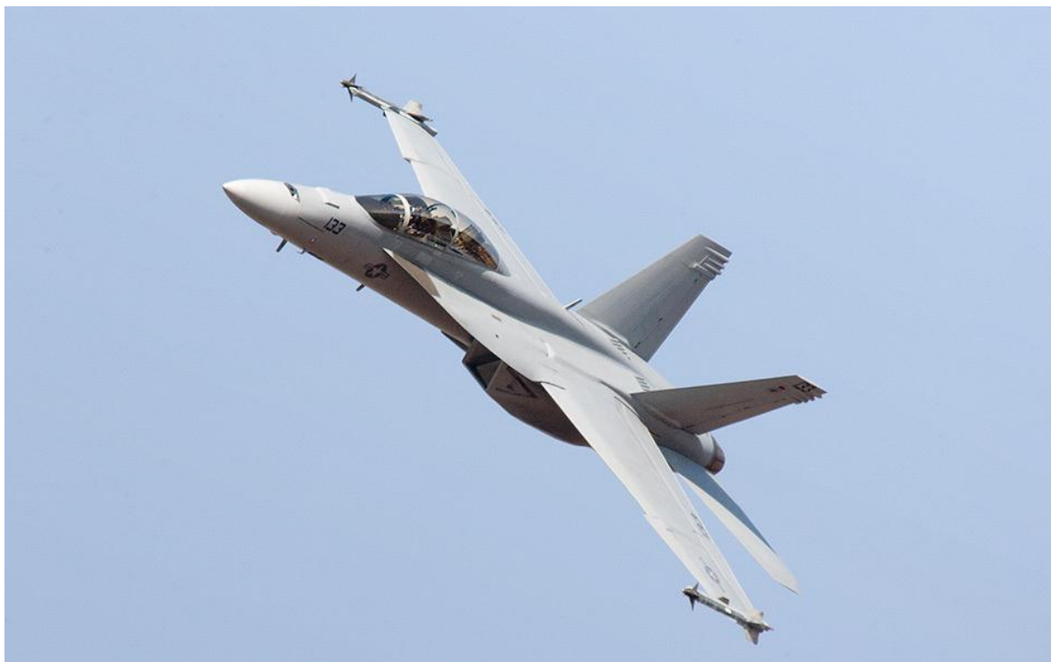
EA-18 Growler de la Armada de los Estados Unidos, US Navy

Desde hace ya un tiempo se habla de una posible intervención militar en Venezuela, y el Presidente Trump ha mencionado que está dentro del abanico de posibilidades.