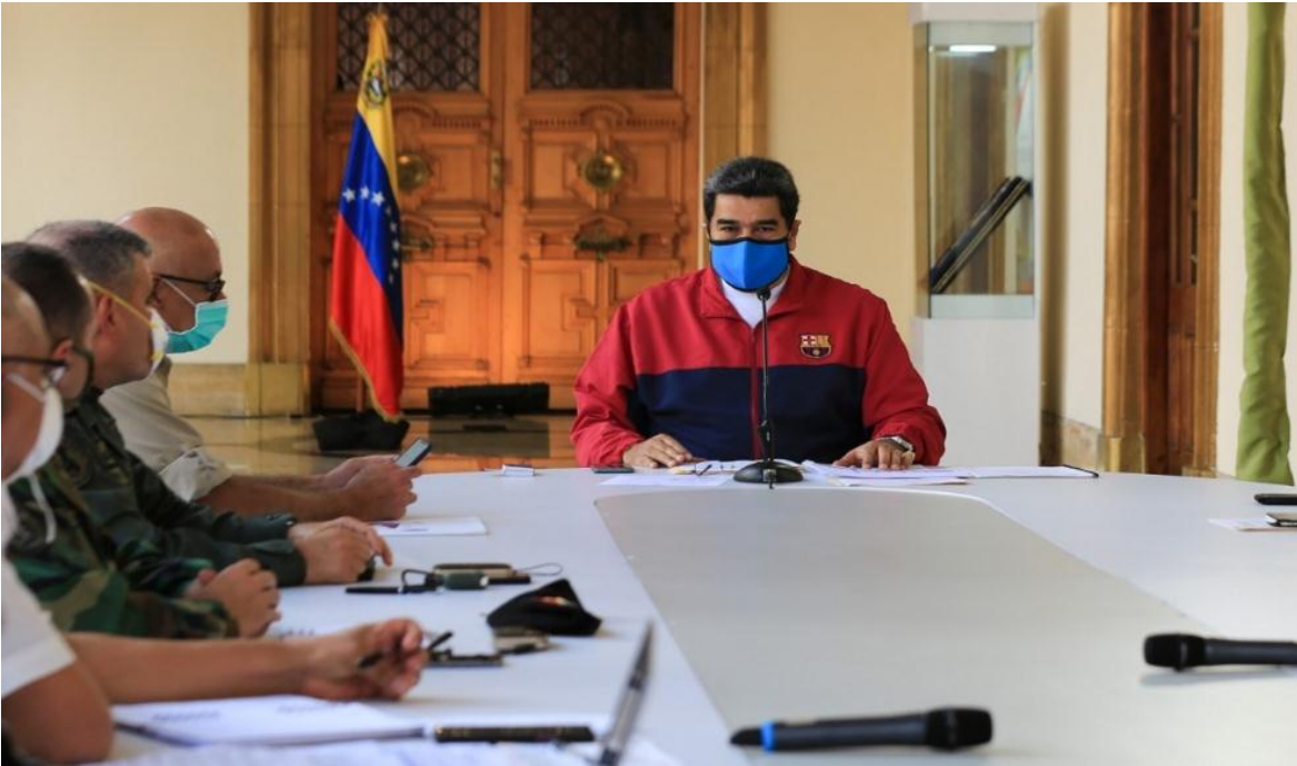
El Presidente Nicolás Maduro en reunión con parte de su equipo de trabajo, en tiempo de pandemia.