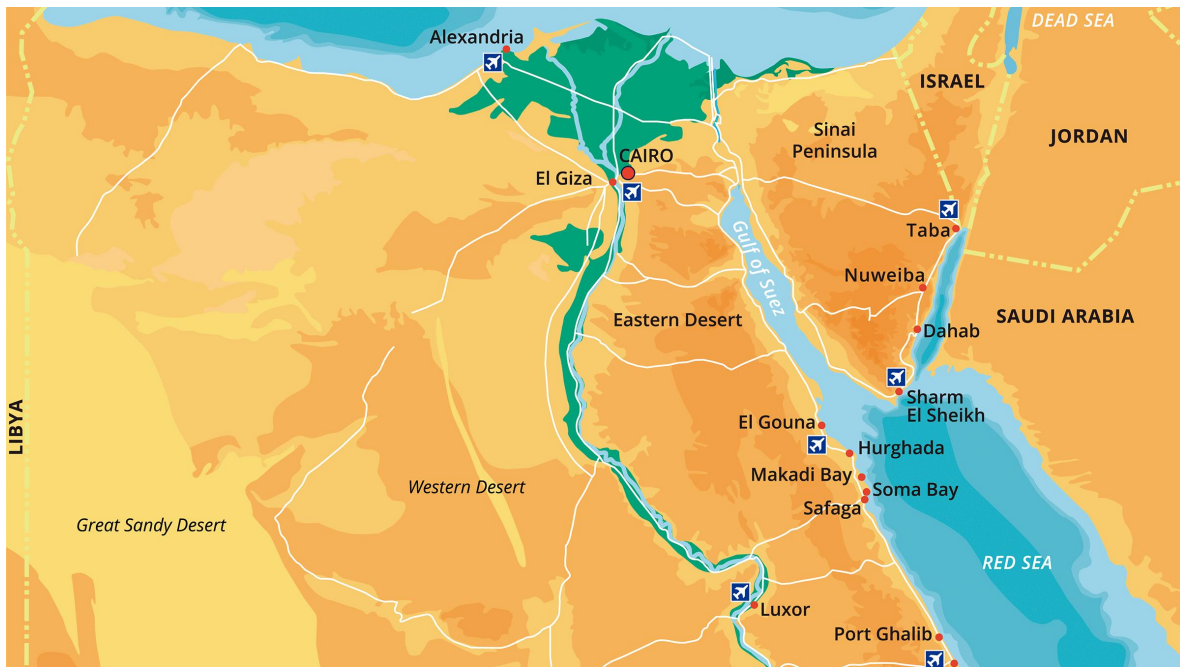
La península del Sinaí se encuentra en la margen derecha del golfo de Suez y del canal homónimo.

Desde febrero de 2018, cuando el presidente egipcio Abdel Fattah al-Sisi, ordenó movilizar miles de efectivos militares y de las fuerzas de seguridad, en lo que se conoce como Operación Sinaí, contra la organización terrorista Wilāyat Sinaí (provincia del Sinaí), el mundo dejó de tener noticias de qué pasa en una región que tiene poco menos que el tamaño de Irlanda, y una población cercana al millón y medio de personas. El ex general al-Sisi, el hombre al que nada menos que el presidente estadounidense Donald Trump llama: “Mi dictador favorito” , ha decidido esconder esa guerra que se disputa tanto en el desierto y las montañas, como en las ciudades y aldeas, con resultado incierto respecto a los costos de los civiles, puestos a resistir en soledad entre los dos fuegos. Ahora, que se preanuncia el final, será la hora de contar las bajas de los inocentes y también y el modo en que se libró esa guerra,