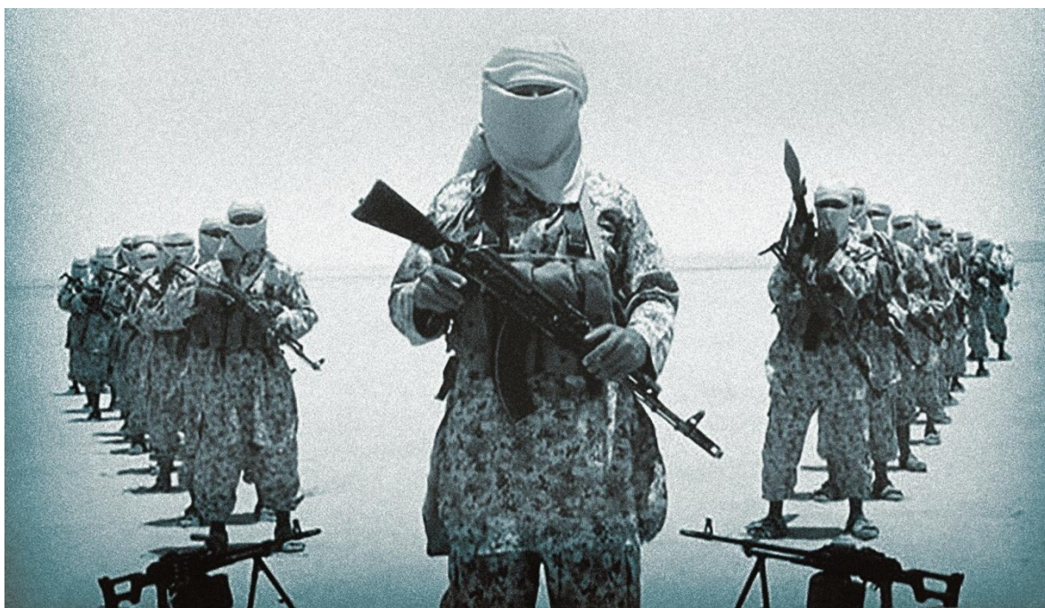
Como una hydra que no muere a pesar de cortarle varias cabezas, Al-Qaeda continúa activa.

Como era previsible, frente a la pandemia y muy posible debilitamiento de los sistemas antiterroristas juntos a los esfuerzos de la gran mayoría de las naciones para enfrentar al Covid-19, organizaciones terroristas como al-Qaeda y Daesh, al igual que lo hacen los neofascistas europeos, han empezado a alentar a sus socios, células dormidas y lobos solitarios a activarse para golpear a “cruzados” judíos y los propios musulmanes, la enorme mayoría, que no comulgan con el ideario wahabita, aprovechando lo que se podría englobar en una de las últimas declaraciones de la comandancia de al-Qaeda, que ha afirmado que el virus es “un signo de la furia de Dios hacia la humanidad por sus pecados e incumplimiento de su mandato”.