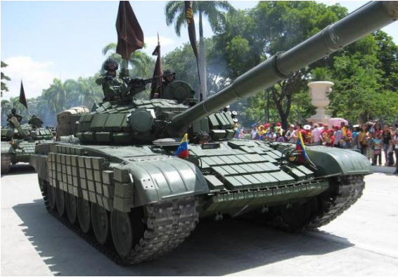
Tanque de origen ruso T-72B1 perteneciente al Ejército de Venezuela