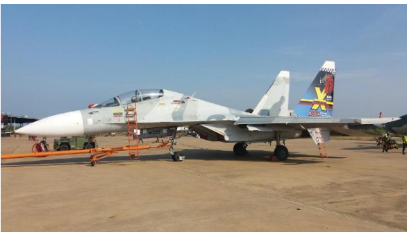
Cazabombardero Sukhoi Su-30MKII de la Aviación Militar Venezolana

Helicópteros: 10 de Ataque Mi35 M2 y 20 Transporte y asalto Mil-17.