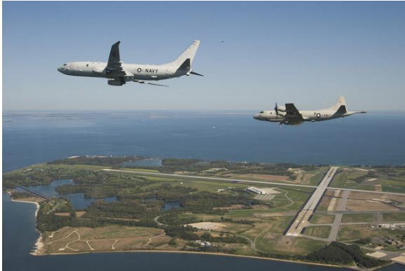
P-3 Orión y P-8

Es claro que Estados Unidos viene utilizando sus medios en el Caribe para recabar toda la información requerida para adelantar una operación de esta envergadura. Por eso ha destacado aviones P-3 Orión antibuque y antisubmarino, P-8 Orión de Reconocimiento Naval Guerra ASW y Antibuque, EP-3 Orión SIGINT, J-8 Stars para apoyo y gestión de batalla.