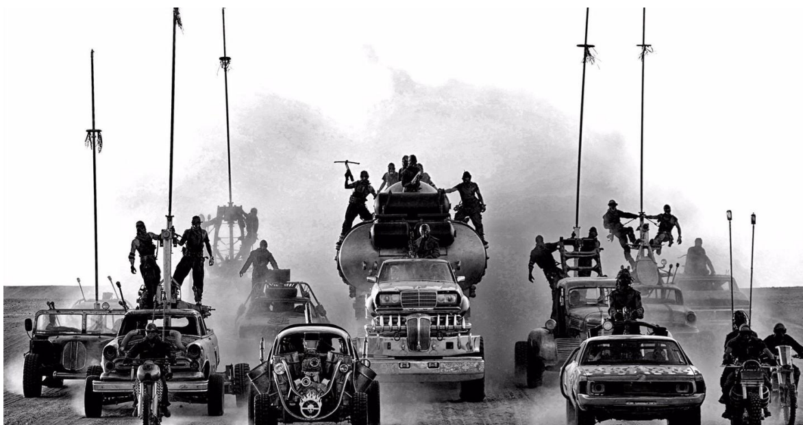
Imagen de la película post apocalíptica MadMax: Furia en la Carretera.

Desde siempre y por los esmerados esfuerzos del colonialismo, África está destinada a convertirse en la gran caja de resonancia de los dramas de la humanidad a nivel político, social, económico y fundamentalmente en cuestiones sanitarias. Siempre, absolutamente siempre, las tasas de enfermedades que han estremecido al mundo, en África, particularmente en África Subsahariana, repercuten todavía mucho más, quizás el SIDA haya sido el mejor ejemplo de esta aseveración, ya que tomó la característica de pandemia, como en ningún otro lugar del mundo, según datos de 2018, de la OMS (Organización Mundial de la Salud), el 66 por ciento de todos los infectados con SIDA viven en África lo que equivale a unos 25.7 millones de personas. Mientras que otras enfermedades, como el Ébola, Cólera, Gripe A, Tuberculosis y un largo etcétera, han hecho y siguen haciendo estragos en el continente, por lo que hay voces que ya están alertado sobre las consecuencias que tendrá la población de ese continente cuándo el Covid-19 dé de pleno. Hasta ahora, África registra solo 8 mil contagiados, 334 muertos y 702 personas que se han recuperado.