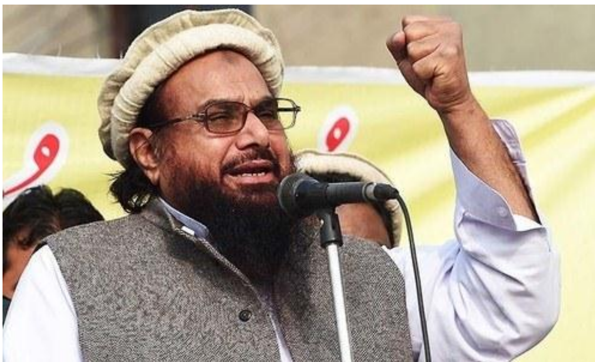
Hafiz Muhammad Saeed