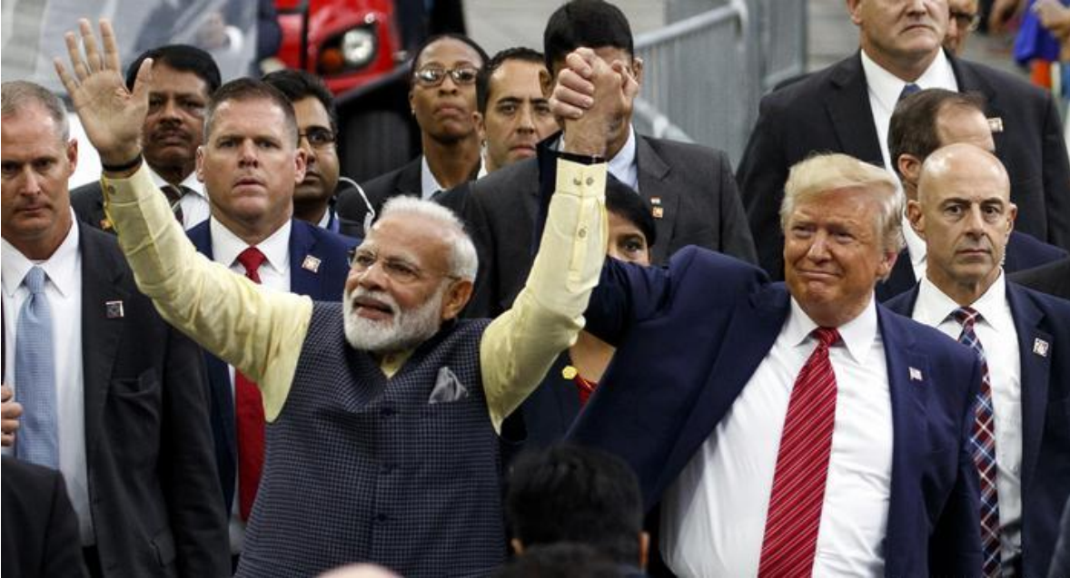
Narendra Modi con Donald Trump en la India.

El presidente norteamericano, Donald Trump, el martes 25 de febrero, concluyó su primera, breve y poco remunerativa visita a India, donde más de una gloriosa y sangrienta puesta en escena de su adlátere Narendra Modi, no hubo demasiados anuncios respecto a comercio, inversiones y sobre todo en seguridad, tema en que ambos jefes de estado son más que almas gemelas. El presidente norteamericano logró la venta de 24 helicópteros Seahawk MH-60R de uso múltiples y seis de ataque AH-64E para la marina y el ejército indio, por unos tres mil millones de dólares. Los negocios de Trump en India, apuntan a confirmar el importante repunte que han tenido las ventas de armamento al país asiático que aumentó sus adquisiciones de productos estadounidenses en el campo de la defensa de casi nulas en 2008 a un total de casi 23 mil millones de dólares en 2019.