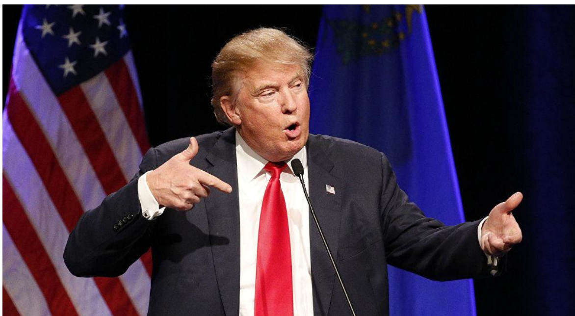
Donald Trump, presidente de los Estados Unidos de América

Desde la Convención de La Haya de 1907, quedó establecida en la ley de “Conflictos Armados” ampliamente aceptados por todas las naciones civilizadas firmantes, la “prohibición de asesinar funcionarios del gobierno extranjero fuera del tiempo de guerra”. La decisión del presidente norteamericano Donald Trump, de asesinar al General iraní y comandante de su cuerpo de elite al-Quds, Qassem Suleimani, (Ver: Qassem Suleimani ¿quién detendrá a la muerte?) no solo se llevó por delante esa normativa, sino que inmediatamente Trump se jactó, por twitter de su decisión: “El general Qassem Suleimani que ha asesinado o herido gravemente a miles de estadounidenses durante un largo tiempo, y estaba conspirando para matar a muchos más... ¡pero fue atrapado! Él fue directa e indirectamente responsable de la muerte de millones de personas, incluido el gran número de manifestantes recientemente en Irán” y el párrafo sigue insustancial, y fabulando para justificar lo que a todas luces ha