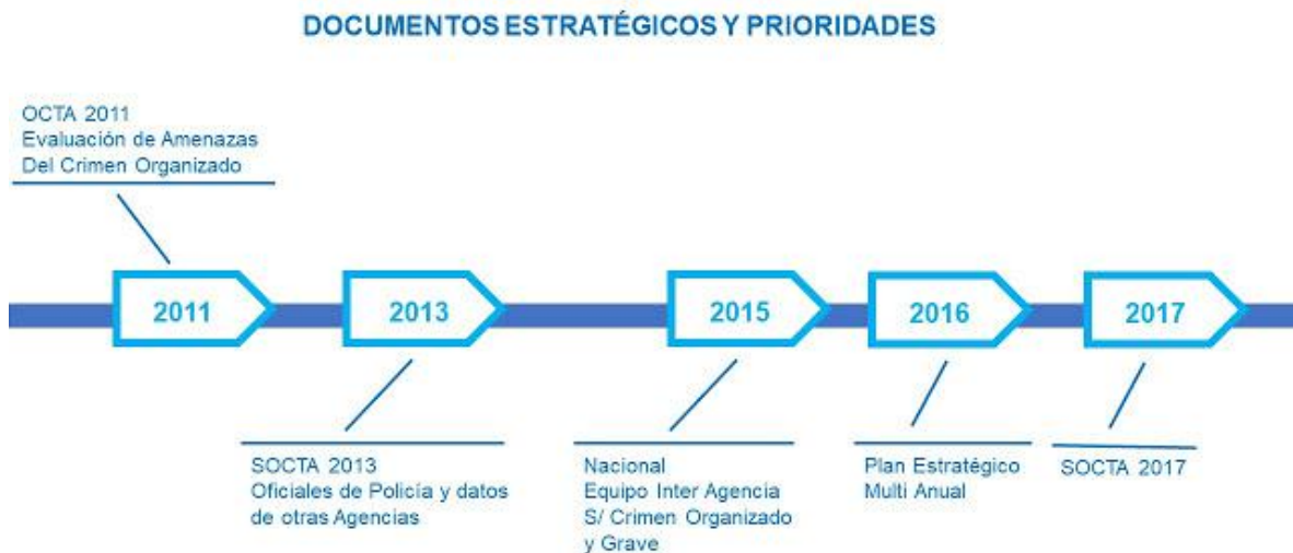
Figura 2 SOCTA Desarrollo y planificación estratégica en Montenegro

Como se explica en la Figura 2, SOCTA MNE cubre el período de cuatro años y es desarrollado por un equipo interinstitucional compuesto por representantes del sector de inteligencia y seguridad montenegrino.