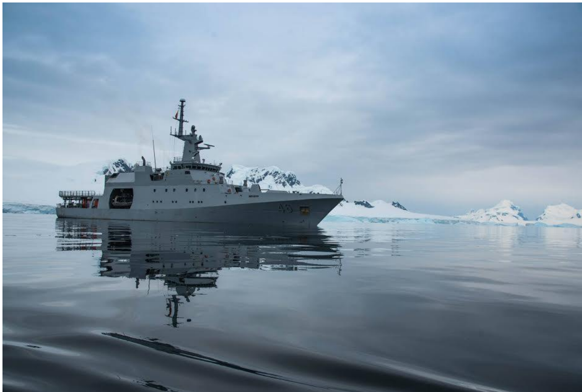
Patrullero tipo OPV-80, ARC “20 de Julio” de la Armada Nacional de Colombia, en la Antártida.

El ARC “20 de Julio” en su momento fue el buque más complejo y más grande que se haya construido en Colombia. Se incorporó a la Armada Nacional como un orgulloso ejemplo del nivel de desarrollo tecnológico que había alcanzado la industria naval del país. Fue construido en COTECMAR con los más altos estándares de calidad, seguridad, flexibilidad operacional, y conceptos de maquinaria no asistida. A partir de allí, Colombia entró en el reducido grupo de países con capacidad de fabricar sus propios buques marítimos.