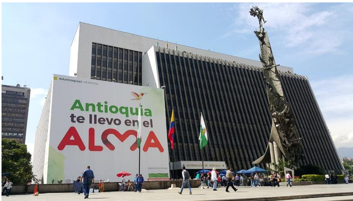
Centro Administrativo Departamental - CAD, sede de la gobernación de Antioquia.

Por Julián David Urrego Atehortúa (Colombia)