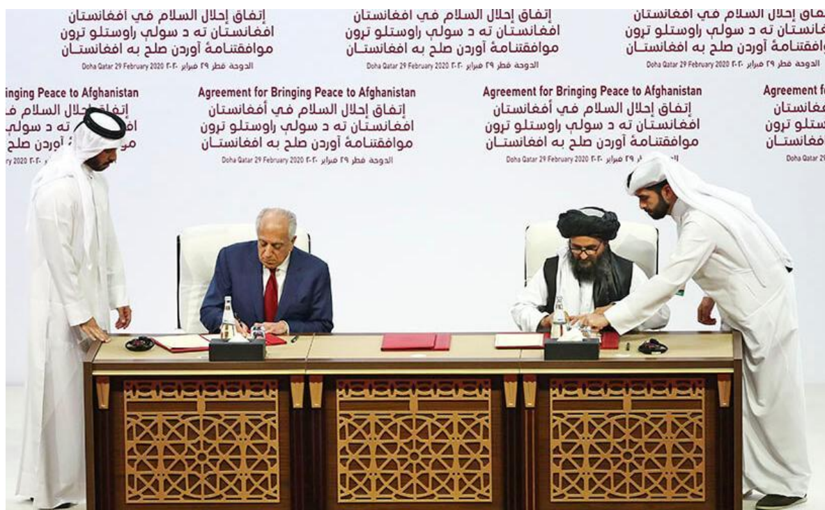
Firma del acuerdo de paz entre el gobierno de los Estados Unidos y los Talibanes. Mullah Abdul Ghani Baradar, líder de la delegación talibán; y Zalmay Khalilzad, enviado de EEUU

Finalmente, Estados Unidos logró un acuerdo de paz con el Talibán, después de un muy largo y convulso año de reuniones en Qatar y casi veinte de guerra. En un acto protocolar realizado en Doha, la capital qatari, el pasado sábado 29 de febrero, con la presencia del Secretario de Estado norteamericano, Mike Pompeo, y el segundo en la escala de mandos de la organización insurgente el mullah Abdul Ghani Baradar, los que en discursos para la ocasión se dirigieron a una importante cantidad de representantes de gobiernos extranjeros como Noruega, Turquía, Uzbekistán, Rusia, Indonesia y otras naciones vecinas que daban marco, a un acuerdo de extrema dificultad para cumplir.