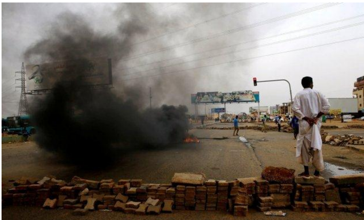
La violencia y la represión se han apoderado de las calles de Sudán.

A pocos días de la matanza de Jartum, Sudán se precipita al fin de la primavera que comenzó con la caída de Omar al-Bashir el pasado abril. El Consejo Militar de Transición (CMT) con la excusa de acelerar la transición rumbo a las elecciones generales, que se “producirán” dentro de nueve meses según anunció el general Abdel Fattah al-Burhan, que ha descartado los acuerdos alcanzados con el principal bloque opositor, las Fuerzas de Libertad y Cambio (FFC).