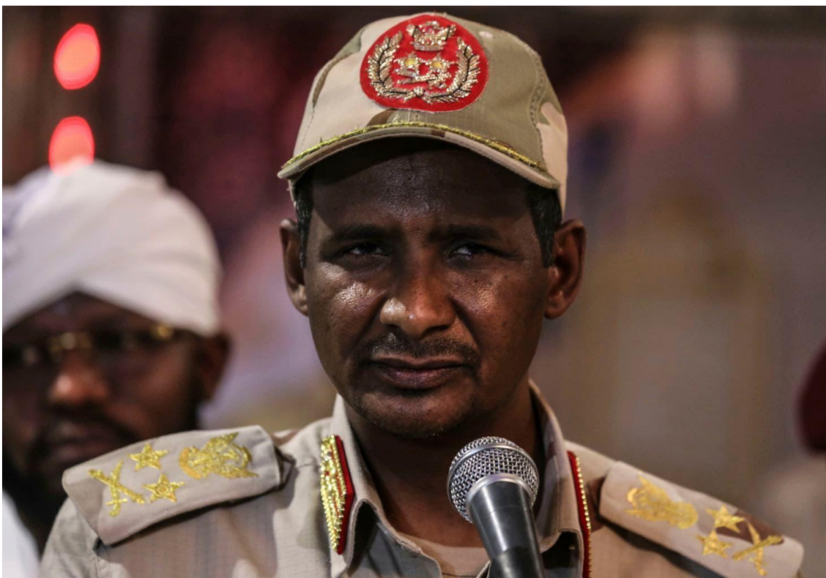
General Mohamed Hamdan Dagalo.

Tras las protestas que comenzaron en diciembre pasado y eclosionaron en abril, todo había cerrado bastante bien en Sudán, para los miles de manifestantes que se habían congregado en Jartum, y en muchas otras ciudades y pueblos del país, exigiendo la renuncia de Omar al-Bashir, el autócrata que gobernó el país durante 30 años (Ver: Sudán, entre la primavera y el abismo.)