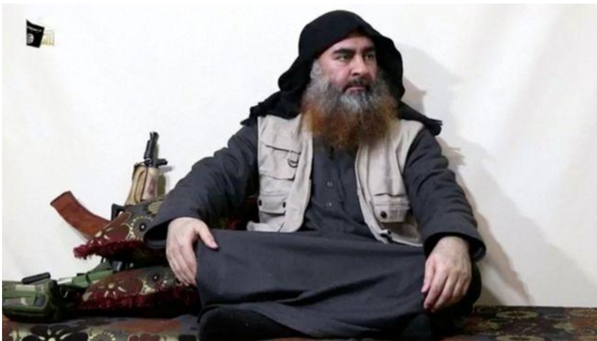
Abu Bakr al-Bagdadí

En los últimos días de abril, después de cinco años reapareció en un video el líder del Daesh , Abu Bakr al-Baghdadi o el Califa Ibrahim, difundido por un órgano propagandístico de la organización fundamentalista, al-Furqan , (El Criterio) en referencia a la sura 25 del Corán.