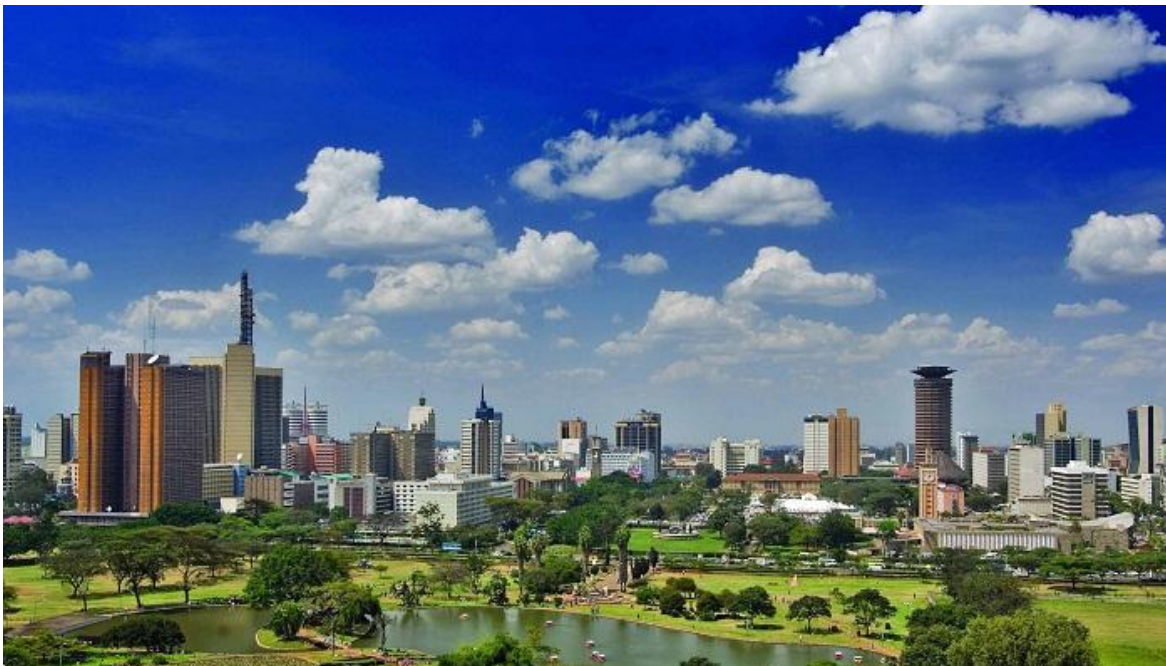
Panorámica de la ciudad de Nairobi.

En pleno centro de la ciudad de Nairobi, capital de Kenia, en el cotizado distrito de Westlands, la tarde del martes 15 de enero, un número indeterminado de muyahidines de la organización integrista somalí al-Shabaab , irrumpieron en el complejo inmobiliario de 14 Riverside Drive que incluye el hotel de lujo DusitD2 , del grupo tailandés Dusit Thani, restaurantes, un spa y varios edificios de oficinas que albergan varias empresas internacionales como Dow Chemical y Reckitt Benckiser , BASF , Colgate Palmolive , y Pernod Ricard , entre otras mientras que el edificio de la embajada de Australia se encuentra al otro lado de la calle.