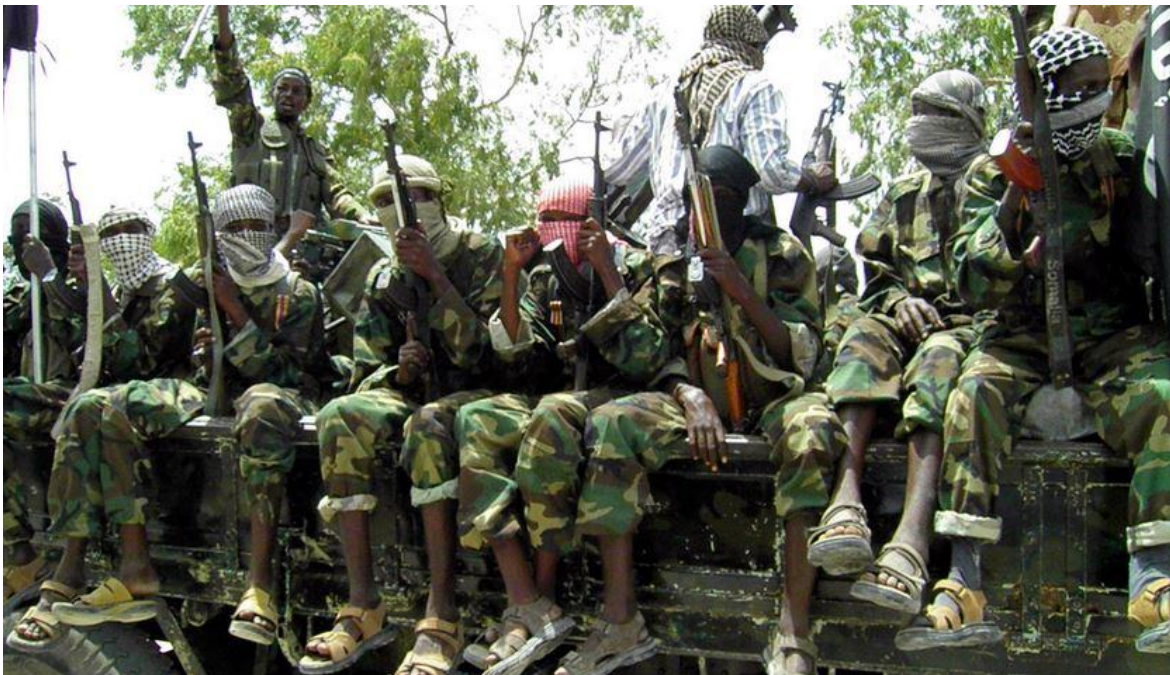
Combatientes del grupo terrorista Boko Haram

Boko Haram mantuvo hasta principios de 2015, en el noreste del país, un territorio del tamaño de Bélgica, pero desde que el presidente Muhammadu Buhari, asumió su cargo, en cumplimiento de su promesa de campaña de exterminar la guerrilla fundamentalista, que desde 2009 se ha convertido no solo en la pesadilla de los nigerianos sino también de muchos de sus vecinos. Para ello Buhari, ha puesto en marcha la Operación Lafiya Dole , desde mayo de 2016, ha conseguido desalojar gran parte de ese territorio. Reconquistado a sangre y fuego, por las tropas de Ejército nigeriano, y la Fuerza Multinacional Conjunta o MJTF (Chad, Camerún, y Níger), esta guerra no ha sido siempre limpia y son numerosas las denuncias acerca de violaciones a los Derechos Humanos. Más allá de las acciones por parte de los ejércitos regulares, los 26 mil hombres de la Fuerza de Tarea Conjunta Civil (FTCC) y los Comités Civiles de Vigilancia (CCV) grupos de autodefensas de vecinos, mal entrenados y peor armados, que su improvisación los ha llevado a cometer varios asesinatos de inocentes, mientras que los regulares han sido denunciados por ejecuciones sumarias, secuestros y torturas, cayendo en muchas oportunidades en los excesos de toda guerra sucia, como si alguna, alguna vez hubiera sido limpia.