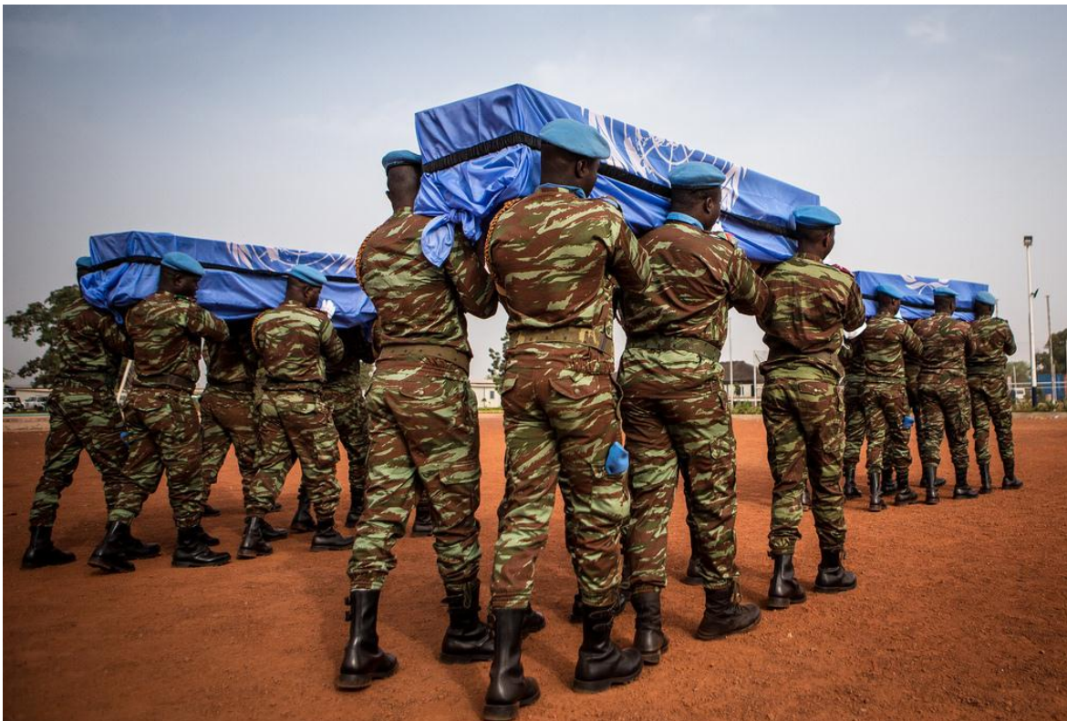
Tropas de la MINUSMA conducen a tres compañeros chadianos caídos en acción en octubre de 2017

El domingo 20 de enero, comandos de la banda alqadeana Jamaât Nasr al islam wa al-mouminin (Grupo para la Defensa del Islam y los musulmanes) atacaron uno de los campamentos de la Misión Multidimensional Integrada de Estabilización de las Naciones Unidas en Malí (MINUSMA) que cuenta con una dotación de 15 mil efectivos pertenecientes a una veintena de países, la mayoría dispuestos en diferentes bases en el norte del país, desde 2013, que junto a los hombres de la Operación Barkhane (2014) compuesta por 3 mil efectivos franceses y un número indeterminado de tropas norteamericanas y mercenarios occidentales, tratan de contener las acciones de los muyahidines , que no solo operan en Mali, sino expanden su presencia a Mauritania, Argelia, Costa de Marfil, Burkina Faso, Chad y Níger. La presencia de las tropas pro occidentales en el norte del país se fundamenta, sobre todo, por los importantes yacimientos de uranio, explotados por Francia y vitales para el sistema energético del país europeo.