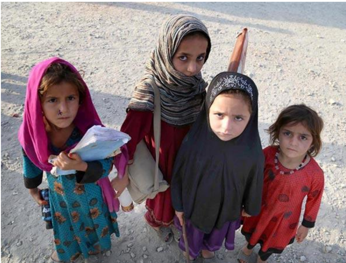
Niñas afganas en edad escolar, tienen dificultades para acceder al sistema educativo. Mientras, los adultos luchan por el poder y juegan a la guerra.

El pasado verano, la Comisión Electoral Independiente Afgana (IEC) anunciaba que la fecha elegida para celebrar las elecciones presidenciales en el país asiático era la del 20 de abril de 2019. Dicho organismo, se encuentra ya trabajando en la preparación de los próximos comicios parlamentarios que van a tener lugar en poco más de un mes, el próximo 20 de octubre, para el que ya se han registrado más de 9 millones de afganos. En la jornada electoral, se deciden los miembros a formar parte de la Wolesi Jirga (transliteración en pastún que significa "Cámara del Pueblo"). La elección ya se ha pospuesto hasta en dos ocasiones; en un primer momento estaba previsto que tuviera lugar en octubre de 2016 para después moverlas de fecha a julio de este año. Todo ello, se produce en un clima de inestabilidad y violencia sin precedentes desde la caída del régimen talibán, controlando este último grupo insurgente más del 10% del territorio del país y disputándose al mismo tiempo con el gobierno prácticamente otro 40%. Los talibanes se sienten fuertes y ello ha precipitado hechos tales como la constante negativa a aceptar diferentes treguas y ofertas del gobierno de Ashraf Ghani proponiendo a cambio sentarse a negociar directamente con representantes de la administración norteamericana. Dicha delegación estaría encabezada por el jefe de la oficina política que los talibanes tienen en Qatar, Sher Mohamad Abbas Stanikzai, hombre al parecer próximo a los servicios secretos pakistaníes (ISI).