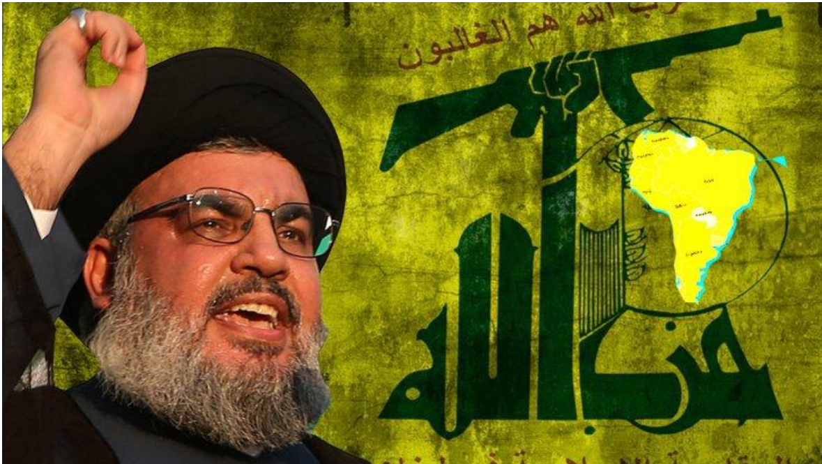
Hassan Nasrallah, líder de Hezbolá, el "Partido de Dios"

Ninguna información confiable demostró que Hezbolá u otros grupos extremistas islámicos tengan células operativas o usen la región de la Triple Frontera para entrenamiento de terroristas. No obstante existen simpatizantes ideológicos, tráfico de armas y personas, drogas, lavado de dinero y falsificaciones, que podrían ser utilizados como fuente de financiamiento para grupos terroristas.