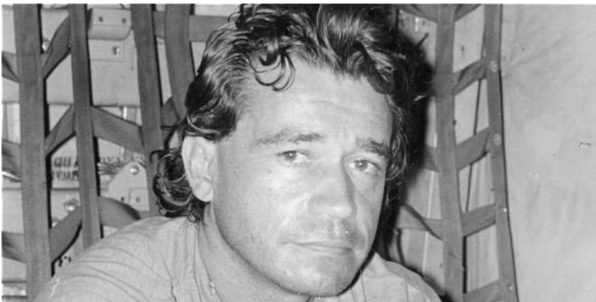
Carlos Ledher, el primer narcotraficante colombiano extraditado a los Estados Unidos. En la fotografía, recién capturado va a bordo de un avión de la Fuerza Aérea Colombiana.