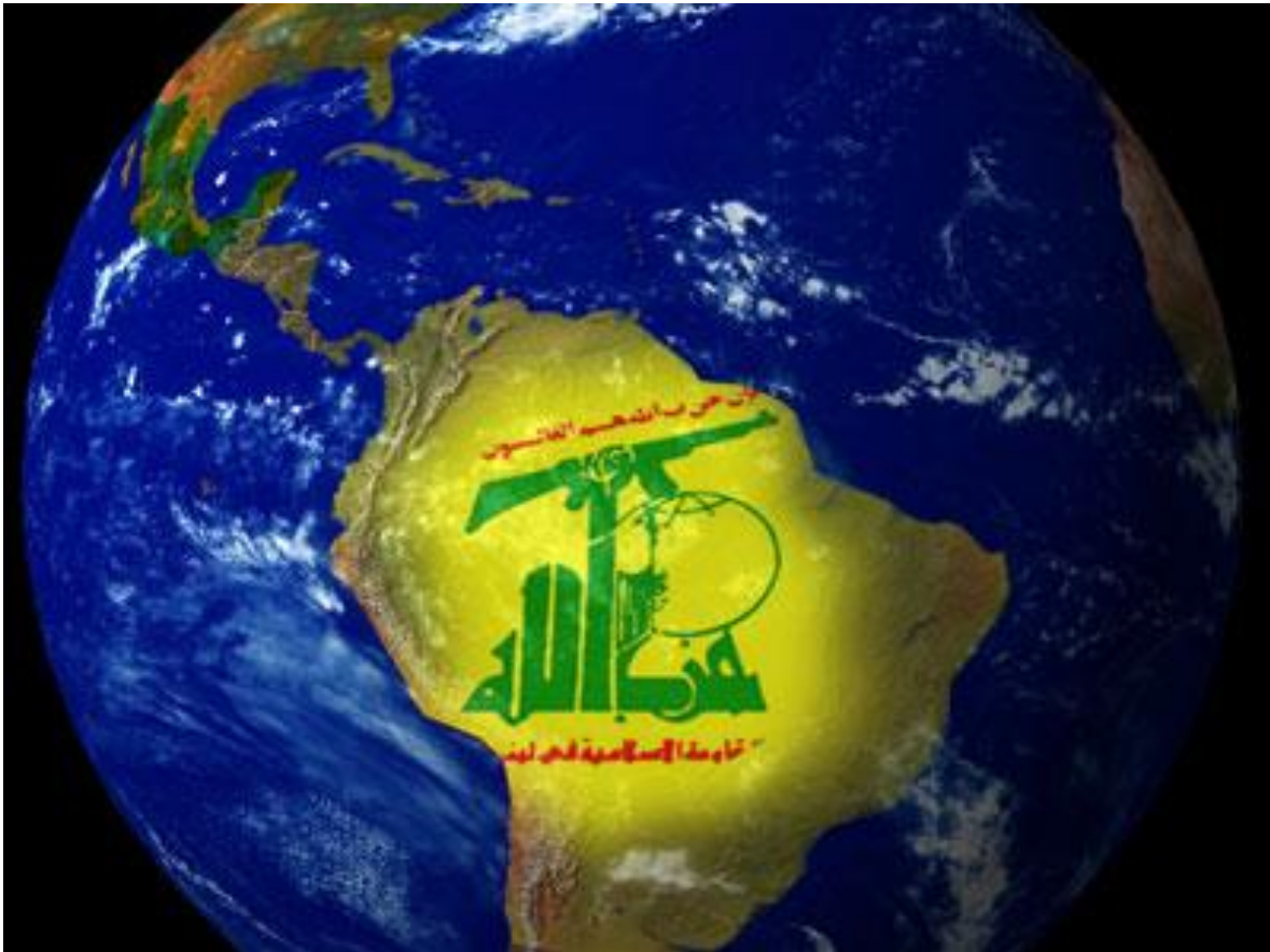
Hay evidencias suficientes para afirmar que efectivamente Hezbolá opera en América Latina.

Las actividades de Hezbolá en América Latina tendrían como principal objetivo, obtener fuentes de financiamiento y desarrollar acciones encubiertas, como parte de un plan general, más allá de la frontera del Líbano, para sus redes logísticas de apoyo y sus operaciones criminales y terroristas en todo el mundo, a diferencia del rol que desempeñarían en Estados Unidos, donde el gobierno de Donald Trump, está dispuesto a pagar 7 y 5 millones de dólares por Talal Hamiyeh y Fu'ad Shukr, sospechosos de estar planeando un atentado terrorista, a corto o mediano plazo en Norteamérica. Hezbolá para ejecutar sus atentados utiliza la "Unidad 910", de Inteligencia para Operaciones Externas. Operan en secreto y al amparo de identidades falsas no libanesas.