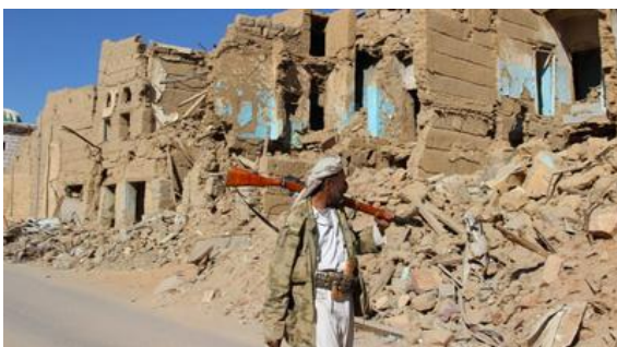
La devastación es general, quien más sufre es la población civil. Víctima de la guerra, el hambre y las enfermedades.

Hace unos días, en un discurso ante el Consejo de Seguridad en Nueva York, el representante especial de la ONU en Yemen, Ismail Uld Sheij Ahmed, pidió un cese de la guerra en Yemen, afirmando estar trabajando en "medidas" encaminadas a facilitar las negociaciones de paz.