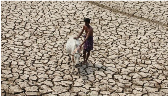
La sequía y la desertización son fenómenos que avanzan en todo el mundo.

son solo hipotéticos. Existen casos documentados desde el año 1000 a.C. cuando los guerreros chinos contaminaban los suministros de agua de sus enemigos con arsénico.