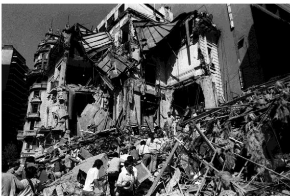
Atentado a la Embajada de Israel en Argentina en 1992 (29 muertos).