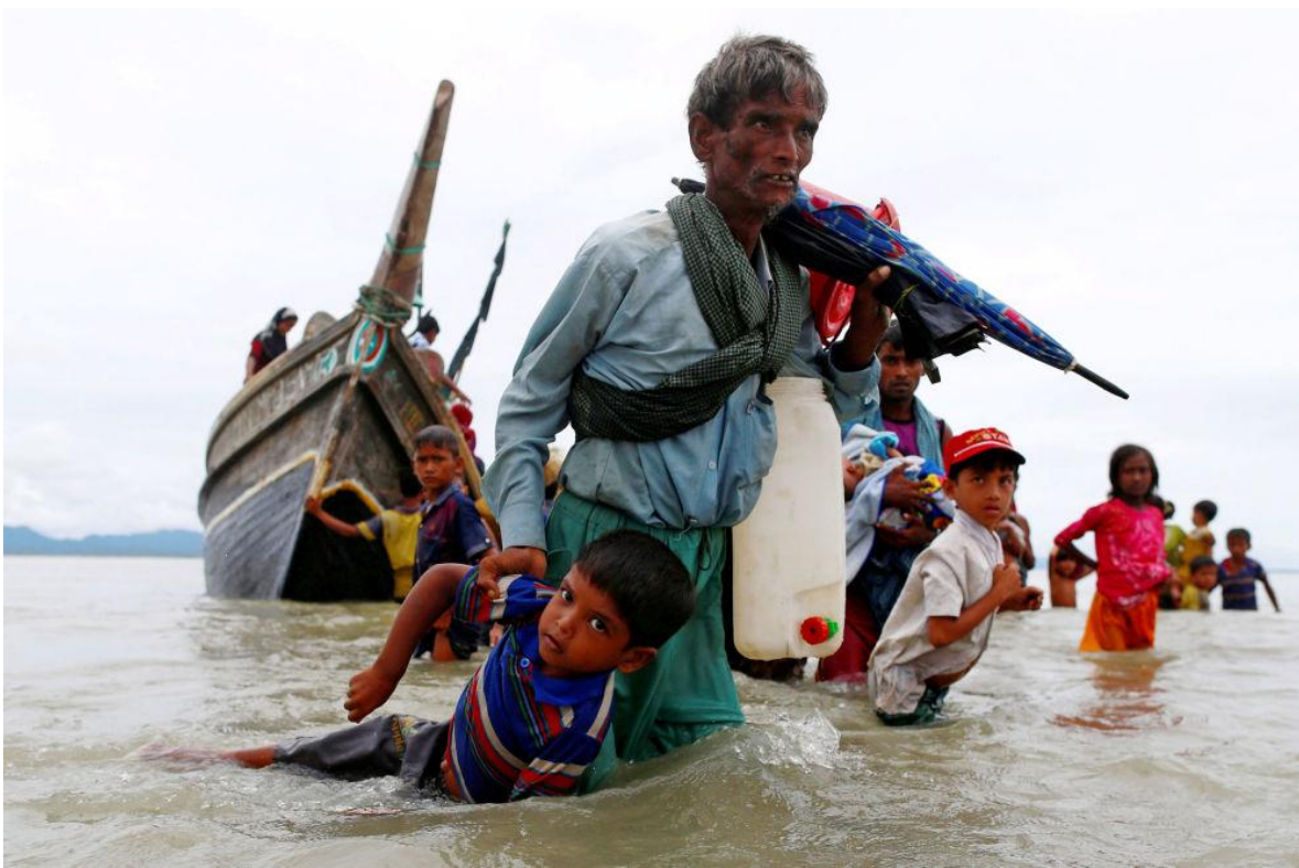
Rohinyá saca a un niño del agua después de cruzar la frontera con Bangladés a través de la bahía de Bengala. El drama humano que involucra este conflicto es tremendo.