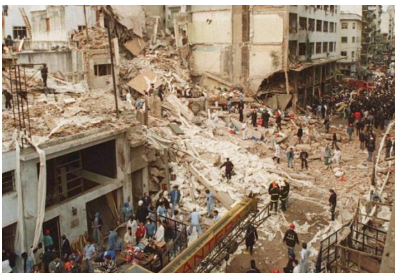
Atentado a la Asociación Mutual Israelita Argentina en 1994 (85 muertos).