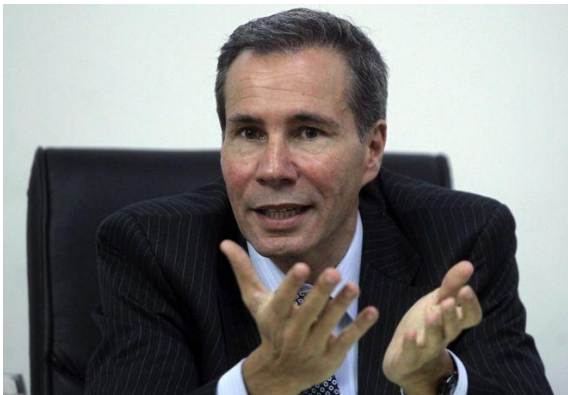
Fiscal Alberto Nisman. Fallecido.