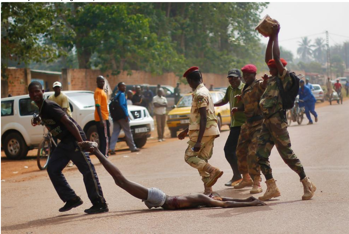
Imágenes de la violencia vivida en Sierra Leona.

Si retrocedemos un poco en el tiempo podremos recordar como en los años 80 y 90 el RUF (Frente de Unión Revolucionario de Sierra Leona) en el continente africano comandado en ese entonces por Foday Sankoh, realizaban ataques brutales contra civiles y financiaban todo su ejército revolucionario y armas a través del contrabando ilegal de los diamantes recogidos en Sierra Leona a través de la esclavitud que luego eran comprados y comercializados al público sin que la gente supiese todo lo que llevaba a trasfondo de cada piedra, lo que luego se conoció como los “diamantes de sangre” debido a la cantidad de familias esclavizadas a recoger este material con medios inducidos como la tortura y la muerte.