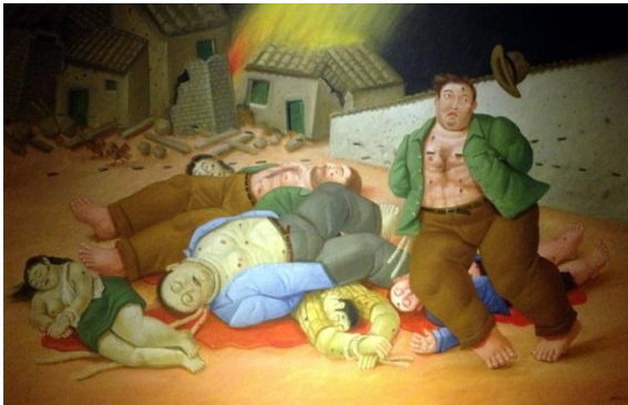
Pintura La Violencia de Fernando Botero,

A principios del siglo XIX Colombia vivió el conflicto entre patriotas -partidarios de la independencia y de los gobiernos democráticos-, y los realistas -partidarios de la defensa del rey y de las instituciones coloniales que existían en ese momento-. Lograda la independencia de España surgió otro conflicto entre quienes preferían un régimen político centralista y quienes preferían un modelo federalista; luego se enfrentaron los proteccionistas y los librecambistas, e incluso también los bolivarianos y los santanderistas. Fue fácil encontrar motivos para matarse unos a otros.