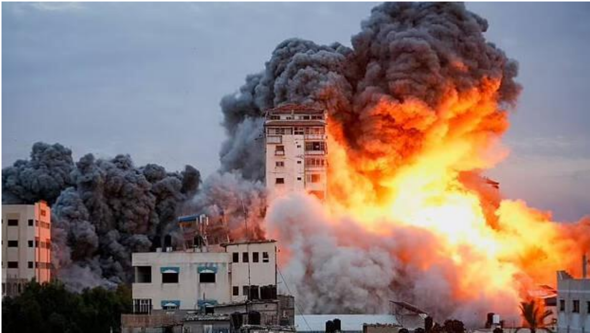
Israel bombardea a placer, sin considerar al a población civil.

A un mes de la Operación Diluvio de al-Aqsa, del grupo Hamas, acróstico, de Harakat al-Muqáwama al-Islamiya (Movimiento de Resistencia Islámica), hecha a medida de las necesidades políticas del Primer Ministro sionista Benjamín Netanyahu, los gobiernos del mundo siguen sin reaccionar frente a la barbarie, ejecutada contra el pueblo palestino, que ya ha pagado con más de diez mil muertes, las acciones del pasado siete de octubre.