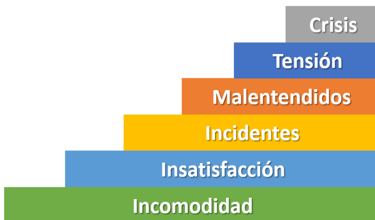
Figura 2. Fases del Conflicto. Escalamiento.

Los conflictos que no se tramitan apropiadamente, escalan en intensidad, generando dinámicas perjudiciales para todos los actores. En la figura 2 podemos apreciar las distintas fases por las que atraviesa un conflicto, cada una de ellas tiene sus particularidades, características que deben ser tenidas en cuenta a la hora de hacer una intervención en procura de una solución. Ojalá mucho antes de que la situación degenera en una crisis.