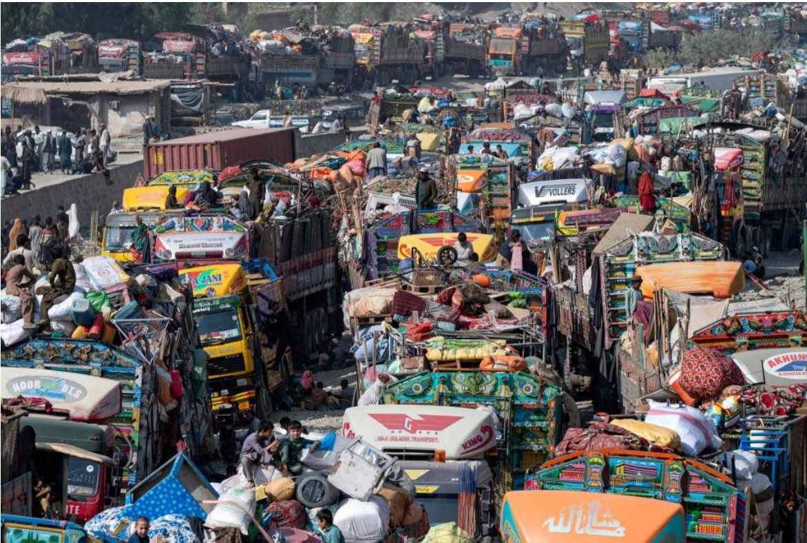
Exodo masivo de afganos (indocumentados), abandonando Pakistán por orden del gobierno de ese país.

Conocido el Plan de Repatriación de Extranjeros Ilegales del Ministerio del Interior de Pakistán, del 26 de septiembre de este año, a principios de octubre se puso en marcha una operación de búsqueda y expulsión, objetivada fundamentalmente en los indocumentados afganos, estimados en casi cuatro millones de indocumentados, que, a lo largo de casi cincuenta años de guerra en su país, en distintas oleadas buscaron refugio en sus vecinos del sur. Con esta medida, Islamabad, ignora la legislación internacional y recomendaciones de Naciones Unidas, respecto al trato a los refugiados.