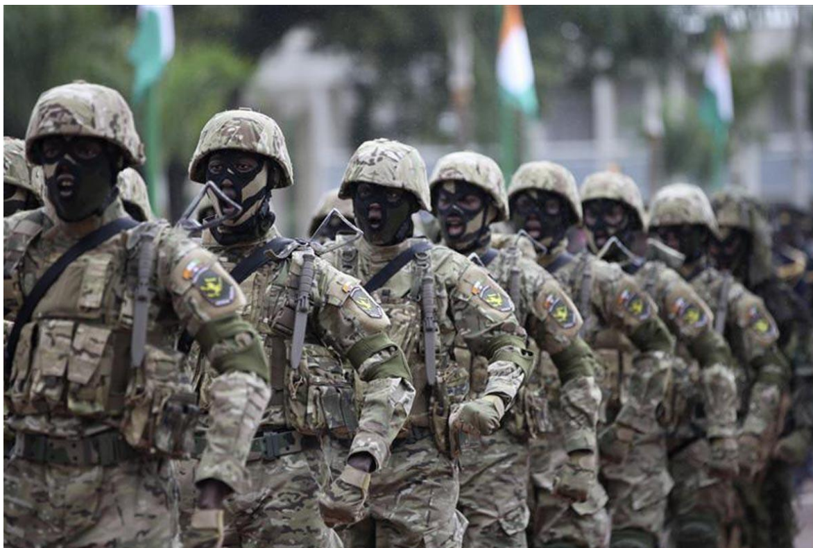
Fuerzas Especiales de Costa de Marfil

República de Costa de Marfil (République de Côte d'Ivoire)