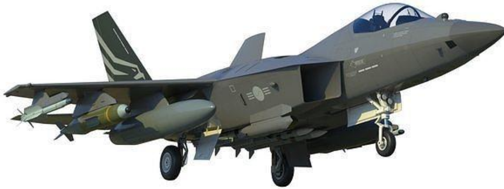
KF-21 Boramae, diseñado y producido por Corea del Sur.

El KF-21 fue capaz de alcanzar la velocidad supersónica sin postcombustión gracias a su función de Supercrucero (capacidad de un avión para mantener el vuelo supersónico, a plena carga, de forma eficiente y sin usar postquemadores). Gracias a esta función, los aviones de combate pueden alcanzar velocidades supersónicas con un bajo consumo de combustible. De hecho, pese a que no se trata de un avión de quinta generación, dispone de esta ventaja de la que carecen, por ejemplo, el F-35 estadounidense o el Su-57 ruso, aunque sí el J-20 chino, tercer caza furtivo existente. El F-22, el interceptor más avanzado del mundo, sí que tiene esa capacidad supercrucero, pero se dejó de fabricar a principios de la pasada década. En el caso del Eurofighter Typhoon, como el que opera el Ejército del Aire, que se podría situar en una categoría definible como de “cuarta generación y media”, sus dos motores gemelos Eurojet EJ2000 le permiten alcanzar una velocidad punta de Mach 2 a gran altura y sí dispone de función supercrucero.