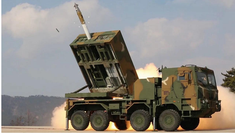
Sistema Lanzamisiles K239 Chunmoo, de diseño y fabricación surcoreana.

ambos sistemas se pueden complementar. También puede disparar misiles de 239 mm, capaces de alcanzar objetivos a una distancia de hasta 85 kilómetros con guiado GPS o inercial; o misiles tácticos Ure-2 de 600 mm, análogo al estadounidense ATACMS, con hasta 290 kilómetros de alcance.