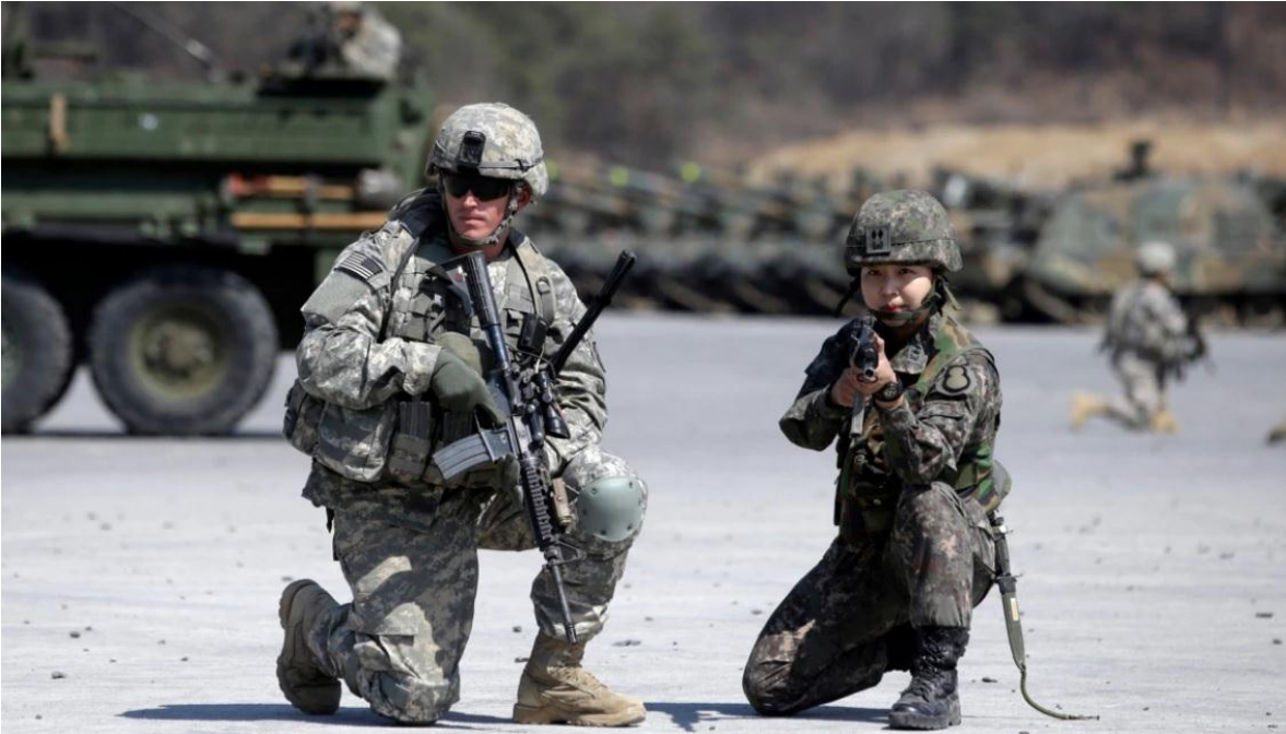
Los entrenamientos conjuntos entre las Fuerzas Armadas de Estados Unidos y los de Corea del Sur, son una constante.