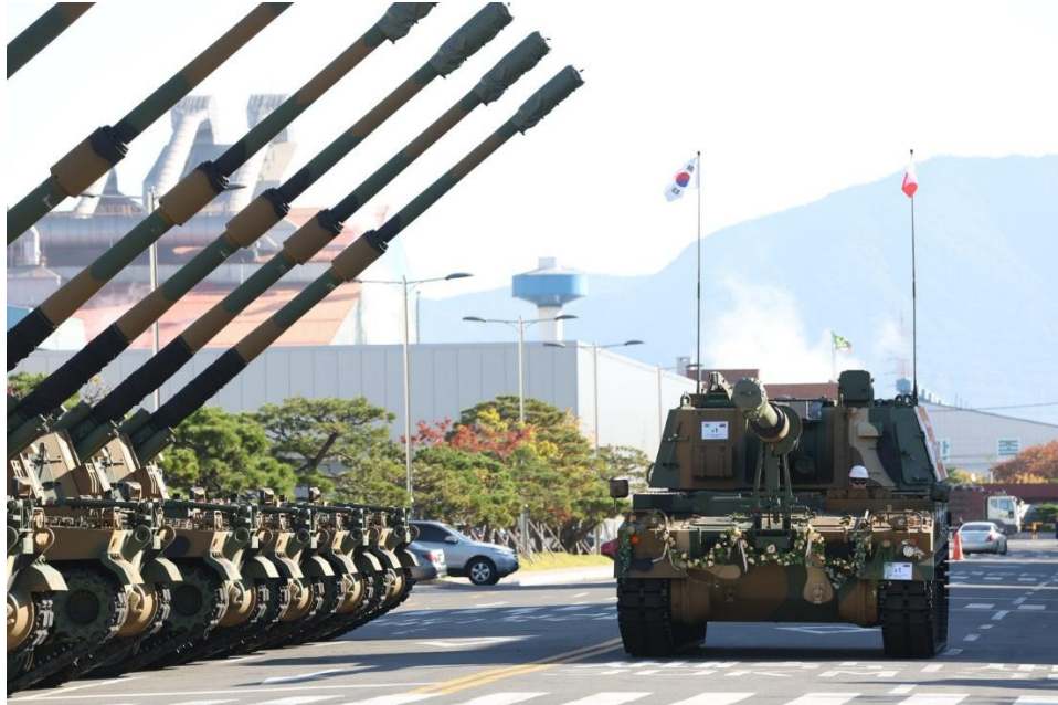
Obuses autopropulsados K9 Thunder, diseñados y producidos por Corea del Sur.

Esta compra se complementaría con otra firmada con Corea del Sur para recibir 648 obuses autopropulsados, material también de Hanwha Defense, del cual ya han recibido las primeras unidades y del que a partir de 2026 llegarán los que serán fabricados localmente.