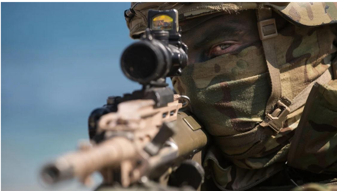
Fuerzas Especiales de Corea del Sur.

Por último, otro factor importante es la relación calidad/precio de sus productos, más baratos que sus competidores en muchos casos sin menoscabo de sus prestaciones. Así, encontramos productos como el carro de combate K2 o el caza KF-21 Boramae, que compiten de tú a tú con sus rivales estadounidenses o rusos, pero a precios mucho más reducidos y con plazos de entrega más cortos.