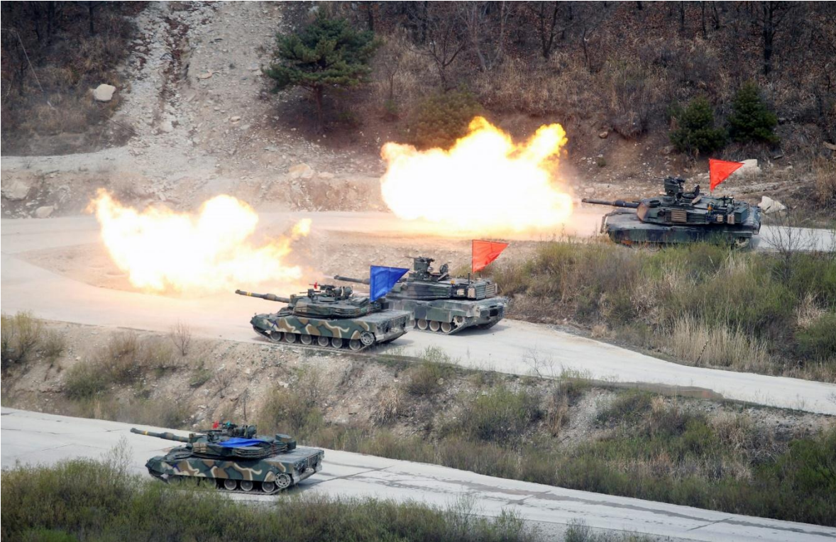
Corea del Sur realiza varios ejercicios anuales con munición real y despliegues a zonas sensibles en caso de invasión por las tropas del norte.

Estos retos han llevado a que el gasto en defensa del país haya sido siempre elevado, situándose la media en los últimos sesenta años cerca del 4%, más del triple de lo que gasta, por ejemplo, España, y el doble de lo que la OTAN se ha marcado como objetivo (2%) para sus socios y que casi nadie cumple, excepción hecha de Grecia, Estados Unidos, Lituania, Polonia, Reino Unido, Estonia y Letonia, no llegando ninguno de estos países al 4%.