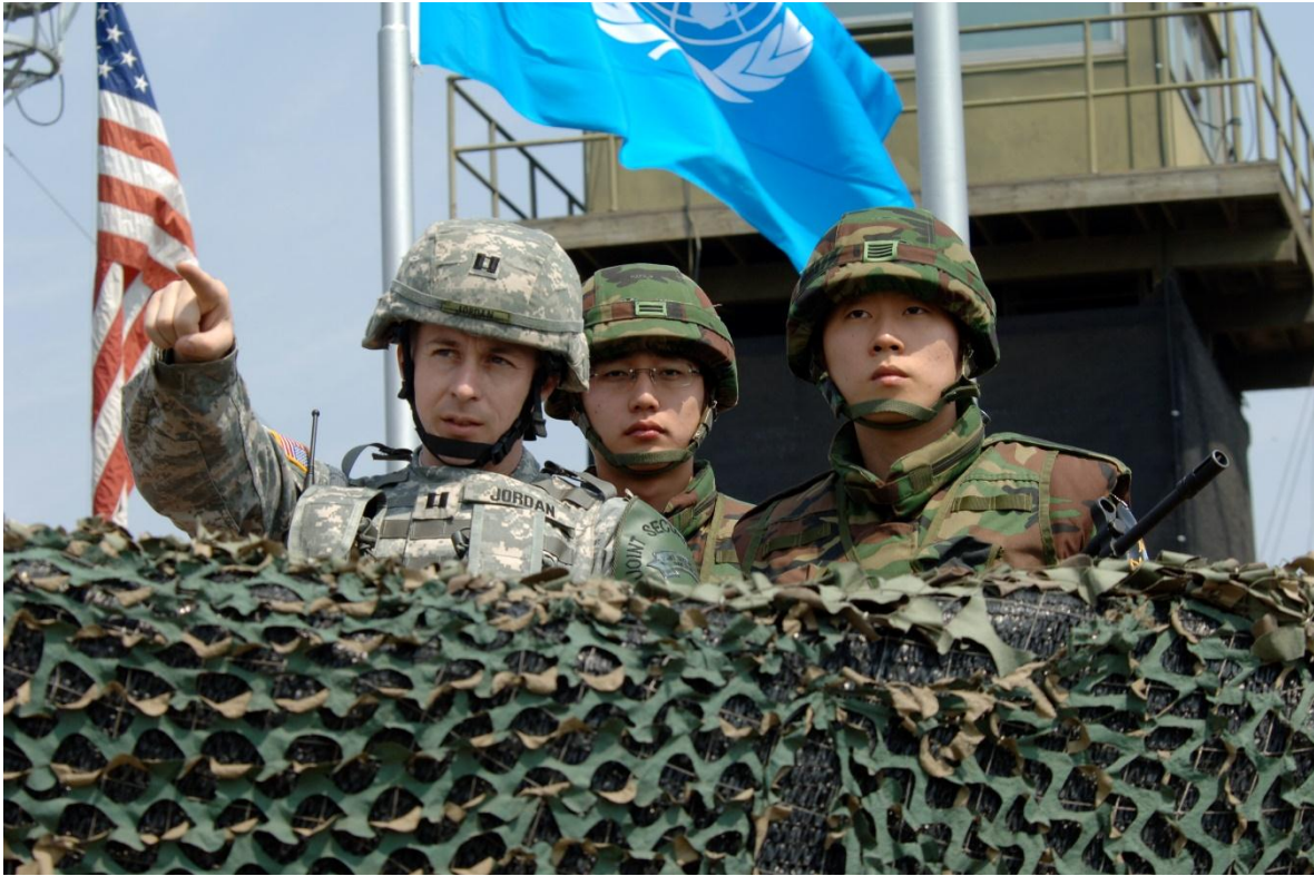
El apoyo de los Estados Unidos de América a Corea del Sur, es permanente. Las tropas del Army están en posiciones avanzadas, codo a codo con las tropas de Corea del Sur.

responsables de muchos abusos contra la población civil, incluidas masacres y violaciones. El gobierno surcoreano no reconoce la existencia de esos presuntos abusos.