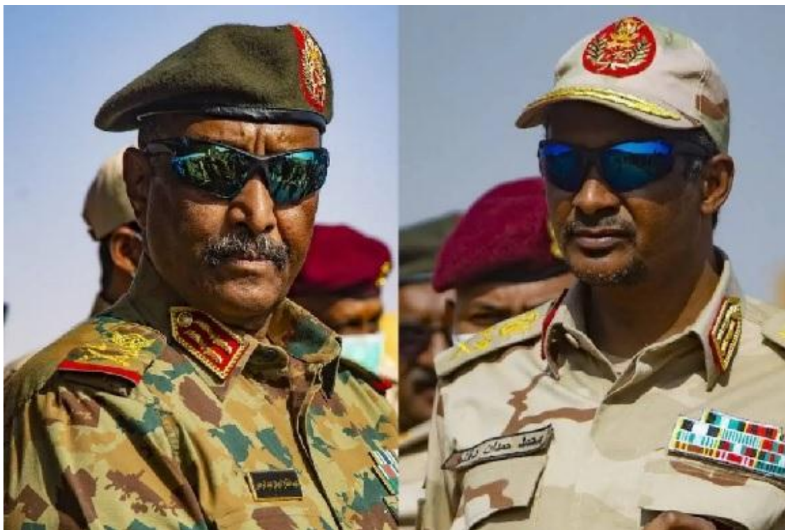
Los líderes de los bandos enfrentados: General Abdel Fattah Abdelrahman al-Burhan (izquierda) y General Mohamed Hamdan Dagalo (derecha).

Después de tres meses de la interrupción de las conversaciones, entre los dos bandos que se enfrentan en la guerra civil sudanesa, que se inició el pasado quince de abril, ambos grupos, han resuelto reiniciarlas este jueves 26 de octubre. Con la pretensión de establecer un alto el fuego humanitario, lo que no se había logrado en una media docena de acuerdos anteriores.