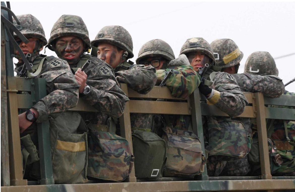
Los hombres de Corea del Sur, son entrenados para librar una guerra que de ocurrir puede poner en riesgo su supervivencia como nación.

En la actualidad hay efectivos coreanos desplegados en varias misiones, por ejemplo, en Líbano (unos 250), en Sudán del Sur (280) y en Emiratos Árabes Unidos (170). Además, cuenta con unos 300 efectivos en las aguas frente al cuerno de África y la península arábiga.