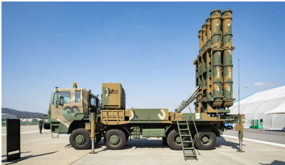
Sistema Antiaéreo Cheongung II KM-SAM, diseñado y producido en Corea del Sur.

El KM-SAM fue desarrollado por primera vez por la Agencia de Desarrollo de Defensa de Corea del Sur con el apoyo técnico de empresas rusas. Se basó en la tecnología del misil 9M96 utilizado en los sistemas de misiles S-350E y S-400, y se creó para reemplazar los misiles tierra-aire Hawk más antiguos que se adoptaron en 1964.