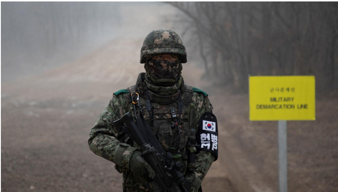
La que existe entre las dos Coreas, es una de las fronteras más vigiladas del mundo.