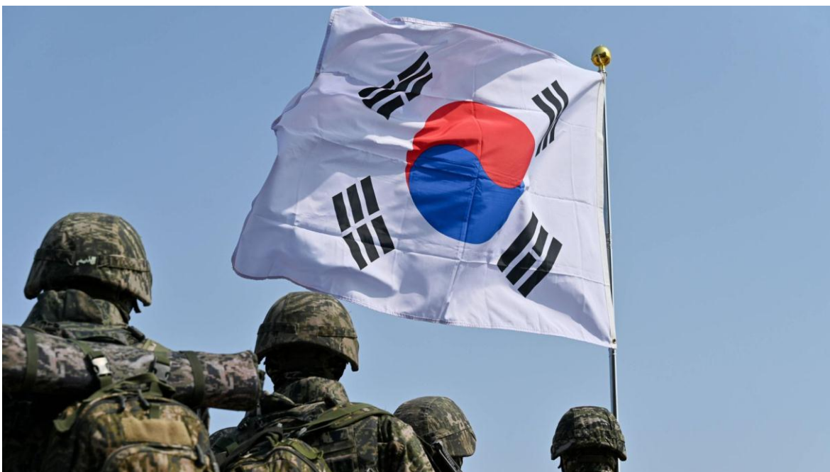
Corea del Sur invierte cerca del 4% de su Producto Interno Bruto en seguridad y defensa.