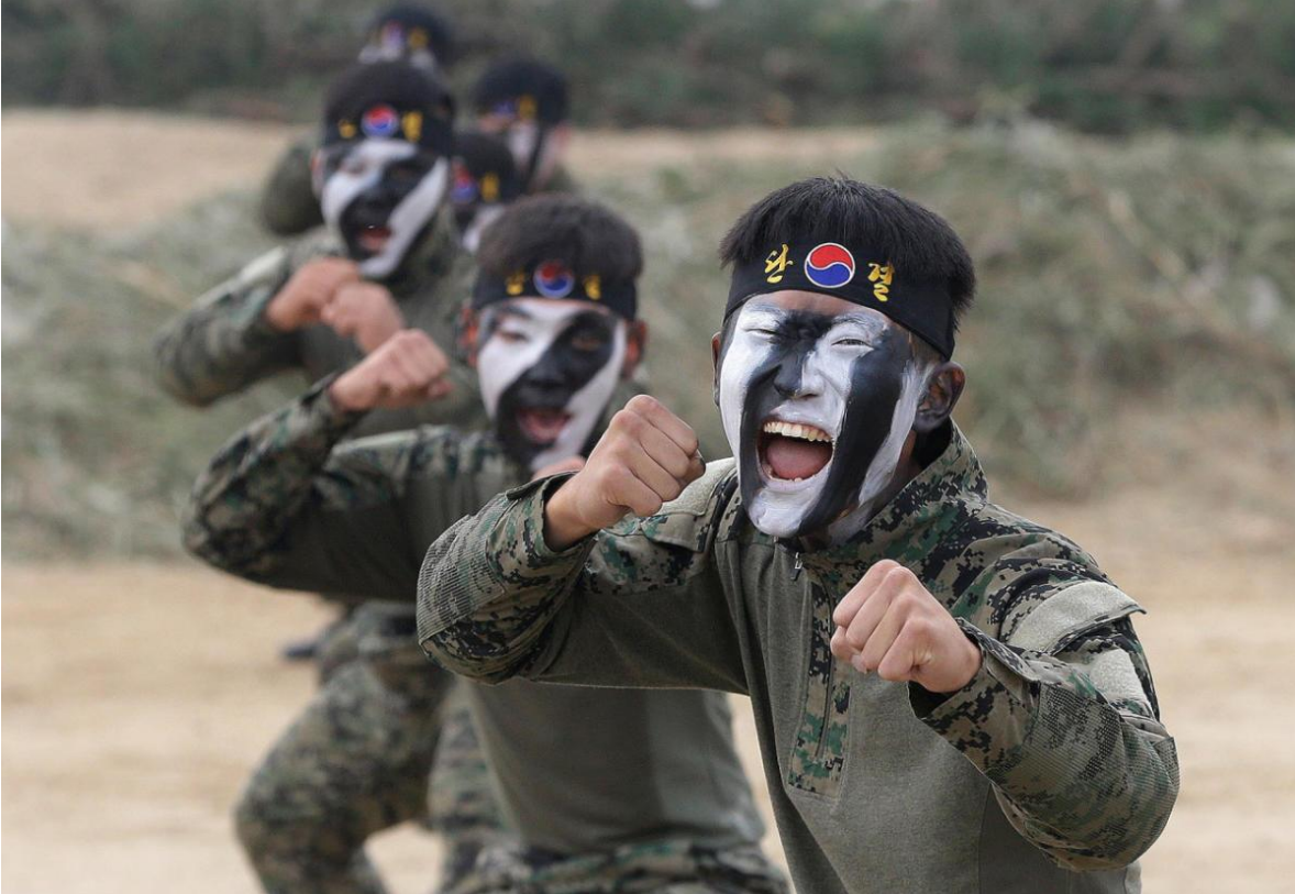
Las Fuerzas Especiales, son un cuerpo muy valorado en Corea del Sur. Su entrenamiento es permanente y altamente exigente. Están preparados para actuar en su propio territorio y también tras las líneas enemigas.

Cabe señalar que la actual administración ha iniciado un programa de auto-defensa, que busca que Corea del Sur sea capaz de contrarrestar totalmente la amenaza convencional de Corea del Norte con medios puramente nacionales (industria) en las próximas dos décadas. No hay que olvidar que Corea del Norte posee armas nucleares.