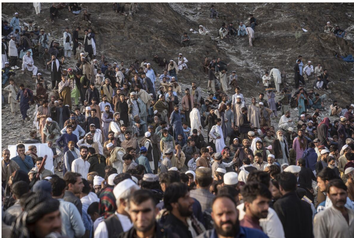
Pakistán ordenó que todos los afganos indocumentados deben abandonar el país y volver al suyo, sin importar que para muchos eso es una condena a muerte, o que se trate de descendientes de afganos (indocumentados) nacidos en Pakistán. En la foto, miles de afganos en la frontera esperando su destino.

El monumental desequilibrio que generó la abrupta retirada norteamericana de Afganistán, tras veinte años de una guerra, en la que además de ser derrotado, confirmó la legitimidad del Talibán, poniendo en riesgo la vida de casi 40 millones de afganos.