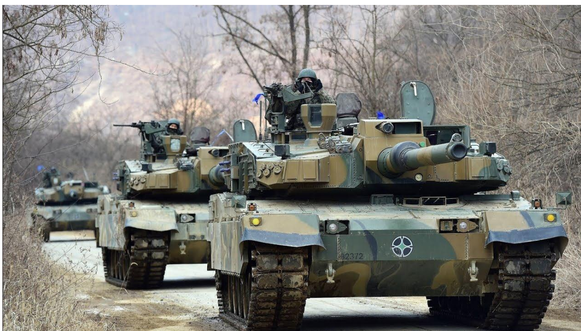
Tanques K2 Black Panther diseñados y fabricados por Corea del Sur.

Otro de los productos más emblemáticos de la industria armamentística de este país es el carro de combate K2 Black Panther, una de las joyas de la corona desarrollado por Hyundai Rotem en un momento en el que tanto se habla de los Leopard alemanes, Challenger británicos, Abrams estadounidenses o Leclerc franceses.