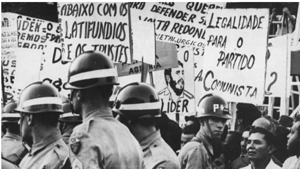
Protestas populares en Brasil, contra la dictadura militar.

Dos años después del inicio del régimen militar en Brasil, grupos armados de izquierda iniciaron una articulación que puso al país en estado de guerra civil no declarada. Entre 1966 y 1974, la izquierda armada robó 3,8 millones de dólares, cantidad que convirtió a la guerrilla brasileña en la más rica del mundo en ese momento. En el apogeo de las acciones, entre 1968 y 1971, los militantes asaltaron 154 establecimientos bancarios y vehículos blindados. La acción también implicó atentados: los grupos realizaron cerca de 40 atentados con bomba, secuestraron ocho aviones comerciales y cuatro diplomáticos, el único momento en la historia en que hubo secuestro de embajadores en Brasil.