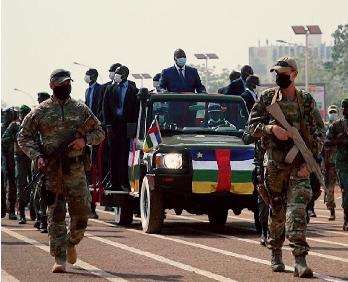
Hombre del Grupo Wagner, comprometidos en la seguridad presidencial de la República Centroafricana.

Aparentemente resuelta la rebelión del Grupo Wagner, del último fin de semana, (Ver: Rusia, un día que no estremecerá al mundo), una de las primeras preguntas que surgieron es qué será de la suerte de la empresa de Yevgeny Prigozhin, en los países africanos donde está operando y particularmente en Mali, cuya presencia comenzó a finales del 2021, tras el fin de la Operación Barkhane , el gran fracaso del ejército francés que después de diez años, debió retirarse, dejando detrás de sí una estela de acusaciones, que la responsabilizan de haber permitido la