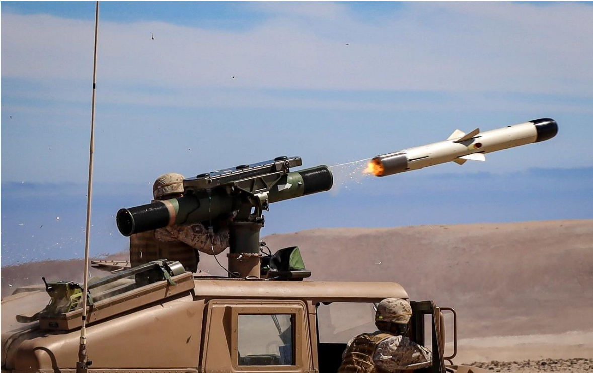
Lanzamiento de misil antitanque, en maniobras militares.

Aparte de ellas, el Ejército cumple también con muchas otras tareas de Responsabilidad Social, de Seguridad y de Ingeniería, entre otras, en apoyo a la sociedad a la que sirven, como, por ejemplo: presencia Antártica y soberanía en zonas aisladas, apoyo en control de fronteras, hipoterapia, operativos sociales a personas y animales en localidades aisladas, control y seguridad en procesos electorarios, ciberdefensa, etc.