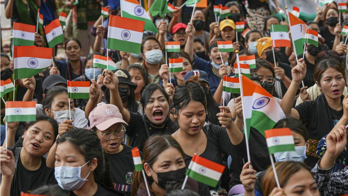
Miembros de la etnia Kuki protestan en la capital india.

Tras el inicio de la violencia étnica-religiosa del pasado tres de mayo, en el estado indio de Manipur, entre las tribus Meitei (hindúes) y los Kukis y Nagas (cristianos), que dejaron al menos ciento cuarenta muertos, más de quinientos heridos y cerca de ochenta mil desplazados, además de la destrucción y el saqueo de miles de viviendas, locales comerciales, edificios públicos, junto a la quema de cientos de vehículos particulares y oficiales, docenas de iglesias y madires o devasthanas, (templos hindúes), ratificando esto último el carácter profundamente sectario de la crisis, que, si bien, parece, fue desactivada, permanece en un peligroso estado latente.