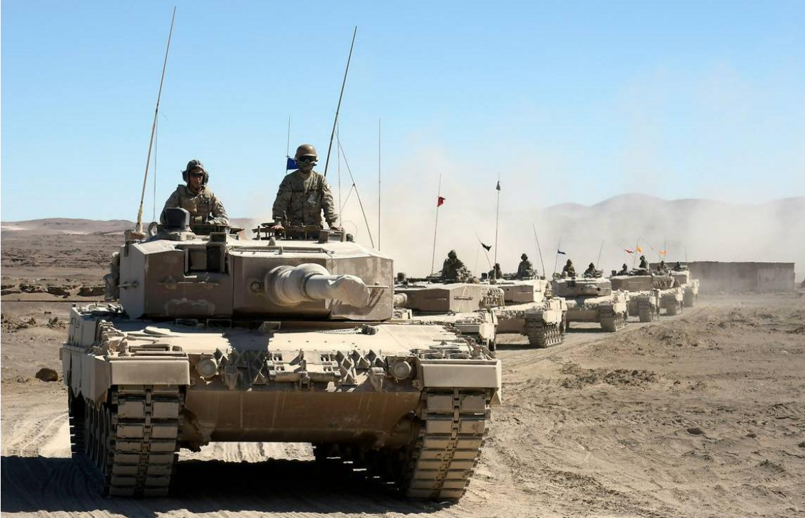
Tanques Leopard del Ejército de Chile.

en un conflicto moderno) y la obsolescencia técnica, (el equipo falla y no es técnica o económicamente rentable recuperarlo, por ejemplo vehículos con motores bencineros).