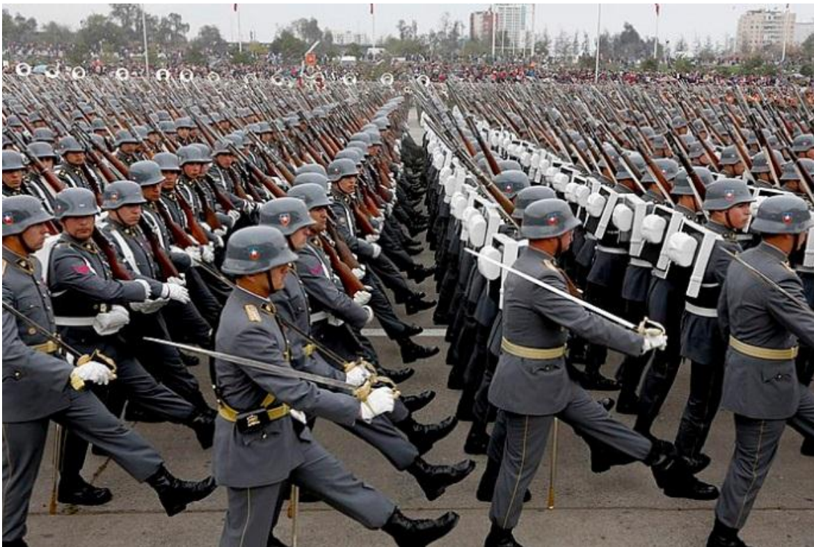
Uno de los uniformes del Ejército Chileno, semeja el uniforme alemán de la Segunda Guerra Mundial.