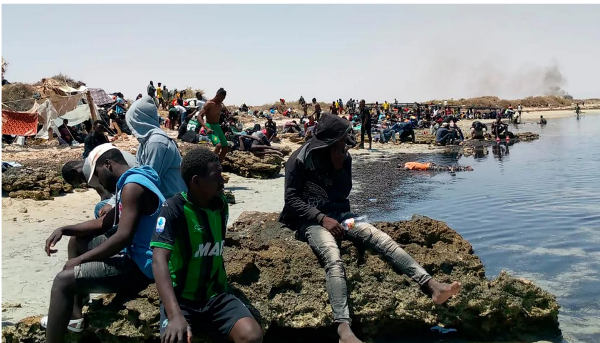
Refugiados del África subsahariana, varados en la costa tunecina.

Túnez ha sustituido a Libia como la última vía de escape hacia Europa, por los miles de desplazados que pasan por allí, tanto de África como de Medio Oriente y en menor escala, de Asia Central. Tras un peregrinaje de miles de kilómetros, que en muchos casos no logran terminar, muriendo en las soledades del Sahara, perdidos o abandonados en mitad del desierto, por traficantes que optaron por no concluir con su trabajo, los sobrevivientes pretenden llegar a algún puerto del sur del Mediterráneo, a riesgo de todo por llegar a la costa europea.