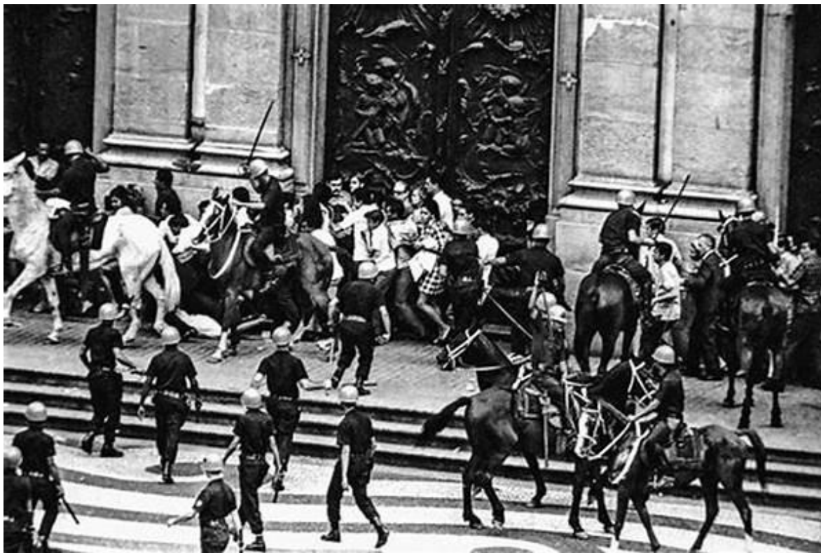
Protestas y represión en Brasil. 1968.

Dos años después del inicio del régimen militar en Brasil, grupos armados de izquierda iniciaron una articulación que puso al país en estado de guerra civil no declarada.