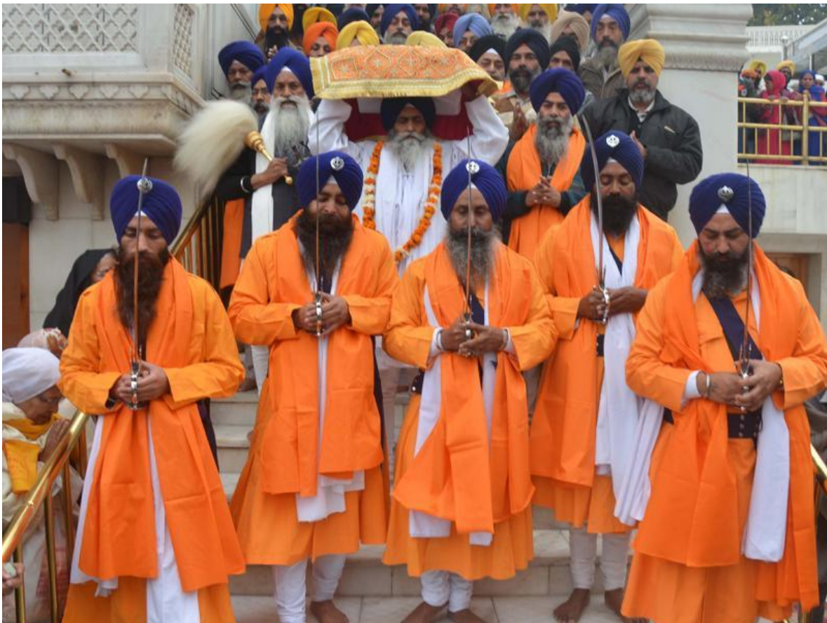
Ceremonia religiosa de los Sij de la India.

Mientras se esperaba con ansiedad en Washington, la visita oficial del Primer Ministro Narendra Modi, para el miércoles 21, en que Biden exigirá definiciones a la Unión India, respecto a sus vínculos tanto con Rusia como con China, un hecho que podría considerarse casi un homenaje a Modi, se produjo en una oscura playa de estacionamiento en la ciudad de Surrey, en la Columbia Británica, Canadá.