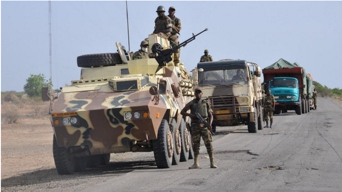
Vehículos livianos del Ejército de Camerún.