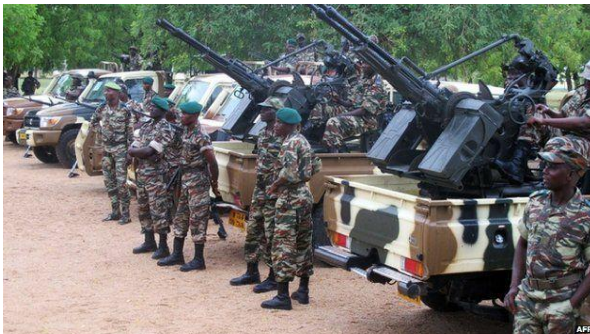
Sistemas antiaéreos del Ejército de Camerún.

estrechamente involucrados en la preparación de las fuerzas camerunesas para su despliegue en la disputada península de Bakassi.