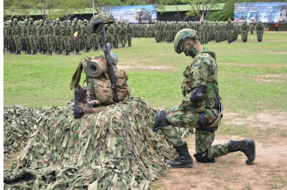
Minuto de silencio por los caídos en acción.

gobiernos interesados en que esto sea así, para poder dominarnos mejor.