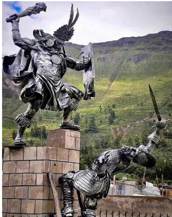
Munumento al guerrero Cahuide, en Perú.

Los cambios verificados en las últimas décadas, han sido producto de la influencia nefasta y continua de los Estados Unidos de América, en todos los órdenes de nuestra sociedad. Un proceso de adoctrinamiento sostenido y efectivo, ha llevado a nuestros militares a querer ser como ellos, y a asumir una actitud servil y obediente, olvidándose de quienes somos realmente.