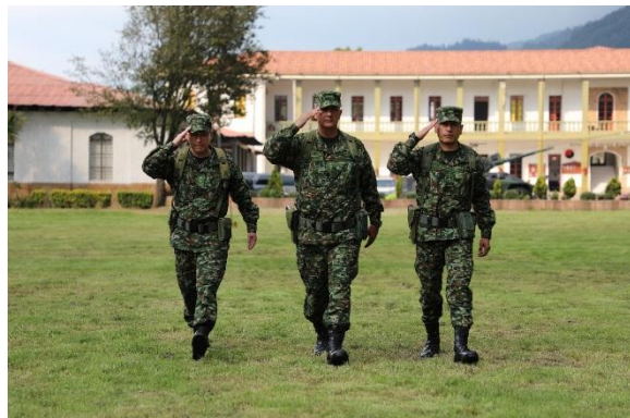
Oficiales del Ejército Nacional de Colombia en ceremonia militar. Portan uniforme de diseño y fabricación nacional.

En este orden de ideas, es necesario entender que hay agentes internos y también externos, interesados en disolver el tejido social, en atacar de múltiples formas todo aquello que nos haga fuertes como nación y que nos mantenga unidos. Interesados en destruir la fortaleza moral de nuestros ciudadanos, y en hacernos sentir que no hay un “nosotros”, y que el “yo” es mucho más importante y meritorio. Se nos induce a abandonar definitivamente el espíritu tribal a favor de lo individual, y a dejar atrás costumbres y tradiciones que favorecían la cohesión social. Por ejemplo: