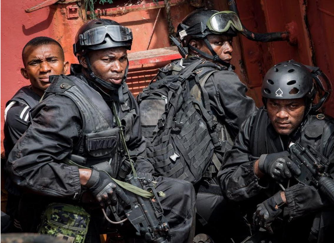
Fuerzas Especiales de Camerún.