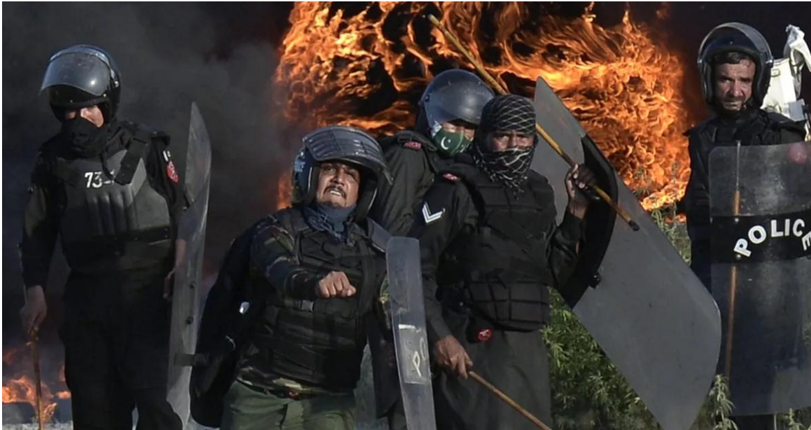
Protestas en Pakistán por el arresto de Imran Khan.

La crítica situación económica e mismo año, un fallido intento de intentos frustrados, desde marzo, institucional de Pakistán, obliga a asesinato, en medio de un evento fue en el marco de lo que se conoce considerar que, de profundizarse, masivo, que, de haberse como el caso del Fideicomiso de la podría arrastrar a los 232 millones concretado, no cabe duda, que se Universidad al-Qadir , una maniobra de ciudadanos, a una encrucijada habría saldado con miles de con la que él y su mujer Bushra Bibi, que podría derivar a una guerra civil. muertos no solo en Wazirabad se habría hecho, según la