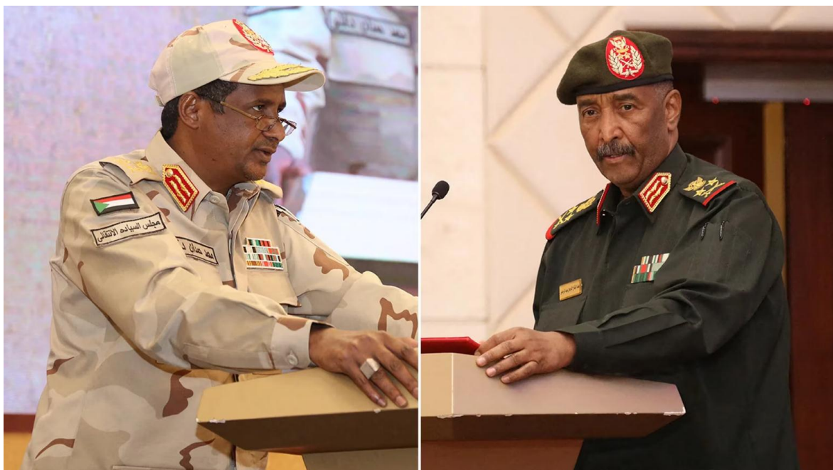
Jefes de los bandos enfrentados en Sudán: a la izquierda el general Mohamed Hamdan Dagalo y a la derecha el general Abdel Fattah Abdelrahman al-Burhan.

A una semana de las negociaciones que se desarrollan en la ciudad de Jeddah, Arabia Saudita, las dos partes involucradas en el conflicto armado de Sudán han alcanzado un primer acuerdo para permitir que todos los civiles abandonaran el área de conflicto de manera segura, y proteger los suministros civiles.