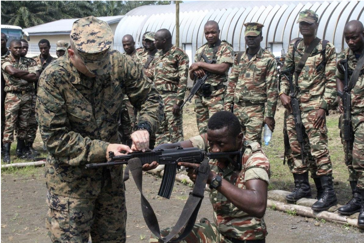
Tropas de Camerún recibiendo instrucciones por parte de asesores extranjeros.

En la Primera Guerra Mundial las fuerzas británicas invadieron Camerún desde Nigeria, el último contingente alemán se rindió en febrero de 1916. Tras la guerra, la colonia se dividió entre Gran Bretaña y Francia. Francia se queda con la porción más grande del territorio, creando el Camerún Francés, con capital en Yaundé.