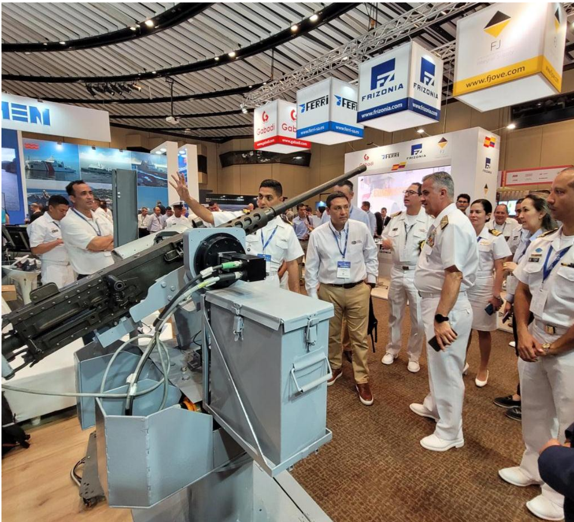
Presentación de la nueva RWS de producción nacional, en el marco de Colombiamar 2023.

Nuevamente la Armada Nacional de Colombia nos sorprende con un dispositivo tecnológico de desarrollo autóctono. Esta vez, la presentación fue en el stand de la Armada en la feria Colombiamar 2023. Evento realizado del 8 al 10 de marzo del 2023, en el Centro de Convenciones “Julio Cesar Turbay Ayala” de la ciudad de Cartagena de Indias, Colombia.