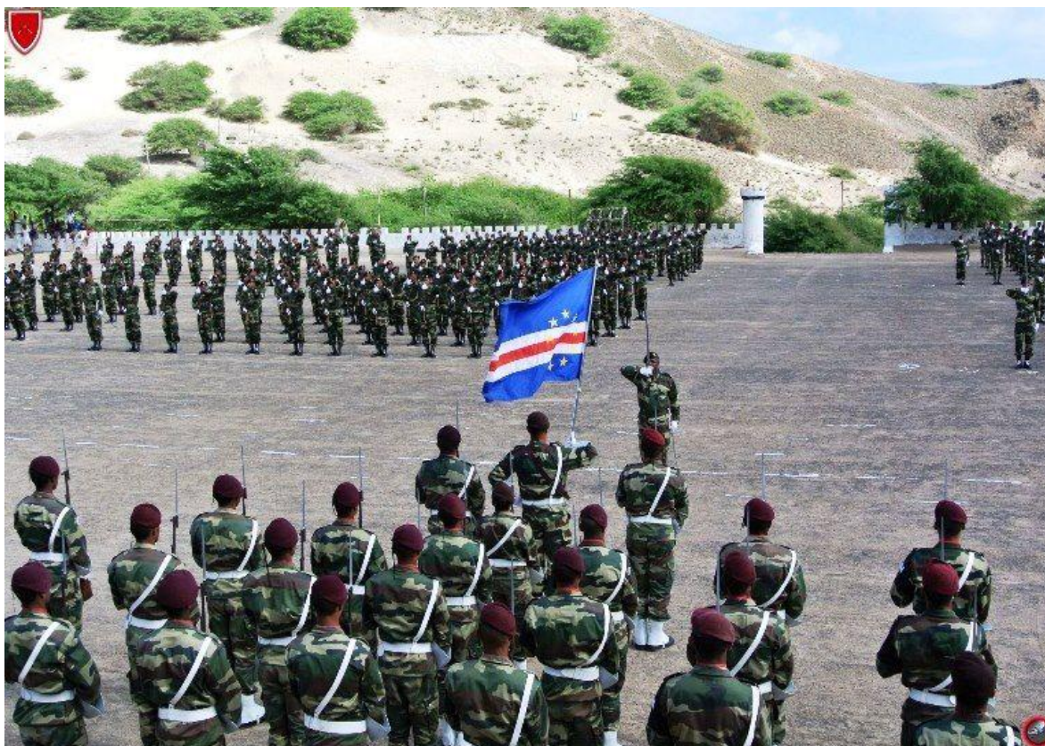
Ceremonia militar de la Guardia Nacional de Cabo Verde

La Guardia Nacional (Guarda Nacional) es la rama principal de las Fuerzas Armadas de Cabo Verde para la defensa militar del país, siendo responsable de la ejecución de operaciones en el medio ambiente terrestre y marítimo y el apoyo a la seguridad interna. Incluye: