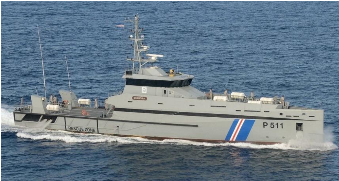
El patrullero más moderno de la Guardia Costera de Cabo Verde.

La Guardia Costera (Guarda Costeira) es la rama de las Fuerzas Armadas de Cabo Verde responsable de la defensa y protección de los intereses económicos del país en el mar bajo jurisdicción nacional y de proporcionar apoyo aéreo y naval a las operaciones terrestres y anfibas. Incluye: