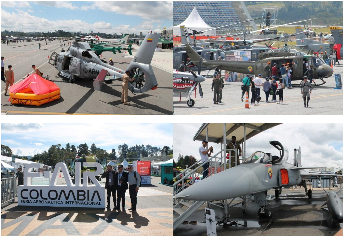
Tomas de la exposición estática en la F-Air 2019.

Como apasionado de los temas militares, he seguido el desarrollo de este evento y he asistido casi a todas sus versiones, solo no asistí a la primera, porque no fue suficientemente promocionada y me enteré cuando ya había pasado. A partir de allí he sido un asistente frecuente. Con la novedad de que en este evento los periodistas colombianos especializados en seguridad y defensa no contamos con prácticamente ningún privilegio que facilite nuestra labor, y el tema se maneja de forma masiva, incluso privilegiándose a los periodistas extranjeros. Hay una diferencia notable con el caso de Expodefensa, que no es un evento masivo, sino más bien cerrado y orientado al sector de la seguridad y la defensa. En todo caso, al estar en Colombia, particularmente en Medellín, he podido apreciar la evolución de la F-Air en sus distintas versiones, y he conversado con distintas personas sobre lo que se mueve tras bastidores.