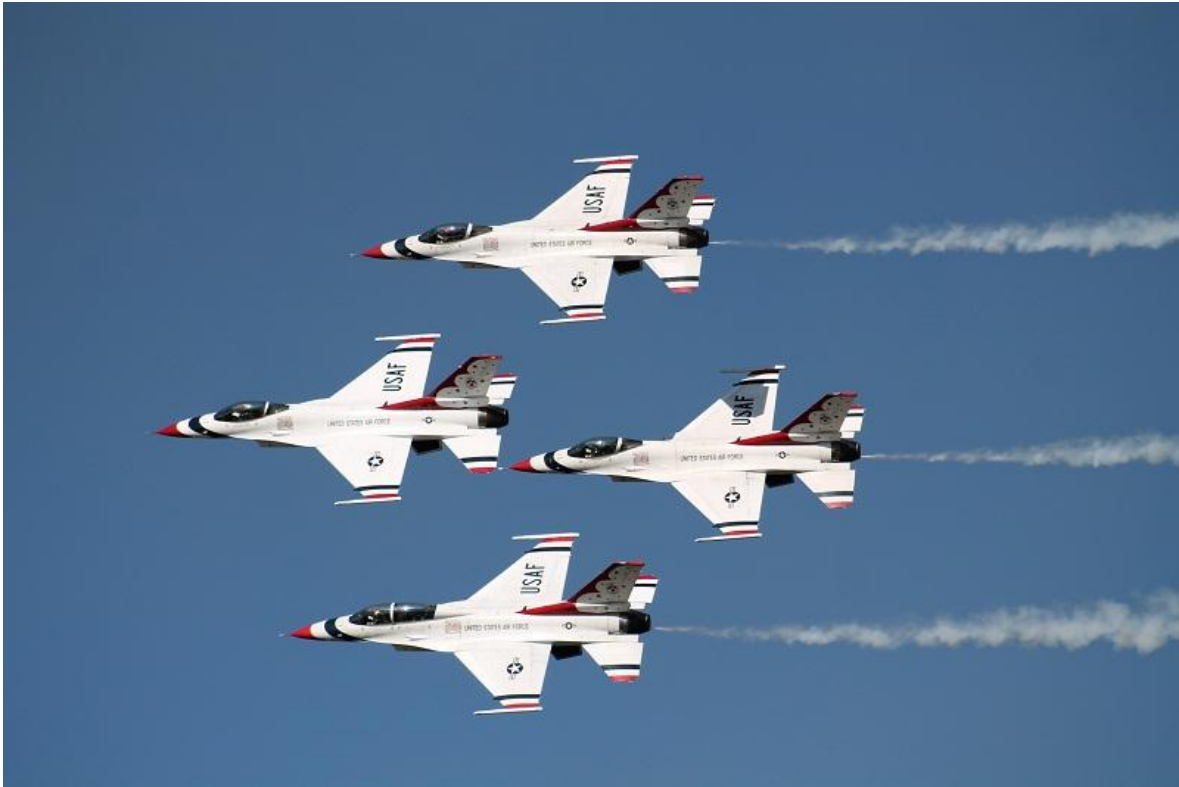
El equipo de demostración de la USAF está equipado actualmente con cazas F-16 Fighting Falcon.

Los Thunderbirds (en español: "Pájaros Trueno") es el nombre del Escuadrón de Demostración Aérea de la Fuerza Aérea de los Estados Unidos, USAF (en inglés, USAF Air Demonstration Squadron). Esta es una unidad especial de vuelo acrobático formada en 1953, y que realizó su primera exhibición aérea el 7 de julio de ese mismo año, haciendo uso de los aviones Republic F-84G Thunderjet. A medida que la tecnología ha ido avanzando, los aviones del equipo han ido cambiando, poseyendo siempre de lo más moderno en servicio.