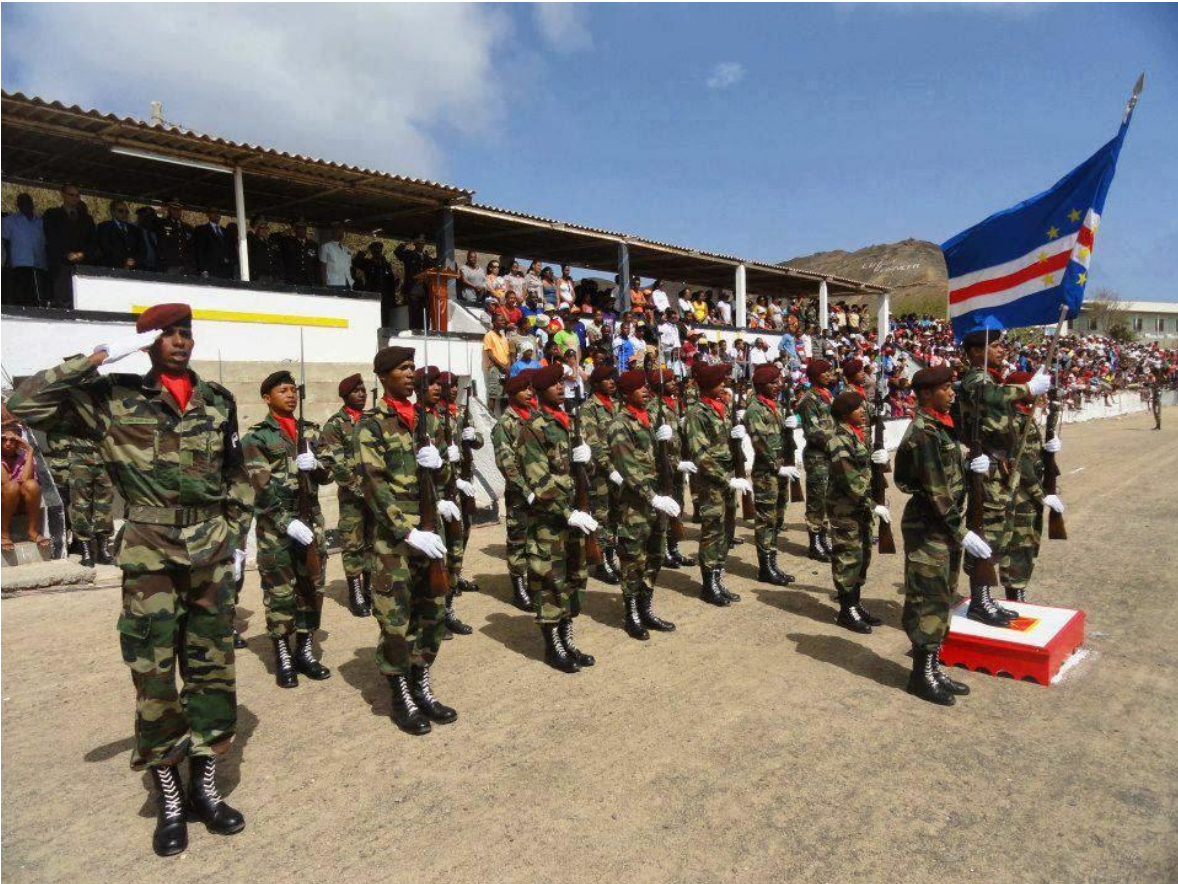
Tropas de la Guardia Nacional de Cabo Verde, en parada militar.

Tras haber librado sus únicas batallas en la guerra por la independencia contra Portugal entre 1974 y 1975, los esfuerzos de las Fuerzas Armadas caboverdianas se han volcado en la lucha contra el narcotráfico internacional. En 2007, junto con la policía caboverdiana, llevaron a cabo la Operación Lancha Voadora , una exitosa operación para acabar con un grupo de narcotraficantes que introducía cocaína desde Colombia hasta los Países Bajos y Alemania utilizando el país como punto de reabastecimiento. La operación duró más de tres años, siendo una operación secreta durante los dos primeros años, y terminó en 2010. En 2016, las Fuerzas Armadas de Cabo Verde estuvieron implicadas en la masacre de Monte Tchota, un incidente entre verdes que se saldó con once muertos.