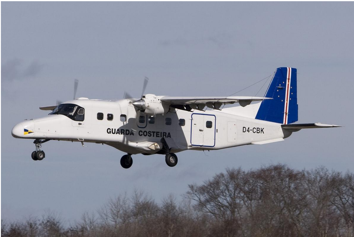
Avión ligero Dornier 228

El ejército de Cabo Verde solía tener su propio brazo aéreo; después de la capacitación del personal recibida de la URSS en 1982, se entregaron tres aviones Antonov An-26 a Cabo Verde; se creía que estos eran los únicos aviones militares que poseía la nación. Sin embargo, estos tres aviones se complementaron en 1991 con un avión ligero Dornier 228 equipado para uso de la Guardia Costera y, a fines de la década de 1990, con un avión EMB-110 de Brasil, equipado de manera similar para operaciones marítimas. El gobierno ha estado en negociaciones con China para adquirir helicópteros polivalentes para uso militar y civil.