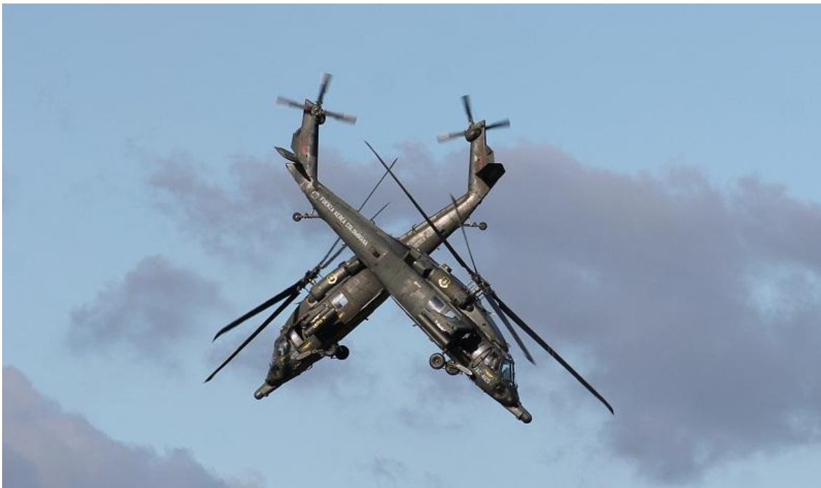
Helicópteros UH-60 Arpia en demostración de maniobrabilidad de alto performance

Se aproxima la nueva versión de la Feria Aeronáutica Internacional de Rionegro, y hay mucha expectativa al respecto, pues la última vez, en el 2019, hubo diversas falencias logísticas, atribuibles al operador correspondiente, que en este caso fue Corferias. El ingreso diario era una odisea; el tema de la insuficiencia de baños portátiles fue traumático; muchos de los chicos que contrataron para apoyar la logística tenían muy mala presencia, y no estaban enterados de nada. El horario de los eventos era confuso, y los alimentos y bebidas dentro de la feria, carísimos. La edición del 2019 fue definitivamente, terrible. Por supuesto, deseamos que todo mejore, y que nuestra feria continúe ganando en prestigio y alcance, por eso esta crítica debe tomarse como una oportunidad y no como algo negativo.