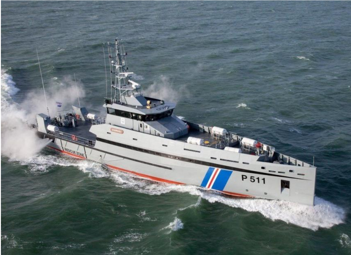
Se puede decir que una función medular de las Fuerzas Armadas de Cabo Verde, es la lucha contra el narcotráfico. En ese cometido el patrullaje y la interdicción naval son fundamentales.